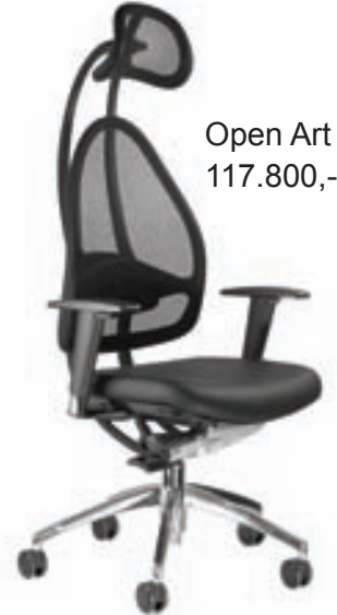
Open Art 117.800,-

Dönsku Prima línunni má raða saman á ótal vegu. Níðsterk og endingargóð húsgögn á mjög góðu verði, til afhendingar strax.