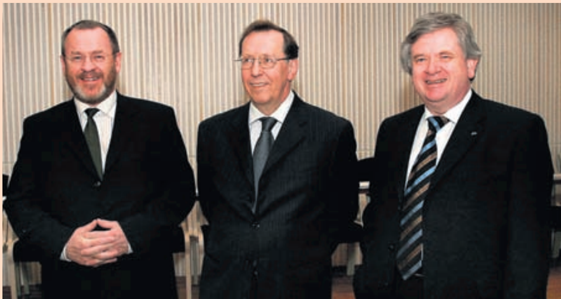
ÞRÍR SEÐLABANKASTJÓRAR Fyrir árið 2009 voru þrír seðlabankastjórar á Íslandi.