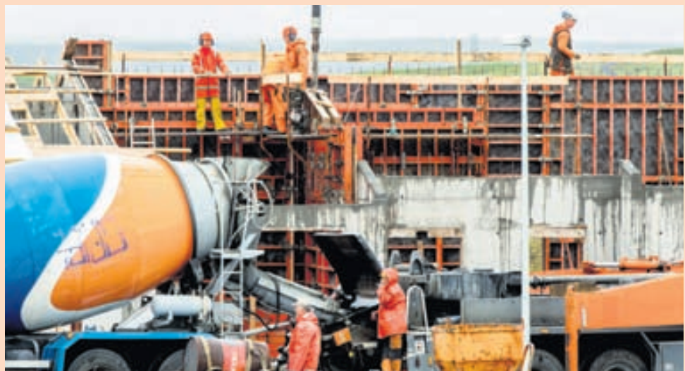
VINNUAFL Atvinnuleysi mældist 4,5 prósent á þriðja ársfjórðungi 2013. FRÉTTABLAÐIÐ/VILHELM

stjórnandinn geta hvort án annars verið og það sama má segja um stjórnendur og starfsmenn á vinnustöðum. Hlutverk stjórnandans er að miðla sýn fyrirtækisins, stefnu og markmiðum, sinna upplýsingagjöf og hvetja starfsfólkið sitt áfram. Enn fremur verður starfsfólkið að hafa undir höndum nóturnar til að geta spilað sitt hlutverk. Hver og einn verður að vita til hvers er ætlast af honum. Þegar vel er vandað til og samspilið myndar tónverkið, fyllist áheyrandinn gleði. Þannig eru þær væntingar sem hann hafði varðandi þá þjónustu sem hann keypti uppfylltar og takmarkinu er náð. Starfsmennirnir geta líka verið sáttir við sína eigin frammi-stöðu. Staðan er „win – win“.