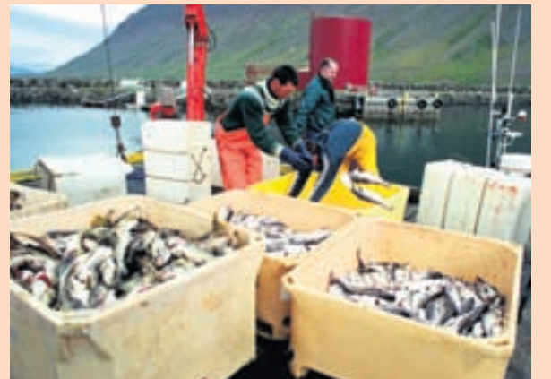
AFLANUM LANDAÐ Verðmæti afla sem keyptur er á markaði til vinnslu innanlands dróst saman um 0,8 prósent milli ára.

Aflaverðmæti íslenskra skipa á fyrstu ellefu mánuðum síðasta árs dróst saman um rúmlega 7,1 milljarð króna á milli ára, eða 4,6 prósent. Veidar á fyrstu ellefu mánuðum síðasta árs skiluðu 143,9 milljörðum króna í aflaverðmæti en 151 milljarði á sama tímabili 2012, samkvæmt frétt sem Hagstofa Íslands birti á vef sínum í gær. Þar segir að aflaverðmæti botnfisks hafi verið tæplega 85,2 milljarðar króna og dregist saman um 5,1 prósent. Þar af skiluðu veidar á þorski 43,4 milljörðum, sem var samdráttur um 5,4 prósent frá fyrra ári, og ýsuveidar 11,2 milljörðum, sem var 4,9 prósent samdráttur. Verðmæti uppsjávarafra nam tæpum 44,4 milljörðum króna og dróst saman um 4,1 prósent frá fyrra ári. Aflaverðmæti loðnu nam 15,6 milljörðum, og jókst um 18,2 prósent, og verðmæti kolmunna jókst um 9,4 prósent, var tæplega þrjú milljarðar króna. - hg