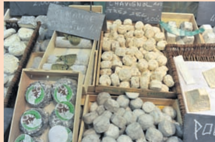
OSTUR OG LÍFRÆNN KJÚKLINGUR Hagar sóttu um tollfrjálsan innflutning á nokkrum sérvörum sem ekki eru framleiddar hérlandis.

Hann segir samkeppniseftirlitið telja að tollkvótar hafi í för með sér neikvæð áhrif á samkeppni sem valdi bæði atvinnulífi og neytendum tjóni. Takmarkanir eða stýring á innflutningi