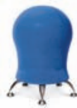
Sitness 6 44.900-