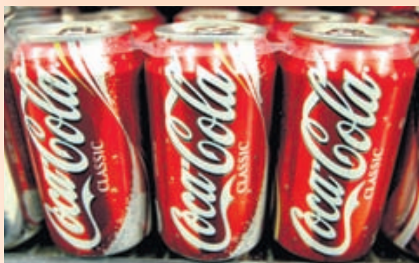
KÓKID Verð hlutabréfa í Coca-Cola féll um 4,3 prósent við opnun markaða í gær.