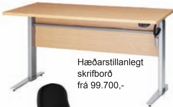
Hæðarstillanlegt skrifborð frá 99.700,-

Dönsku Prima línunni má raða saman á ótal vegu. Níðsterk og endingargóð húsgögn á mjög góðu verði, til afhendingar strax.