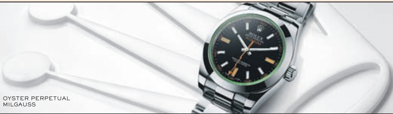
OYSTER PERPETUAL MILGAUSS