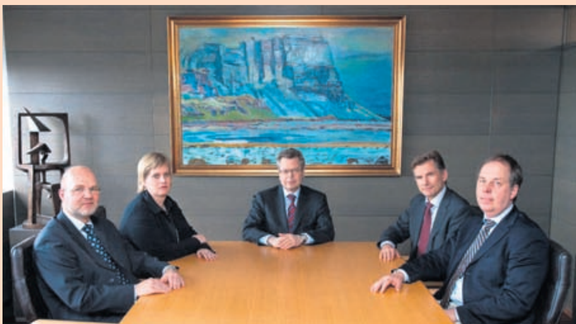
PENINGASTEFNUNEFND Fimm skipa peningastefnufnd Seðlabankans í dag.