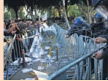
MÓTMÆLT VIÐ ÞINGHÚSIÐ Samkvæmt samningi Kýpur um neyðaraðstoð þarf landið að afla 1,4 milljarða evra (217 milljarða króna) með sölu ríkisfyrirtækja.

Ríkisstjórnin sagði að yrðu lögin ekki samþykkt ætti landið á hættu gjaldprot á næstu mánuðum. - ók