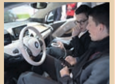
TAKKAVITLEYSINGAR? Gestir á tæknisýningu Mobile World Congress á Spáni 26. síðasta mánaðar prófa að tengja snjallsíma sína við ConnectedDrive-kerfi BMW.

Volkswagen er svo meðal bílaframleiðenda sem starfa með Google Inc. við að gera Android-síma óaðskiljanlega kerfi bíla. Vonir Google standa til þess að ljúka því að tengja Android-síma við bíla fyrir lok þessa árs. Martin Winterkorn, forstjóri Volkswagen, sagði í Genf að bílar væru að færast í þá átt að vera eins og fartölvur „með byltgarkennendum afleiðingum fyrir framtíðina“. Viðskiptavinir framtíðarinnar sagði hann að gætu mögulega uppfært hugbúnað bíla sinna heima í bílskúr. Winterkorn spár því líka að stafræna byltgingin í bílaframleiðslu breyti hefðbundnu