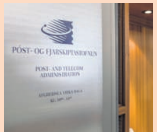
PFS Stofnunin mun birta opinberlega allar umsagnir og athugasemdir sem berast.

Frá þessu er greint í frétt á vef PFS þar sem segir að stofnunin ætli að veita samþykki sitt fyrir fyrirhugaðri samnýtingu. Það verði hins vegar ekki gert fyrir en áhugasamir hagsmunaaðilar hafi skilað inn umsögnum. Stofnunin tekur fram að samráðið taki eingöngu til samnýtingar tíðna en ekki samkeppnislegra áhrifa sem af samstarfinu kunni að stafa. Því eigi hagsmunaaðilar sem vilji tjá sig um slík áhrif samstarfsins að beina þeim til Samkeppnis-eftirlitsins.