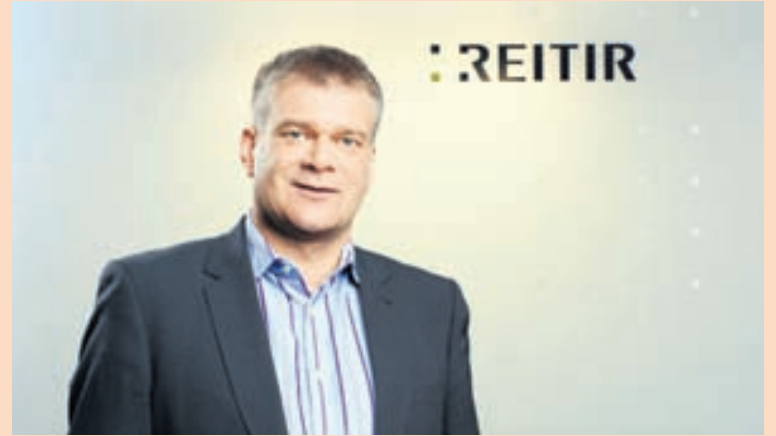
FORSTJÓRINN Stefnt hefur verið að skráningu Reita á markað frá stofnun félagsins í lok árs 2009.

„Viðaukarnir voru partur af endurskipulagningu okkar því erlendi bankinn féllst ekki á að koma inn í eigendahópinn eins og hinir lánveitendurnir sem yfir-tóku Landic Property. Þýski bankinn féllst einungis á að vera lánveitandi og þá voru gerðir viðaukar við lánasamninga sem