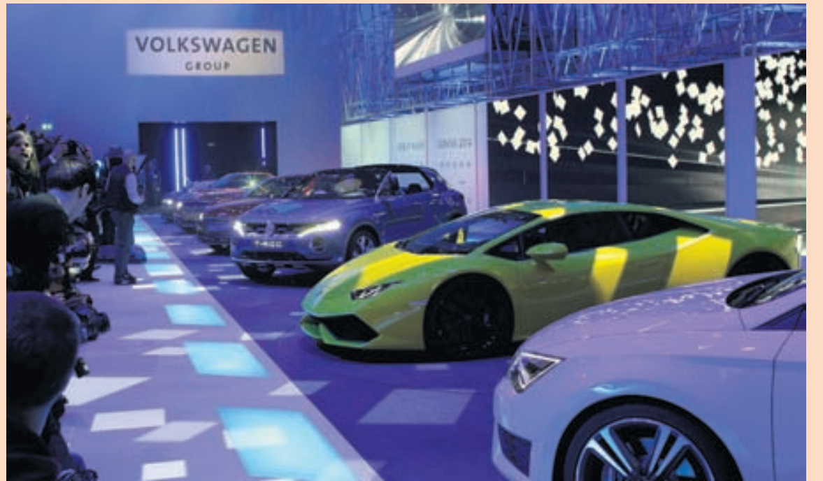
FORSÝNING HIÁ VOLKSWAGEN Gestir á forsýningu Volkswagen Group í Genf í Sviss á mánudag. Sýningin er hluti af 84. alþjóðlegu bílasýningunni í Genf og gladdi þar meðal annars augun nýr gulur Lamborghini Huracan. Sýningin er opin gestum og gangandi 6. til 16. þessa mánaðar.

Að auki jókst velta fyrirtækisins um 25 prósent á árinu. TM Software er dótturfélag Nýherja og það sérhæfir sig í framleiðslu á eigin hugbúnaðarvörum og ráðgjöf og þjónustu á sérhæfðum hugbúnaðarlausnum. - hg