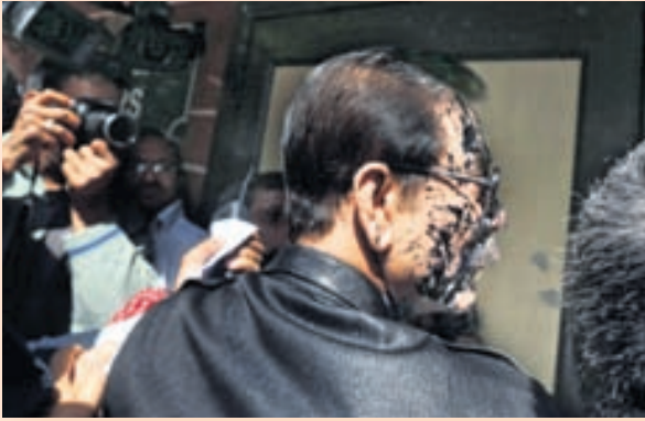
Á LEIÐ FYRIR DÓMARA Subrata Roy fékk yfir sig blekgusu frá reiðum lögmanni þegar verið var að leiða hann fyrir dómara í gær.

Sakaður um fleiri hundruð milljarða fjárvik: