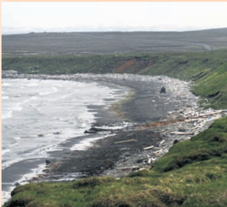
Í FINNAFIRÐI Framkvæmdir við höfnina gætu hafist árið 2018.

Sigmundur Davíð Gunnlaugsson forsætisráðherra og Ragnheiður Elín Árnadóttir, iðnaðar- og viðskiptaráðherra, voru viðstödd undirritunina. -hg