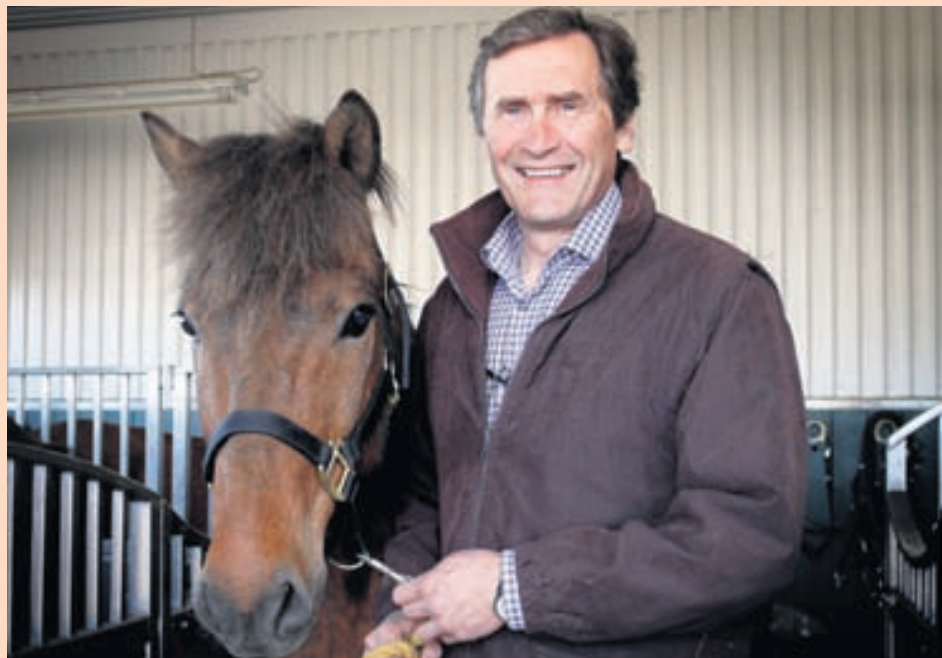
Í HESTHÚSINU Grímur er mikill hestamaður og ætlar að ríða norður í Húnavatnssýslur í sumar.

„Ég er einnig búinn að stunda hestamennsku í 15 ár. Ég fer alltaf með vinahópnum í hestaferð á hverju sumri og það á að ríða norður í Húnavatnssýslur í ár. Svo fer ég í lax með bræðrum mínum, vinum og sonum á hverju sumri og svo slær maður golfbolta þess á milli með frúnni og félögum. Þannig að það er nóg að gera.“