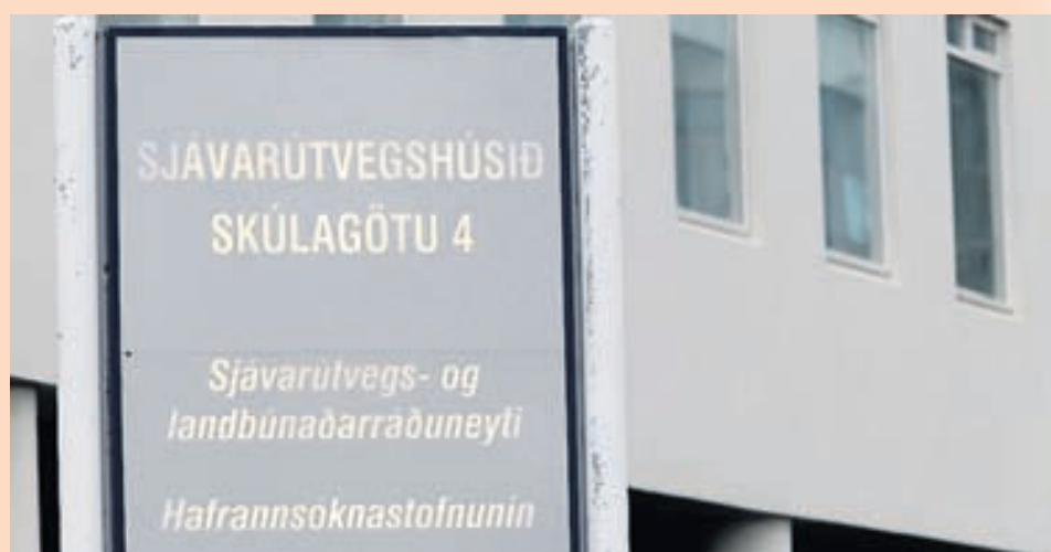
RÁÐUNEYTIÐ Í MÁLALÍBÚNAÐI Haga og Aðfanga, Innnes og Sælkeradreifingar á hendur íslenska ríkinu er framkvæmd við uppboð tollkvóta og gjaldtaka ríkisins tengd henni sögð ólögmæt.

Í málunum er einnig lagt upp með að ákvörðun ráðherra um toll á innflutning samkvæmt WTO- og ESB-kvótum og gjaldtaka í tengslum við uppboð á kvótunum feli í sér skattheimtu í merkingu stjórnarskrár. „Sú skattheimta er valkvæð og framkvæmd hennar bæði óskýr og ófyrirsjáanleg fyrir gjaldendur,“ segir í stefnu og því haldið fram að framkvæmdin eigi sér ekki viðhlítandi stoð í lögum og sé andstæð ákvæðum stjórnarskrár um bann við því að eftirláta stjórnvöldum val um það hvort skattheimta fari fram og hvernig. Ráðherra er því sagður hafa tekið sér vald sem samkvæmt skýrum ákvæðum stjórnarskrár sé einungis á hendi löggjafans.