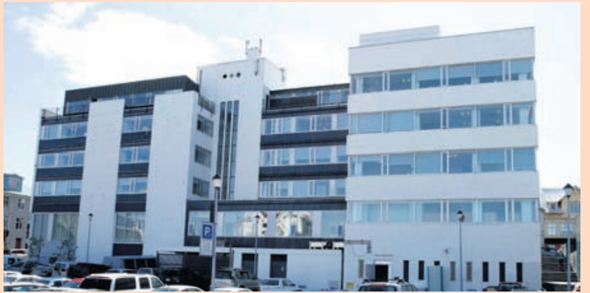
Á BILASTÆÐINU Landsbankinn og Valitor voru áður með skrifstofur og útibú við Laugaveg 77.

Í nýrri skýrslu Íslandsbanka um fasteignamarkaðinn er gert ráð fyrir að íbúðaverð eigi eftir að hækka enn meira á þessu ári. -hg