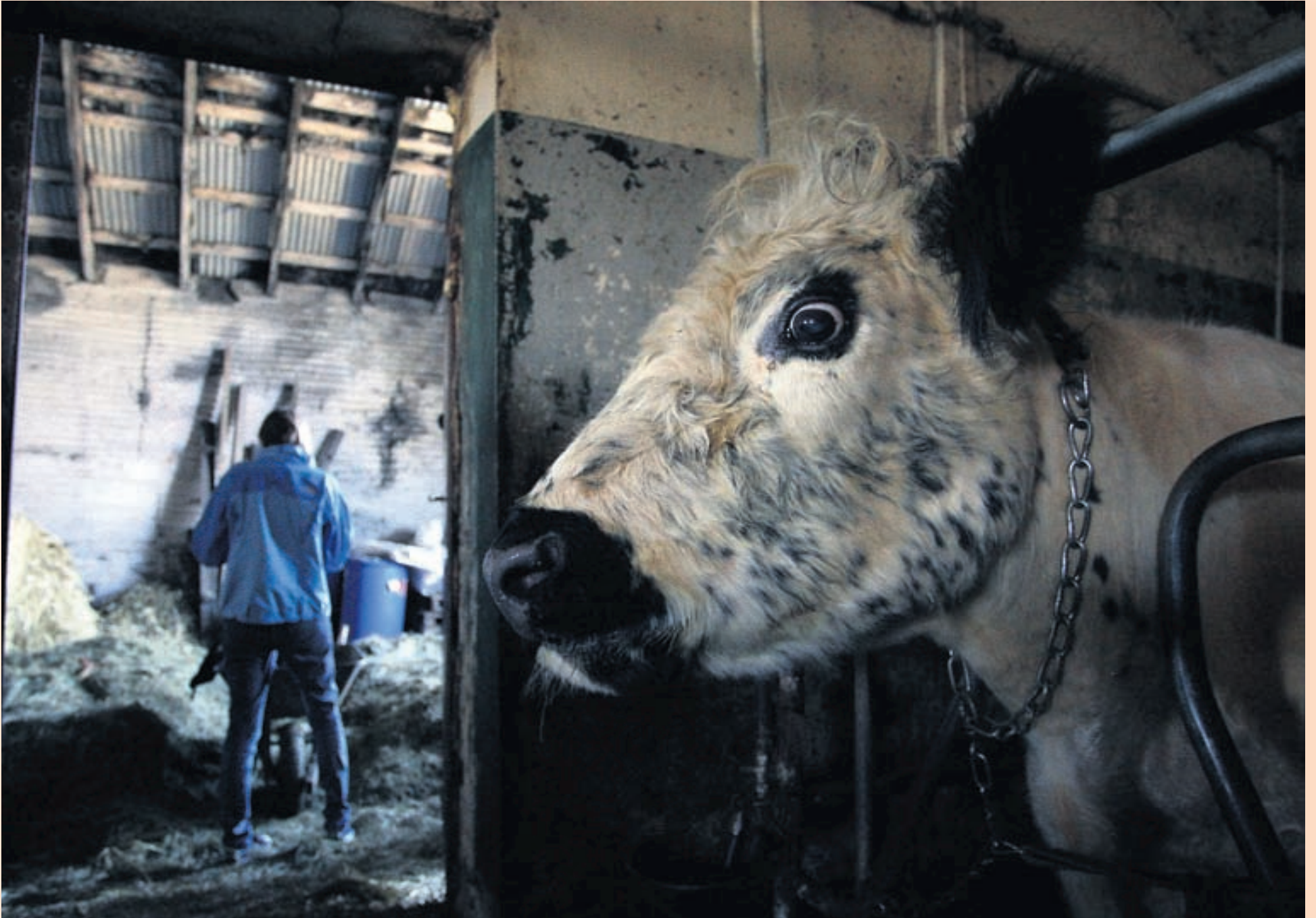
BOLAKÁLFUR Á BÁS SÍNUM Forsvarsmenn Samtaka verslunar og þjónustu segja augljóst að skortur sé á innlendu nautakjöti og útséð um að innlendir framleiðendur fái bætt þar úr. Ný verðskrá sláturleyfishafa sýnir yfir 21% hækkun ungnautakjöts í fyrsta flokki hjá stórum framleiðendum.