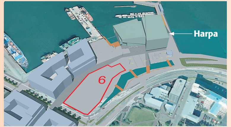
TEIKNING AF SVÆÐINU Landsbankinn keypti svokallaðan reit 6 við Austurhöfnina af Síтусi ehf., dótturfélagi Reykjavíkurborgar og ríkisins.