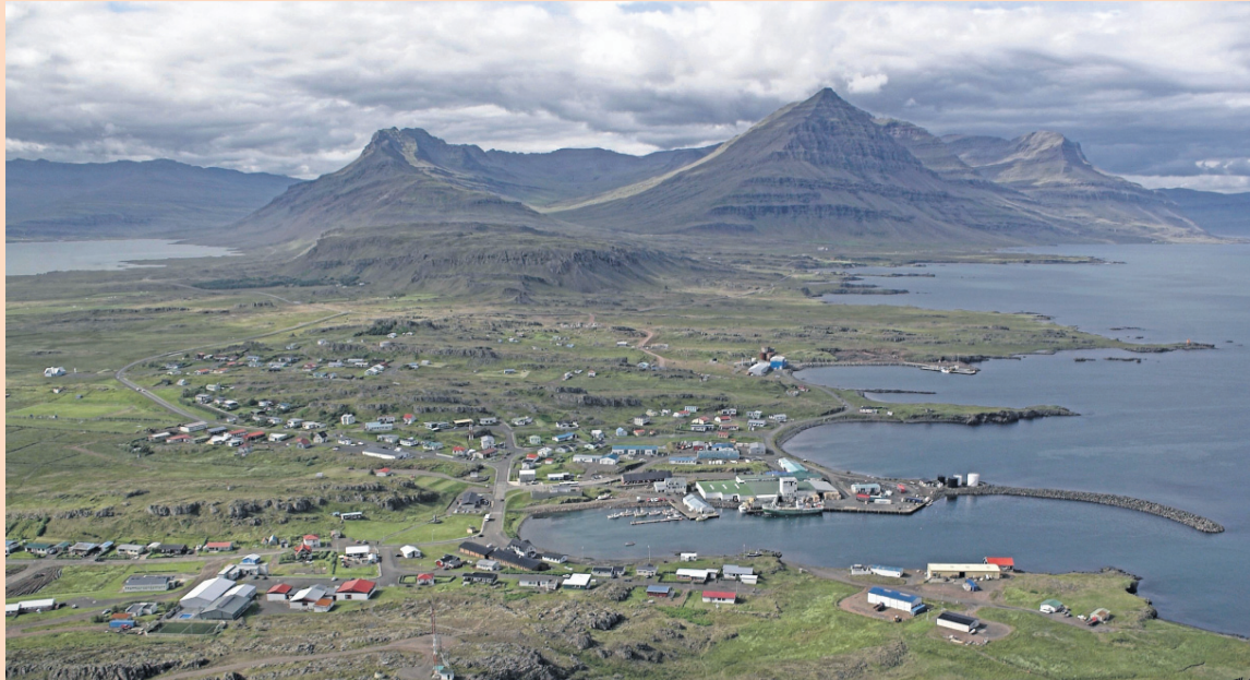
FYRIR AUSTAN Djúpavogshreppur mun leggja 250 þúsund krónur til stofn- kostnaðar frumkvöðlasetursins.

Í tilkynningu frá Austurbrú segir að þjónusta við frumkvöðla og aðstoð við stofnun og rekstur