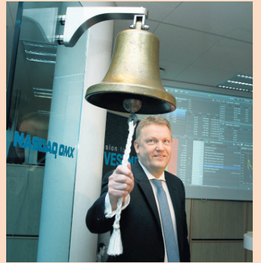
Í KAUPHÖLLINNI Uppgjör Sjóvár er það fyrsta frá skráningu félagsins á markaði í apríl síðastliðnum.

„Ávöxtun á innlendum fjárfestingum á fyrsta ársfjórðungi og afkoma félagsins á fjórðungnum því undir væntingum. Ræður þar mestu lækku á verði ríkisskuldabréfa,“ sagði Hermann.