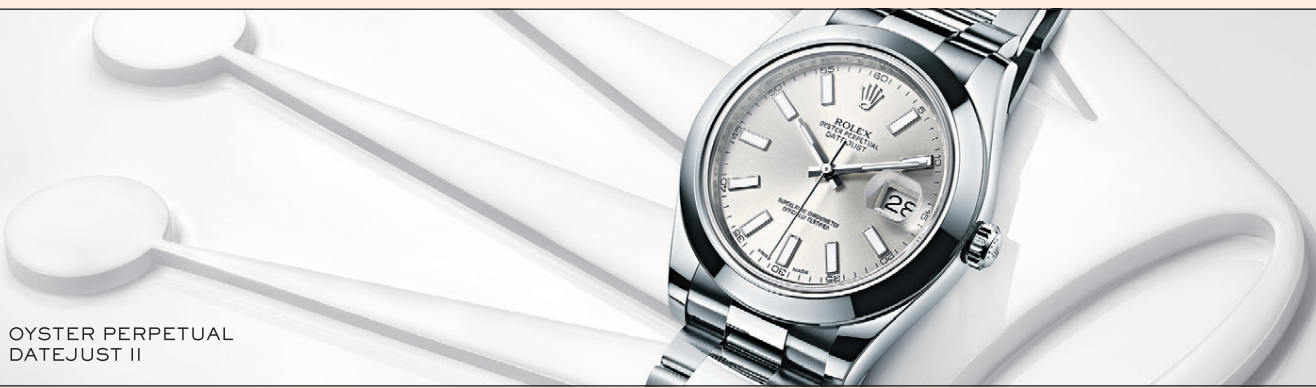
OYSTER PERPETUAL DATEJUST II