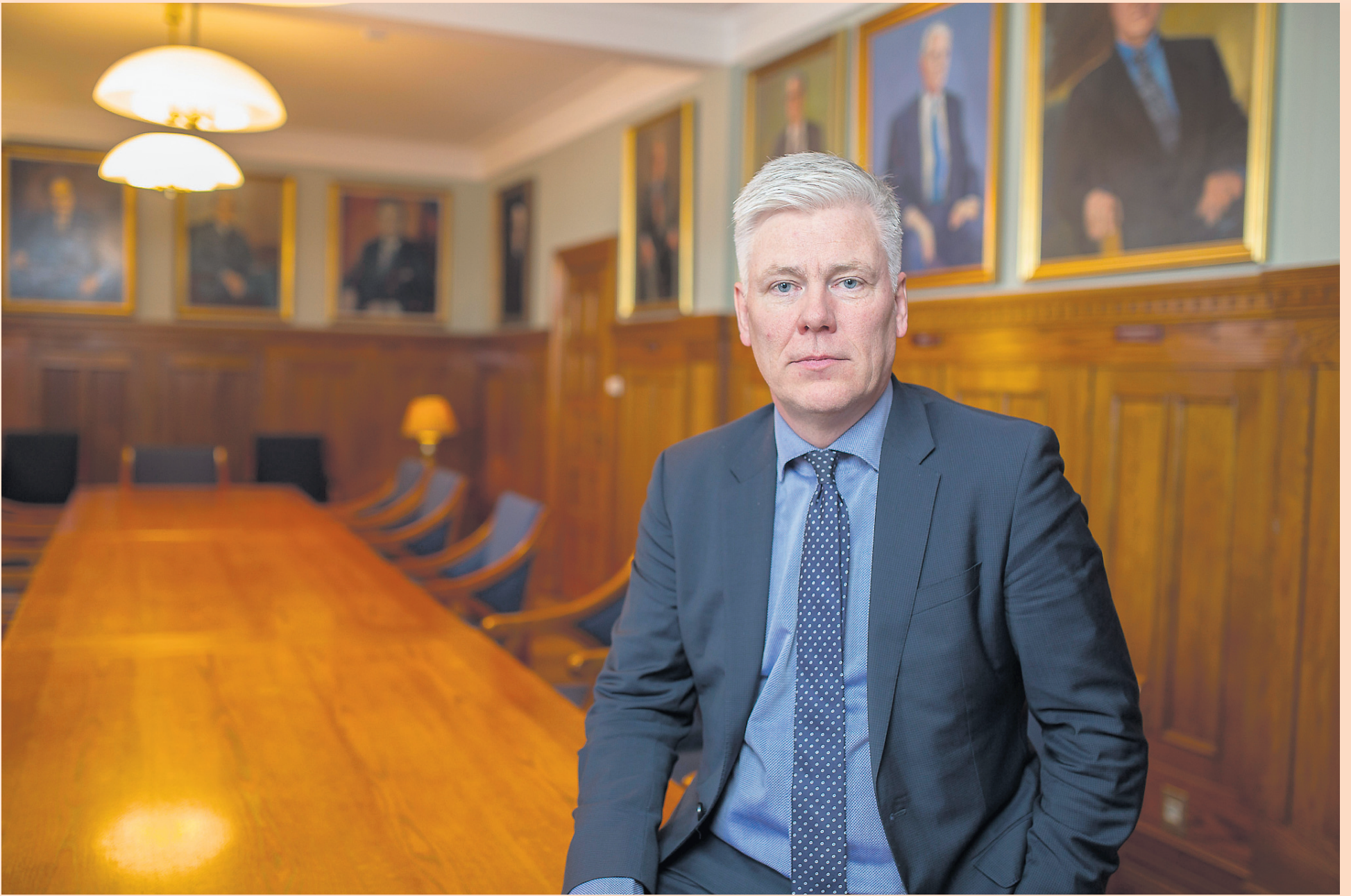
Í BANKANUM Steinþór segir núverandi höfuðstöðvar Landsbankans byggðar fyrir annars konar starfsemi og aðra tíma. Bankinn greiði fleiri hundruð milljónir króna í húsaleigu á hverju ári.