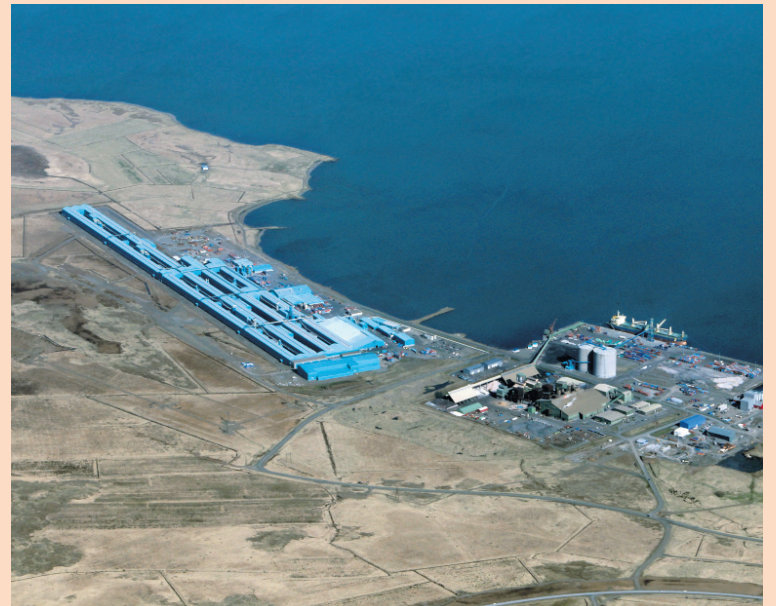
Á GRUNDARTANGA Verksmiðja Silicor Materials yrði samkvæmt áætlunum um 93.000 fermetrar að stærð og framkvæmdasvæðið alls um 223.000 fermetrar.

Sveitarstjórn Hvalfjarðarsveitar barst fyrr í vor erindi frá nefnd ríkisins um ívilnanir vegna nýfjárfestinga. Þar kemur fram að Silicor hafi óskað eftir ívilnunum vegna fyrirhugaðra framkvæmda. Ívilnanir fela í sér afslætti af ýmsum opinberum gjöldum og sköttum. Hvalfjarð-