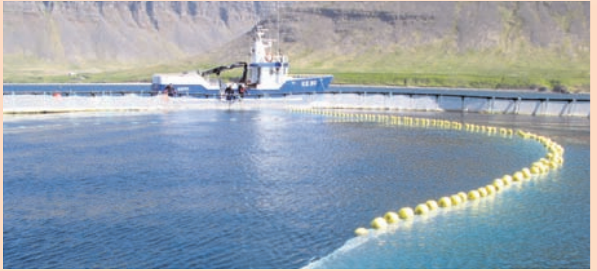
FISKELDI FJARÐALAX Framleiðsla á laxfiskum mun fljótlegra tvöfaldast á suðurfjörðunum og gera má ráð fyrir að fljótlegra skapist enn meiri verðmæti í fiskeldi eða allt að þrjár milljónir króna á hvert mannsbarn á suðurfjörðum Vestfjarða.

Stundum er munur á útlendu verði og innlendu svo mikill að maður veltir fyrir sér hvort verslanir og jafnvel heildsalar hér á landi kaupi varninginn fullu verði í verslunum í útlöndum.