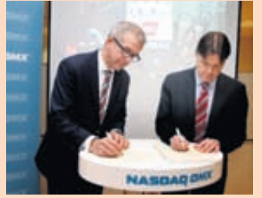
Í KAUPHÖLLINNI N1 var skráð á markað í desember síðastliðnum.