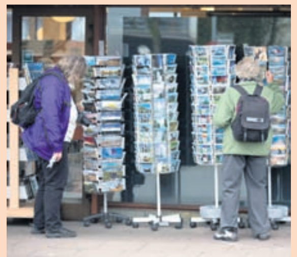
ÁBYRG FERÐAPIJÓNUSTA Ferðamálastofa segir gæði og umhverfisvernd geta veitt fyrirtækjum og ferðapjónustuaðilum forskot meðal samkeppnisaðila.