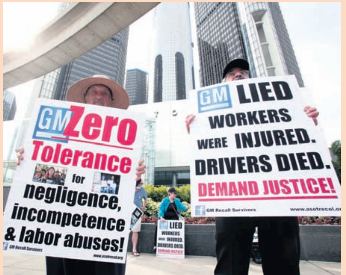
MÓTMÆLA- OG HLUTHAFAFUNDUR Tveir Detroit-búar mótmæla fyrir framan höfuðstöðvar General Motors þar sem árlegur hluthafafundur fór fram í gær. Mennirnir hafa mótmælt í nokkra daga fyrir utan byggingu General Motors en hluthafafundurinn er haldinn á sama tíma og 85 lögsöknir hafa verið höfðaðar gegn fyrirtækinu vegna bilunar í kveikjúlásam.