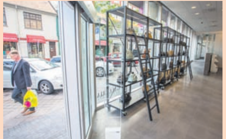
LÍF OG FJÖR Á LAUGAVEGI Húsnæðið að Laugavegi 77 er að lífna við með innkomu margra nýrra þjónustufyrirtækja í húsið.

Verslunin er í 400 fermetra húsnæði sem áður hýsti Landsbankann á Laugavegi. Að sögn Jacobinu er húsnæðið allt að opnast með nýjum fyrirtækjum sem