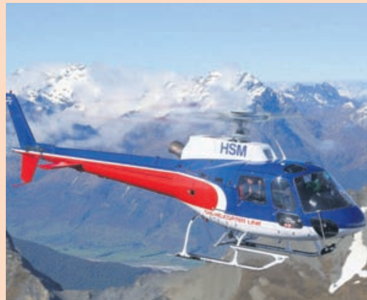
ÞYRLAN Airbus AS350 setti hæðarmet árið 2005 þegar henni var lent á toppi Everest-fjalls.

„Það eru ekki til nauðsynleg grunngögn til að setja slíkt tæki saman en við höfum hug á því að koma að slíku þróunarverkefni sem vonandi yrði að flughermi í okkar aðstöðu.“