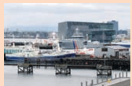
GAMLA HÖFNIN Faxaflóahafnir eru í eigu Reykjavíkurborgar, Akraneskaupstaðar, Hvalfjarðarsveitar og Borgarbyggðar.

„Þær breytingar sem við sjáum að eiga munu