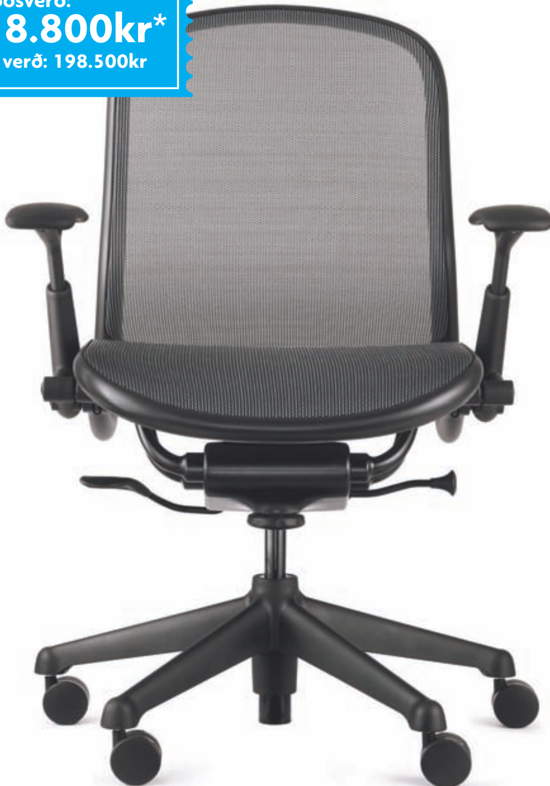
HÖNNUÐUR: DON CHADWICK

Tilboðsverð: 138.800kr* Fullt verð: 198.500kr