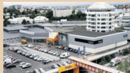
VERSLUNARMIDSTÖÐIN Skrifstofur fasteignafélagsins eru í Kringlunni.