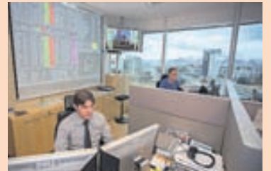
LÍTIL VELTA Í BYRJUN ÁRS Prjú ný félög hafa verið skráð í Kauphöllina á þessu ári.

Verð einstakra félaga hefur tekið töluverðum breytingum þrátt fyrir litla veltu á fyrri helmingi ársins.