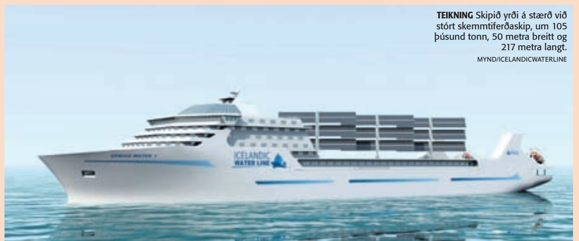
TEIKNING Skipið yrði á stærð við stórt skemmtiferðaskip, um 105 þúsund tonn, 50 metra breitt og 217 metra langt. MYND/ICELANDICWATERLINE