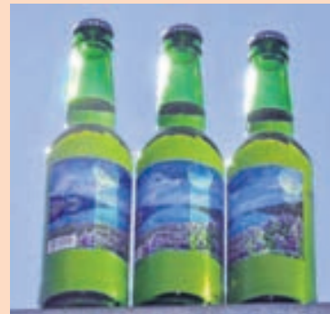
BJÓRINN Flöskurnar fá að prýða hillur ÁTVR í rúmar tvær vikur enn.

Alls eru rúmlega tvö þúsund flöskur af Sumarbjór Steðja til í birgðageymslu Vínbúðarinnar og hefði fyrirtækið þurft að farga þeim ef ekki hefði fundist farsæl lausn á málinu. Bjórinn verður hins vegar seldur fram til mánaðamóta í 22 af 48 vínbúðum landsins. - sój