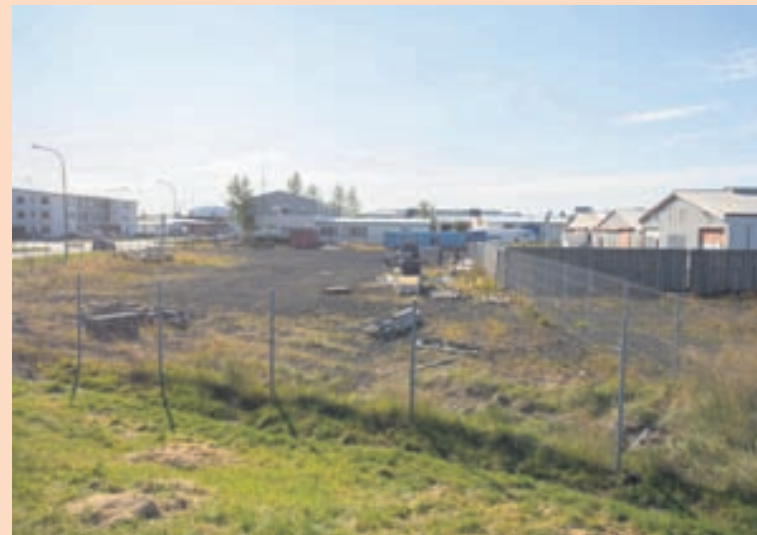
LÓÐIN Festi á lóðina á Flatahrauni 13 en þar er engin starfsemi í dag.

Festi, sem er í eigu SFV slhf., keypti Kaupás ehf. að fullu af Norvik hf. í febrúar síðastliðnum og tók þá við rekstri verslana Krónunnar, Nóatúns og Kjarvals. Jón segir áform fyrirtækisins í Hafnarfirði ekki merki um að nýir eigendur ætli í auknum mæli að færa verslanir Krónunnar í stærra húsnæði.