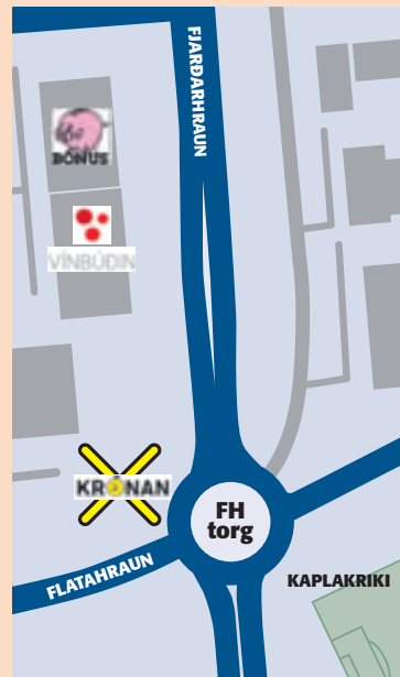
Ef af áformum Festar verður mun nýja verslunin standa rúmum 100 metrum frá næstu Bónusverslun.

„Við erum ekkert að setja áherslu á fermetrafjöldann og að vera með stórar verslanir. Það hentar á vissum stöðum við umferðaræðar og í útjaðri byggðar þar sem er meiri atvinnustarfsemi en íbúðir. En öll skipulagsmál vísa til þéttari byggðar og við rekum einnig búðir í þéttari byggð og ætlum að halda því áfram.“