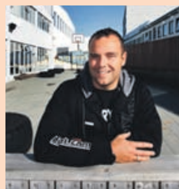
VINSÆLT Boot Camp fagnaði tíu ára afmæli síðastliðna helgi en hugmyndin hefur þróast mikið á undanföllum árum.

„Næstu skref eru í rauninni þau að við höfum sett okkur að gera vel það sem við erum að gera. Við viljum ekki vaða áfram, það er alltaf fullt sem maður getur gert betur.“