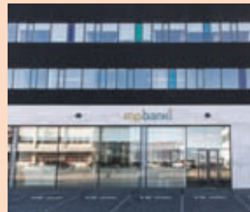
MP BANKI Fjölmíðlar greindu frá því í sumar að Straumur fjárfestingabanki og MP banki ættu í viðræðum um sameiningu.

Virðing hefur starfsleyfi sem verðbréfafyrirtæki. MP banki sérhæfir sig á sviði eignastýringar og fjárfestingabankastarfsemi ásamt því að bjóða sérhæfða bankþjónustu.