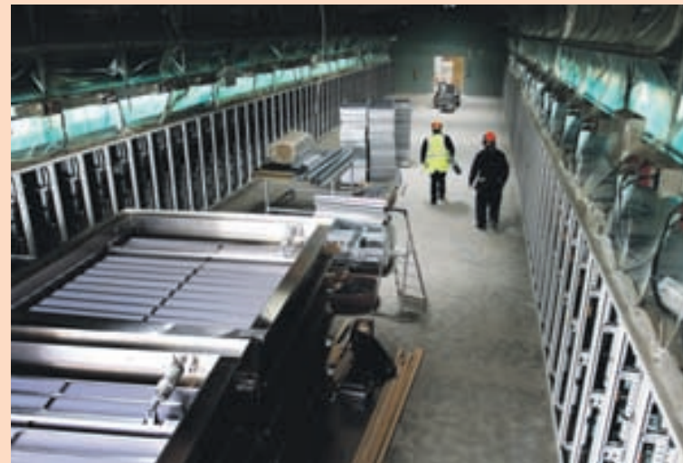
FRAMKVÆMDIRNAR Gagnaverið er reist á Fitjum í Reykjanesbæ en byggingu þess lauk í maí.

„Þegar ein mynt er notuð skapast pláss til að búa til nýja og það eru fleiri hundruð fyrirtæki í heiminum sem eru alltaf að búa til ný Bitcoin. Fyrirtækin fá þá hluta af nýslegnu myntinni í sinn hlut og því er mikil samkeppni um þetta. Þetta eru slík fyrirtæki sem eru inni hjá okkur og þau eru stanslaust að búa þetta til.“