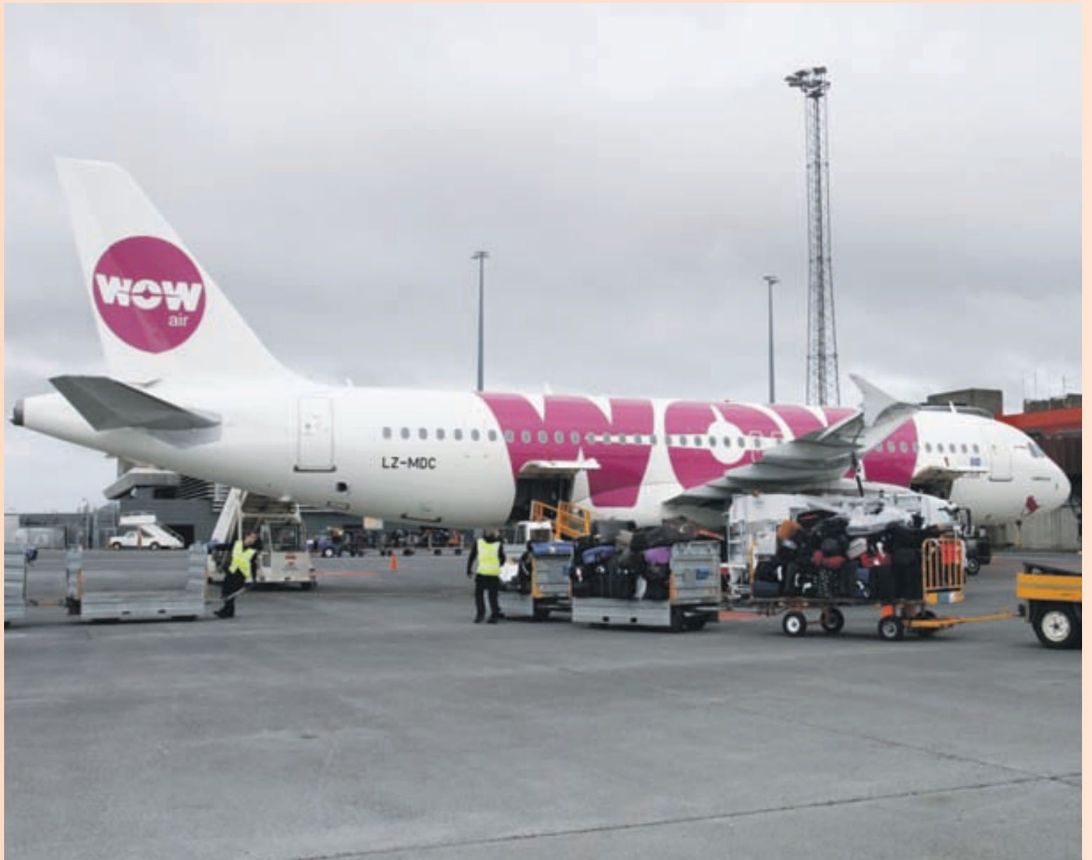
Á KEFLAVÍKURFLUGVELLI Vélar WOW eru af gerðinni Airbus A320 en þoturnar sem eiga að fara frá Íslandi til Bandaríkjanna eru af gerðinni A321.

„En ég held að við höfum á heildina litið verið mjög lánsöm í þessum mikla rekstri þar sem við förum úr núlli í tíu milljarða veltu. Þetta hefði aldrei tekist nema með frábæru fólki og góðum liðsanda.“