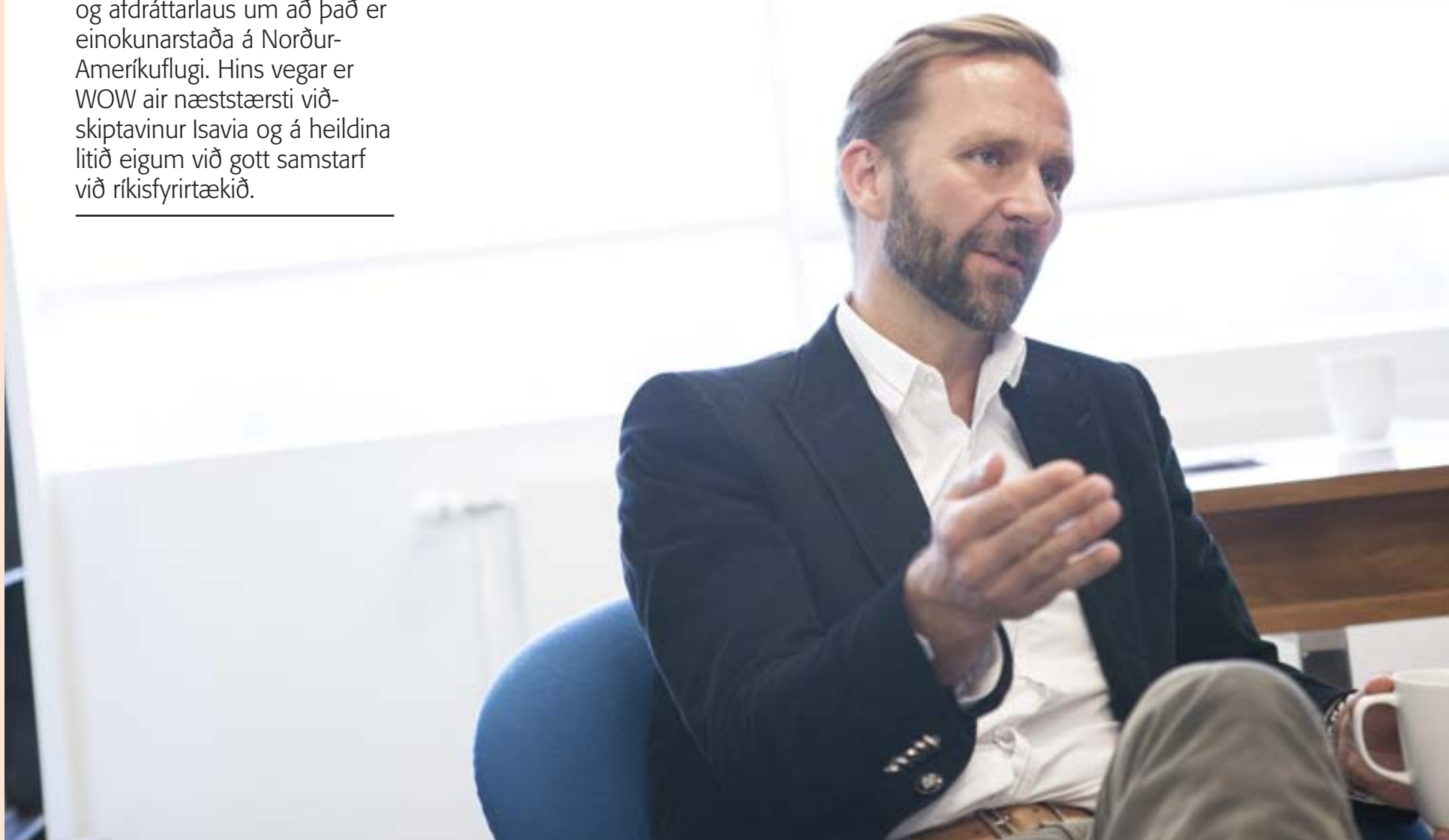
Á SKRIFSTOFUNNI Skúli hefur lagt til að byggð verði ný laggjaldaflugstöð á gamla varnarsvæðinu í Keflavík.

„Úrskurður Samkeppnis- eftirlitsins var mjög skýr og afdráttarlaus um að það er einokunarstaða á Norður- Ameríkuflugi. Hins vegar er WOW air næststærsti við- skiptavinur Isavia og á heildina litið eigum við gott samstarf við ríkisfyrirtækið.“