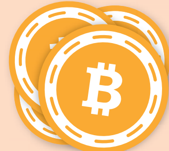
RAFMYNTIN Hver Bitcoin er nú metið á 55.335,69 krónur.

„Þeir sem eru að koma hingað vegna Bitcoin eru að sækjast eftir tiltölulega hagstæðu rafmagni. Hér er ekki hagstæðasta rafmagnið því menn geta fengið