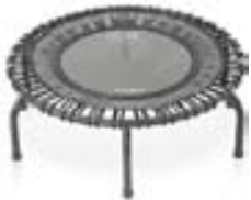
Jumpsport 220 44.995 kr.

Jumpsport trampólínin fara mun betur með líkama og liðamót heldur en hefðbundin gorma trampólín