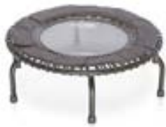
Jumpsport 250 49.995 kr.