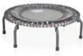
Jumpsport 350 Pro 69.995 kr.