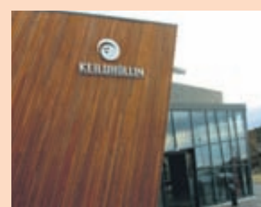
Í ÖSKJUHLÍÐ Starfsemi hefur verið rekin í Keiluhöllinni Öskjuhlíð frá árinu 1985.

Eignir félagsins nema tæplega 740 milljónum króna en skuldirnar nema tæplega 652 milljónum króna. Eigið fé er því um það bil 88 milljónir króna. Helstu eignir félagsins eru fasteignir sem eru bókfærðar á rúmar 549 milljónir króna, bifreiðar á ný milljónir króna og áhöld og