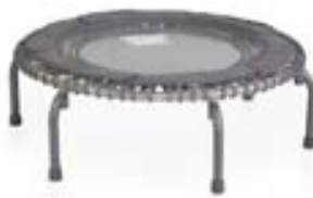
Jumpsport 370 Pro 79.995 kr.