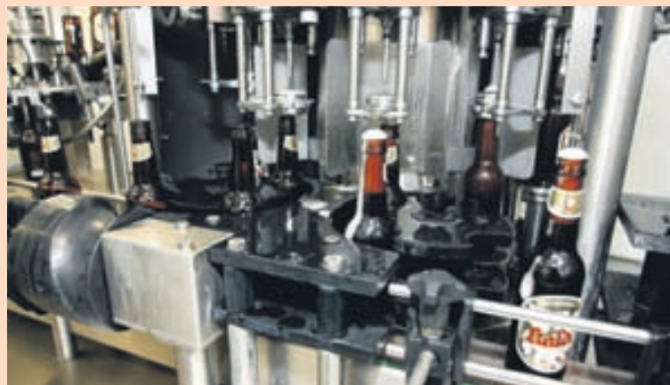
BJÓRINN Bruggsmiðjan hefur framleitt Kalda frá árinu 2006.

Bruggsmiðjan framleiðir nú um 550 þúsund lítra af bjórnum Kalda á ári. Framleiðslugetan eykst um 200 þúsund lítra með stækkuninni.