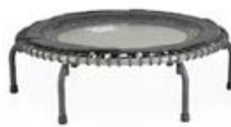
Jumpsport 570 Pro 89.995 kr.