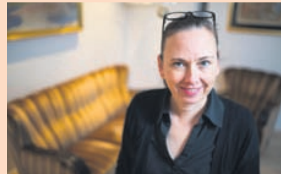
VERKFRÆÐINGUR Aðalstarf Yrsu eru ekki skapandi skrif heldur er hún afkastamikill verkfræðingur.