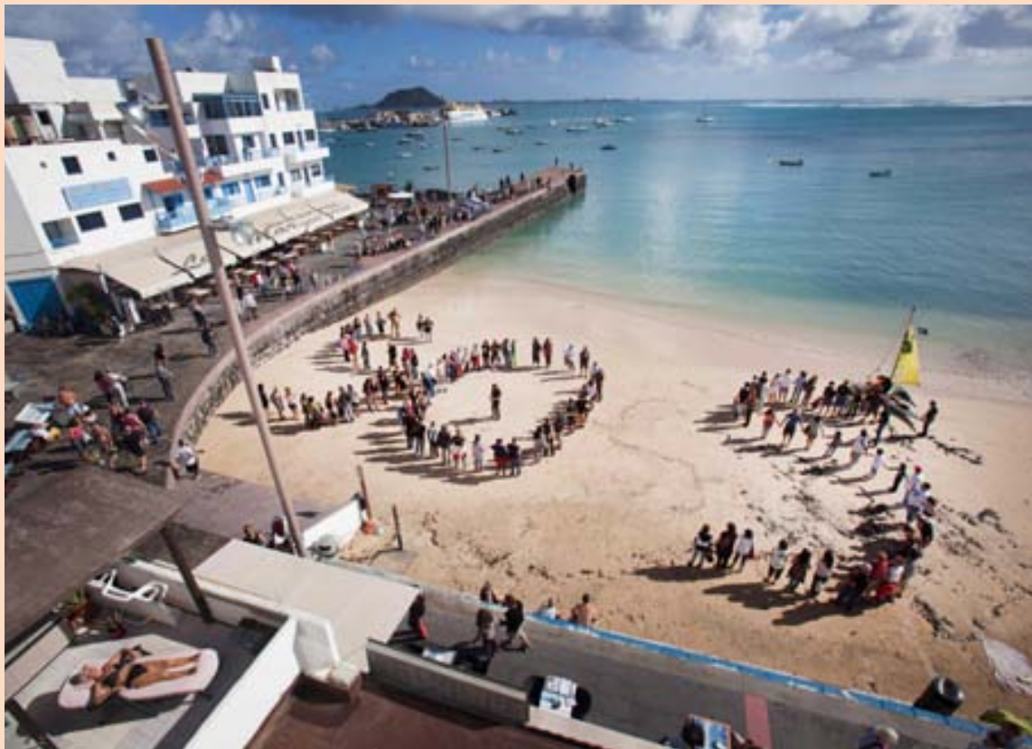
ÓSÁTTIR VIÐ OLÍUBORUN Spánverjar mótmæla harðlega olíuborun á Kanaríeyjum þessa dagana. Á meðal þess sem mótmælendur gerðu til þess að vekja athygli á sér var að birta ákall á hjálpu í sérstakri SOS-keðju. Strendur Kanaríeyja eru vinsæll ferðamanna-staður.