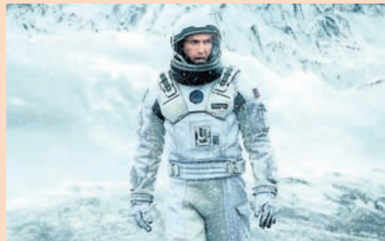
MATTHEW MCCONAUGHEY Leikstjórinn Christopher Nolan ákvað að taka upp myndina Interstellar hér á landi. Sagafilm aðstoðaði við tökurnar.