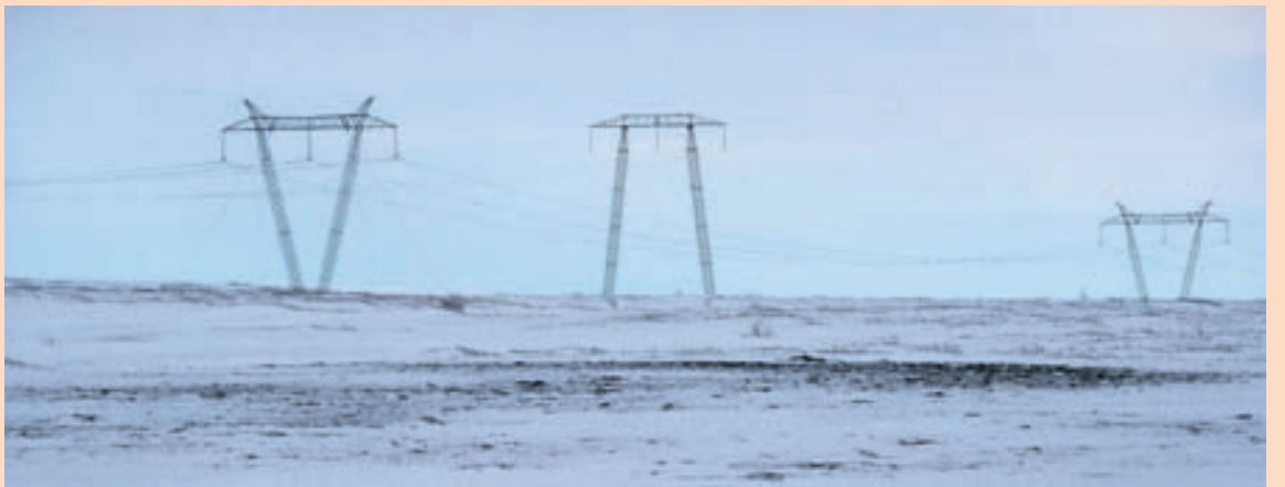
RAFLÍNUR Það tæki um þrjú ár að reisa háspennulínuna um Sprengisand. Reisa þyrfti vinnubúðir á hálendinu og verkið í heild myndi kostað um 12 milljarða króna.

Hin fjögur verkefni sem einnig er deilt um tengjast áformum Landsnets um nýja háspennulínu frá Hafnarfirði og út á Reykjanes, svokallaða Suðurnesjalínu 2, og einnig Blöndulínu 3, Kröfúlínu 3 og háspennulínu sem á að ná frá Kröflu til Akureyrar. Framkvæmdir við Suðurnesjalínuna hafa tafist og þá meðal annars vegna þess að ekki hefur fengist leyfi fyrir fram-