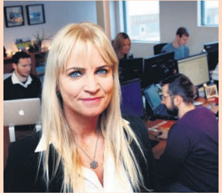
AZAZO Brynja er nú með um 50 manns í vinnu og hyggur á frekari landvinninga.

„Árið 2005 ákvað ég að segja upp hjá Skýrr en ég var þá að koma úr barneignafri og ætlaði þá að kaupa fyrirtæki og var búin að redda fjármögnun og allt. Það datt upp fyrir og eftir stutt stopp hjá Alfresca ákvað ég að stofna