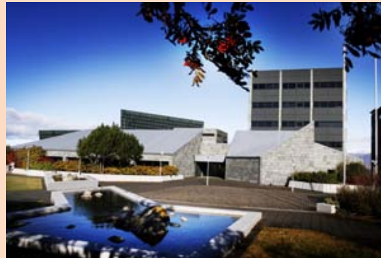
SEDLABANKINN Útboðin eru liður í losun gjaldeyrishafta.

„Unnið er að því að uppfæra áætlun um losun fjármagnshafta