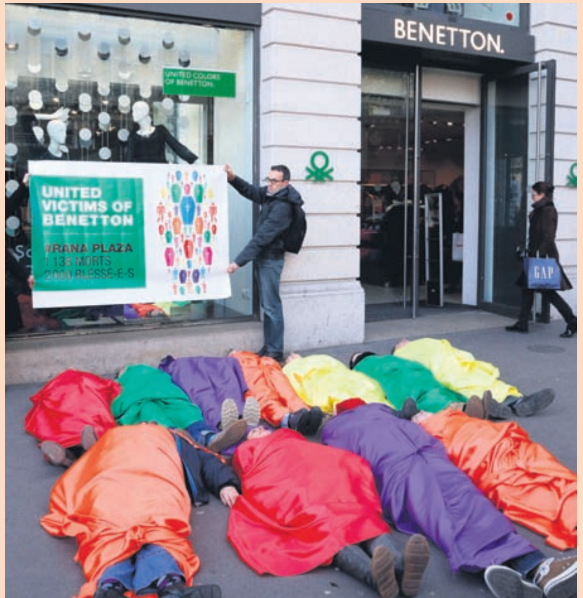
PRÝST Á AÐGERDIR Aðgerðasinnar úr hópnum „Peuples Solidaires“ eða Samstaða þjóðar og „Ethique Sur l'étiquette“ eða Siðferði merkinga mótmæltu í gær fyrir utan fataverslunina Benetton við Óperuhúsið í París. Verið var að mótmæla því að tuttugu mánuðum eftir hrun verksmiðju þar sem Benetton meðal annars framleiddi vörur sínar og yfir 1.100 manns létu lífið hafi ekki verið samið við fjölskyldur hinna látna um bætur.