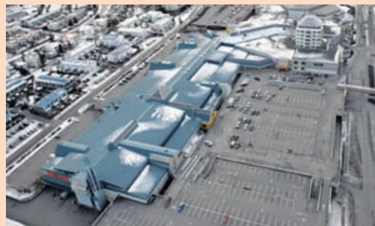
KRINGLAN Fasteignafélagið á um 130 eignir.

„Við ætlum að vera þekkt fyrir það að vera með stöðugan rekstur, og stöðuga arðsemi og við munum klárlega fara í þessi þróunarverkefni. Aðalatriðið er þó að sýna nýjum eigendum félagsins að fjárfestingu þeirra sé vel borgið.“