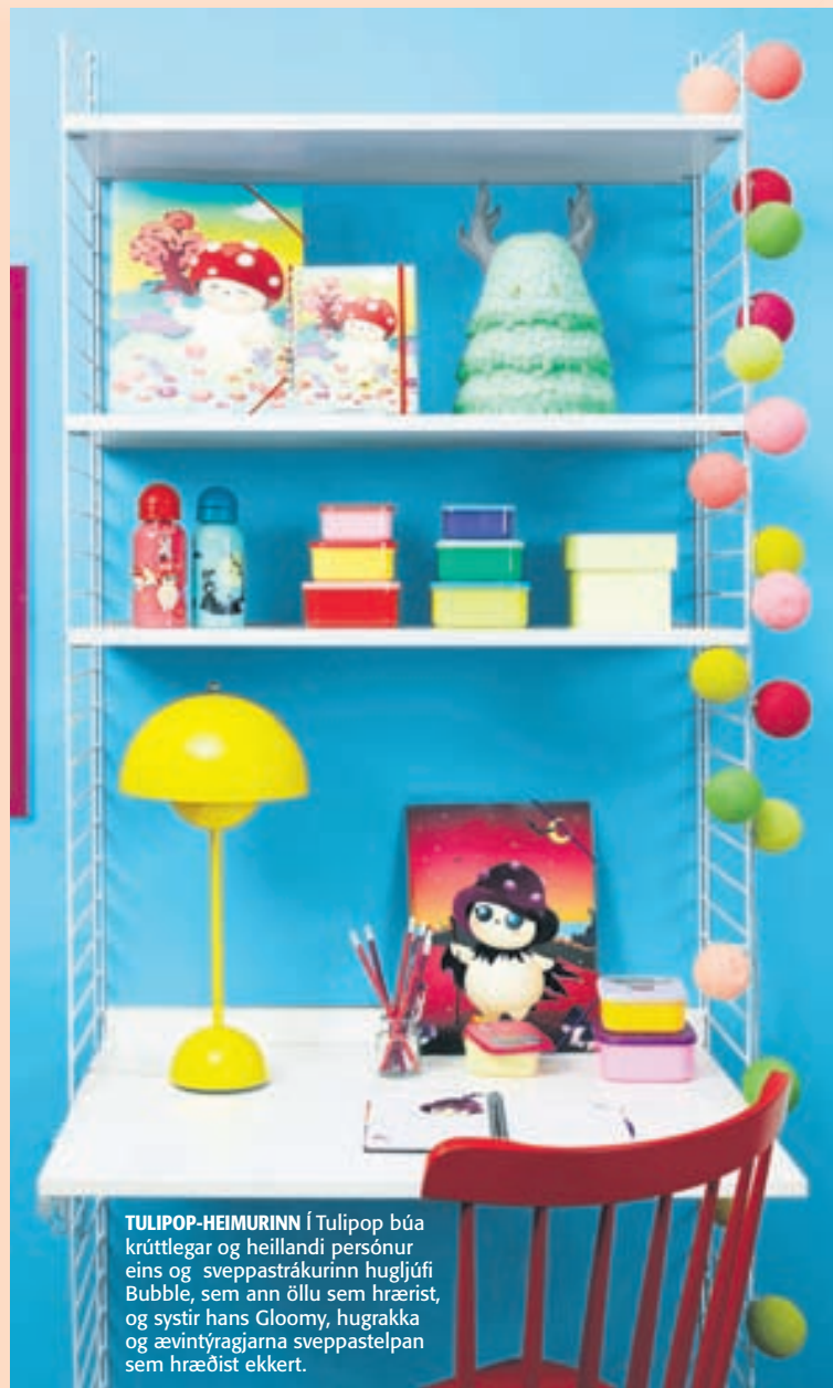
TULIPOP-HEIMURINN í Tulipop búa krúttlegar og heillandi persónur eins og sveppastrákurinn hugljúfi Bubble, sem ann öllu sem hrærist, og systir hans Gloomy, hugrakka og ævintýragjarna sveppastelpan sem hræðist ekkert.