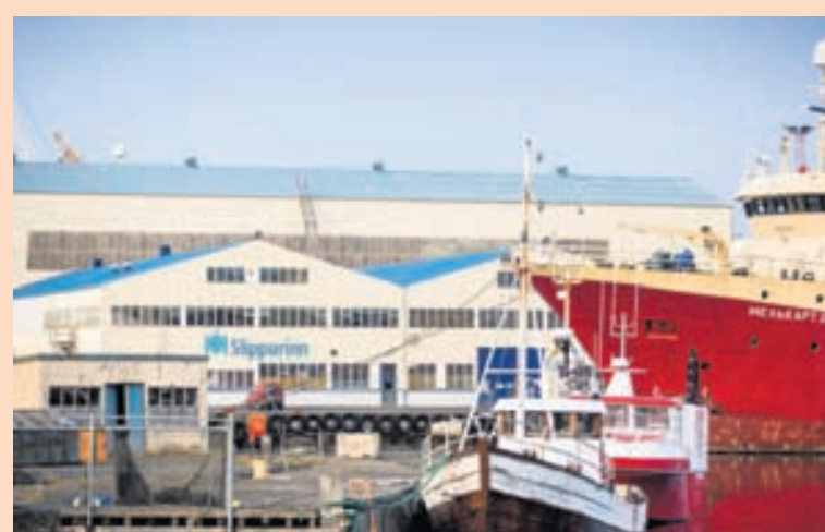
SLIPPURINN Samherji er nú meirihlutaeigandi í stærsta skipasmíðafyrirtæki landsins.