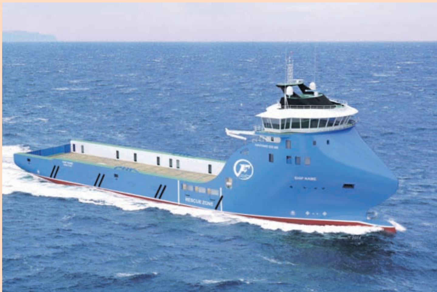
SKIPIÐ Polarsysel er dýrasta skip Íslandssögunnar og er sérútbúið til að þjónusta olíuönduðinn.

Fáfni gerði í fyrra tíu ára samning við norska ríkið um að sinna gæslustörfum á Svalbarða sem er sagður metinn á um sex milljarða króna. Fyrirtækið hefur einnig keypt annað og stærra skip, sem nú er í smíðum, og gerði í haust samning við Gazprom um að þjónusta olíuborpall rússneska stórfyrirtækisins í Pechora-hafi við norðvesturhluta Rússlands.