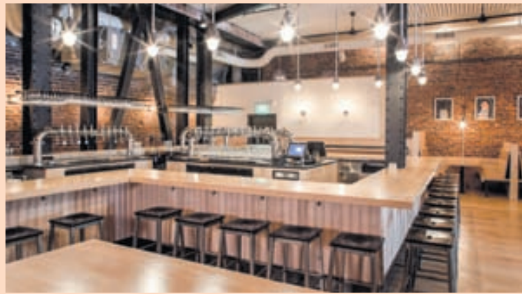
VESTANHAFS Mikkeller opnaði bar í San Francisco í júlí 2013 og nokkrum mánuðum síðar í Bangkok í Taílandi. MYND/MIKKELLER

ingu árlegrar Bjórhátíðar Kex Hostels en starfsmenn Mikkeller hafa tekið þátt í hátíðinni síðustu tvö ár og kynnt vörur fyrirtækisins.