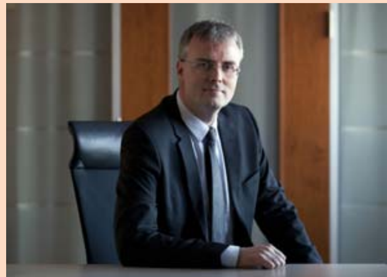
FORSTJÓRINN Viðar segir að kaupin séu í takti við stefnu Valitors varðandi uppbyggingu á mörkuðum á Norðurlöndum og í Bretlandi.

Valitor aukið vöruframboð sitt. „Við erum að bæta við vöruframboði sem við höfum ekki í dag en þeir eru með. En það passar mjög vel saman og þá sér í lagi í netviðskiptum,“ segir hann.