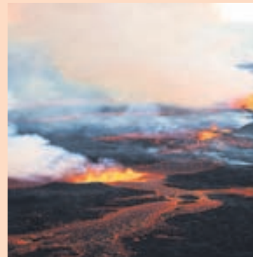
ELDGIOS Ferðabjónustan Saga flýgur yfir Holuhraun.

Að hans mati er hægt að gera betur í greininni á Norðurlandi ef önnur gátt opnast fyrir millilandaflug til landsins. „Það væri gríðarleg lyftistöng fyrir ferðahjónustuna á Norðurlandi ef hægt væri að koma á reglulegu millilandaflugi um aðra gátt en Keflavík. Það myndi einnig dreifa ferðamönnum betur um landið.“ -sa