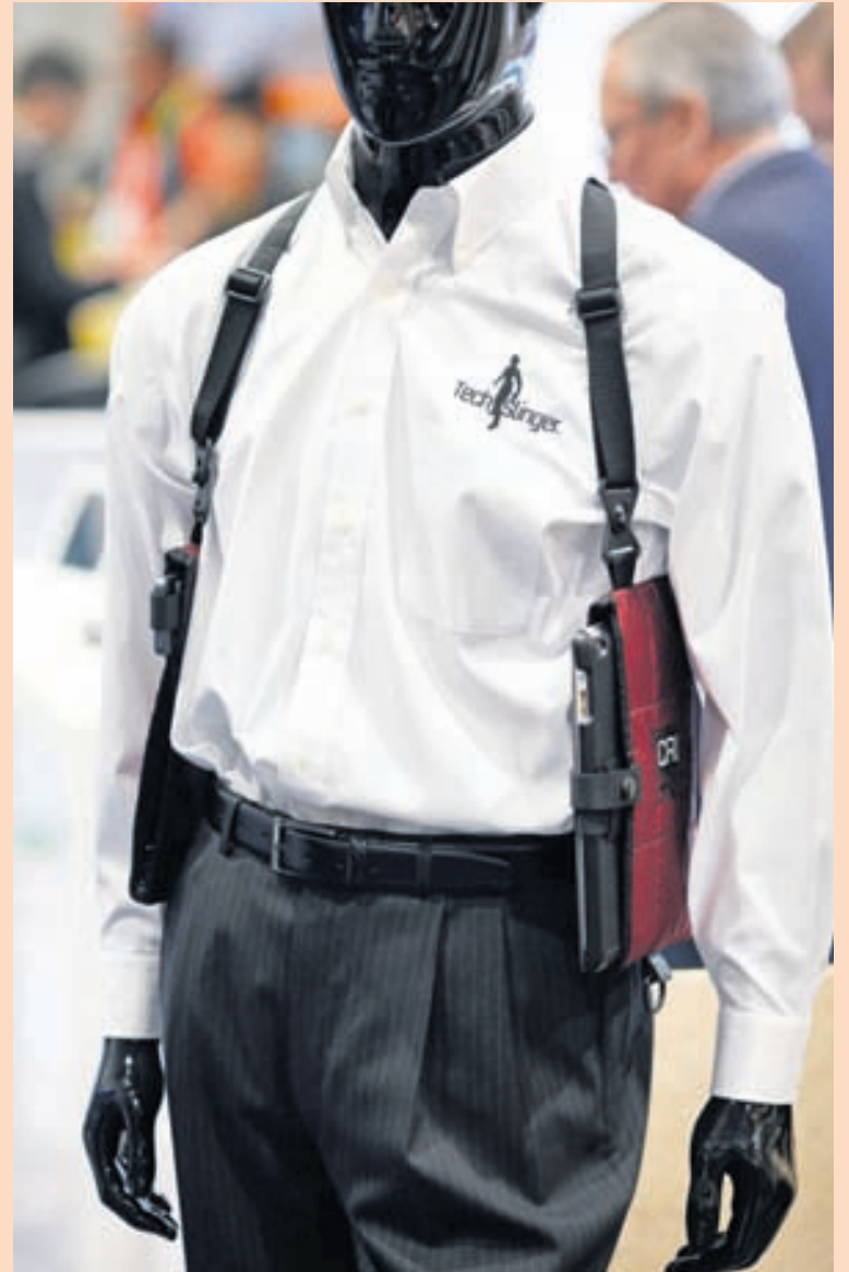
TÖLVUHULSTUR Einhvern gæti kitlað að bera snjalltækin sín í sérstöku hulstri innanklæða (svipað byssuhulstri hasarmyndanna). Slíkan búnaður var að finna á sýningarbás Tech Slinger á CES 2015. Fyrirtækið sendi líka nýverið frá sér belti sem hengja má spjaldtölvur í og gæti hentað þjónum sem þannig taka niður pantanir.