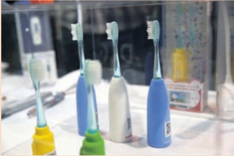
SMART RAINBOW-TANNBURSTINN Tannburstar þessir eru dæmi um „internet hlutanna“ en þeir senda í snjallsíma fólks upplýsingar um tannhirðu og bjóða upp á gagnvirka leiki tengda tannburstinum.

Dæmi um slíkt tæki sem kynnt var á sýningunni er kaffivél Smart-er (sem reyndar þarf að bæta í kaffibaunum og vatni með gamla laginu) sem miðar styrk morgunbollans við ástand eigandans. Gögn úr æfingarmyndunum láta vélinu sumás vita ef eigandinn hefur sofði illa um nóttina og þá er fyrsti bolli dagsins hafður sérstaklega sterkur.