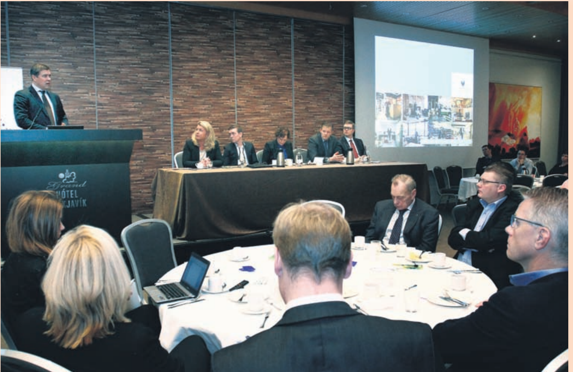
VILL HALDA ÁFRAM Bjarni Benediktsson, fjármála- og efnahagsráðherra, segir að breytingar á skattaumhverfinu séu á meðal forgangsverkefna hjá ráðuneyti sínu. Bjarni var á meðal frummælenda á skattadegi Deloitte.