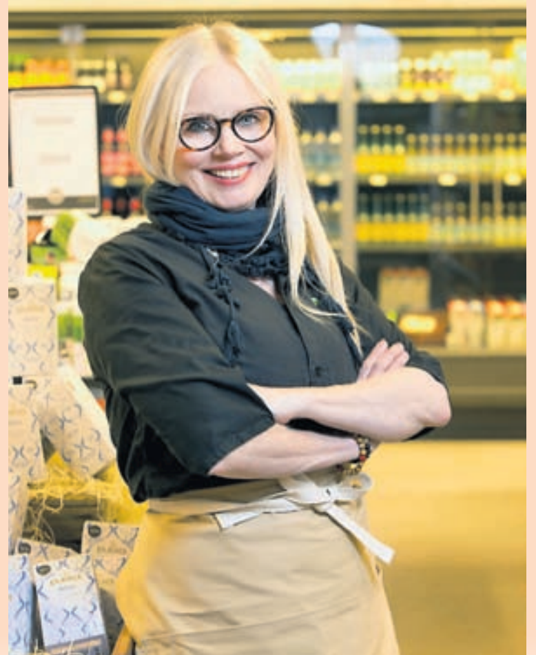
MATGÆDINGUR Helstu áhugamál Solla á Gló tengjast vinnunni í gegnum mat.