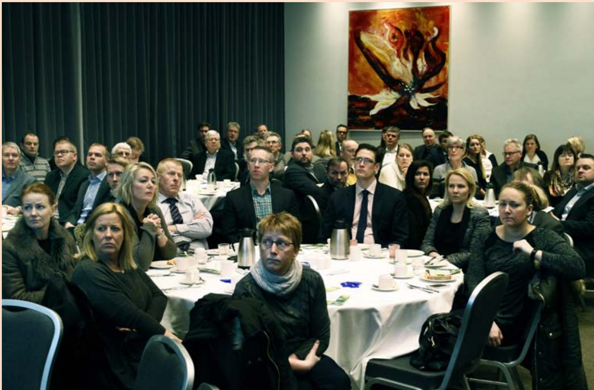
SKATTGREIÐENDUR Meira en 200 manns viðsvegar að úr atvinnulífinu voru mætt á Grand Hótel í gær til þess að hlusta á frummælendur skiptast á skoðunum um skattamál.