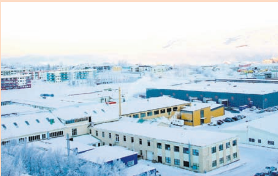
GLERÁRTORG Miklar endurbætur eru boðaðar á húsnæði Glerártorgs.