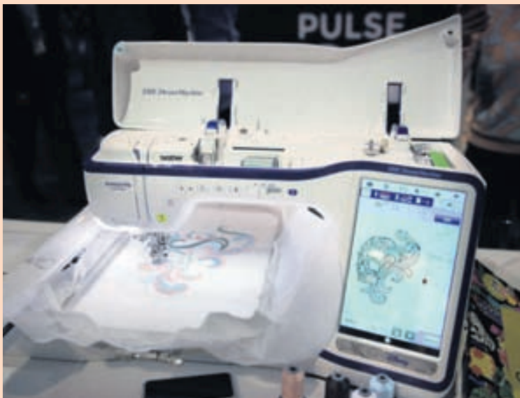
HÁTÆKNISAUMASKAPUR Myndavélar eru ekki einskorðaðar við snjallsíma. Hér getur á að líta saumavél frá Brother sem búið er einni slíkri og skanna að auki. Hægt er að skanna eða mynda munstur og vinna svo með þau á skjá saumavélarinnar. Vélin saumar svo mynstrið þegar það er til reiðu. (Ekki borgar sig þó að bregða sér langt frá því skipta þarf handvirkt um litapræði eftir því hvernig verkinu vindur fram.)