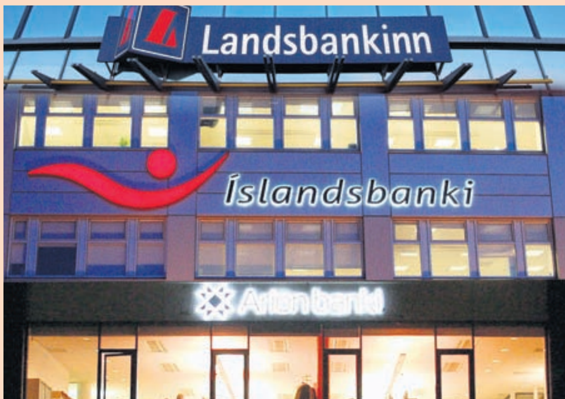
BANKARNIR Fyrstu umræðu um frumvarp um breytingar á lögum um fjármálafyrirtæki er lokið. Frumvarpið er núna í nefnd. Ákvæði í frumvarpinu sem lúta að breytilegum starfskjörum taka mið af evrópsku regluverki.