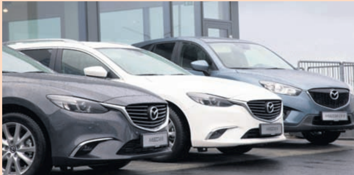
BÍLASALA Ársreikningur Brimborgar bendir til þess að bílasala hafi tekið vel við sér í fyrra.