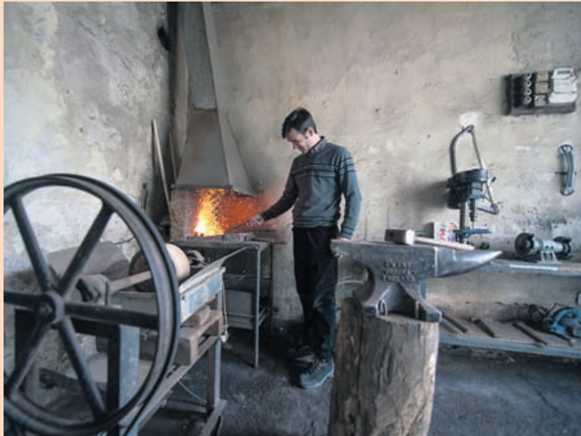
Í SÁRRI FÁTÆKT Kosovo er fátækasta héraðið í suðausturhluta Evrópu. Um það bil 40-45 prósent af vinnuaflinu eru án atvinnu, samkvæmt tölum Alþjóðabankans. Kosovo-Albaninn á meðfylgjandi mynd var á mánudaginn í óðaönn að smíða landbúnaðarverkfæri í bænum Pristina.