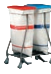
Hammerlit • Tauflokkunarkerfi