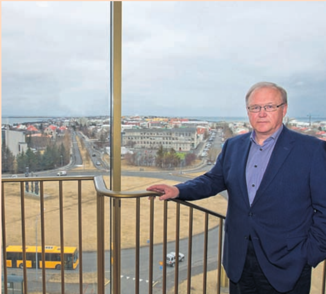
Á ÍSLANDI Göran Persson var gestur á Ársfundi atvinnulífsins sem haldinn var í Hörpu.

„Það er verkefni aðila vinnu- markaðarins að leysa þessi mál. Þessir aðilar eiga alveg að geta