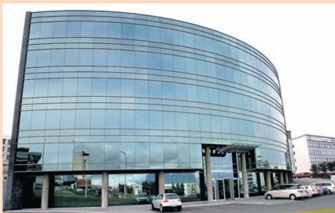
KAUPHÖLL ÍSLANDS Félög í Kauphöllinni koma almennt vel út hvað varðar gegnsæi.