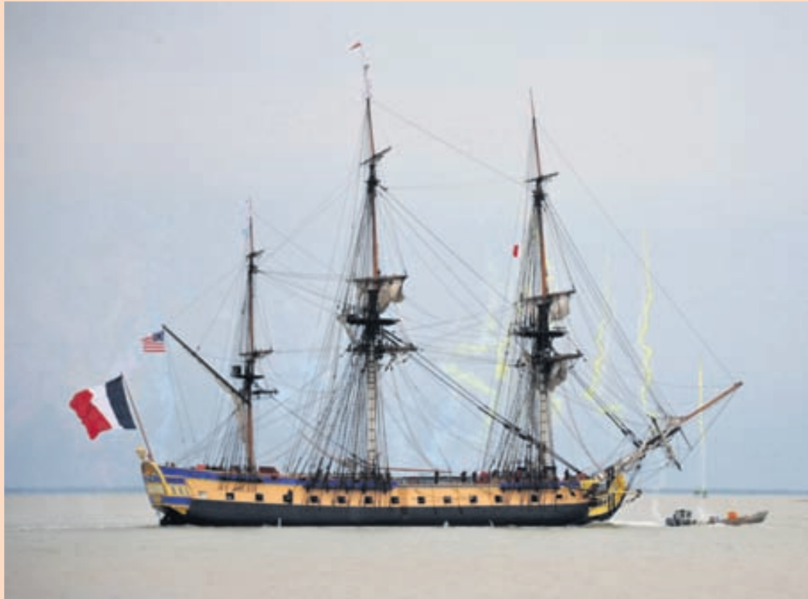
L'HERMIONE Ljósmyndarar náðu þessari mynd af endurgerð frönsku freigátunnar um helgina. Upprunalega freigátan var í lyk- hlutverki í sjálfstæðisbaráttu Bandaríkjamanna fyrir um 235 árum. Hugmyndin að smíði eftirlíkingarinnar kom fyrst fram fyrir 20 árum.