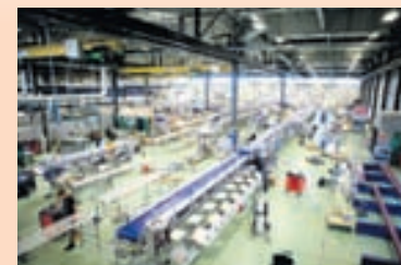
MAREL Í GARDABÆ Stjórnarformaður fyrirtækisins fær mest greitt allra stjórnarmanna.