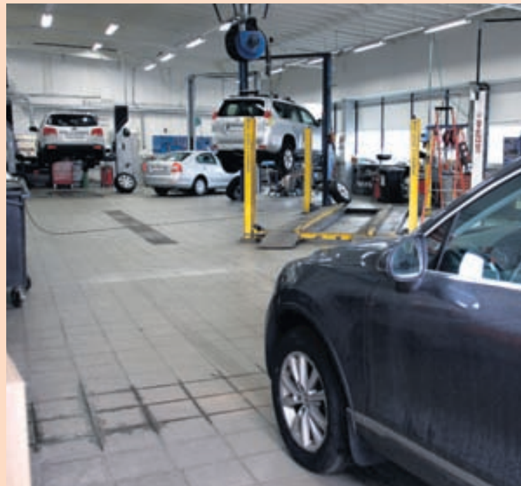
BÍLAVIDGERÐIR Stór hluti af kostnaði bílaleiganna er í viðhaldi, kaupum á dekkjum og öðru sem viðkemur rekstri hefðbundinna bíla.