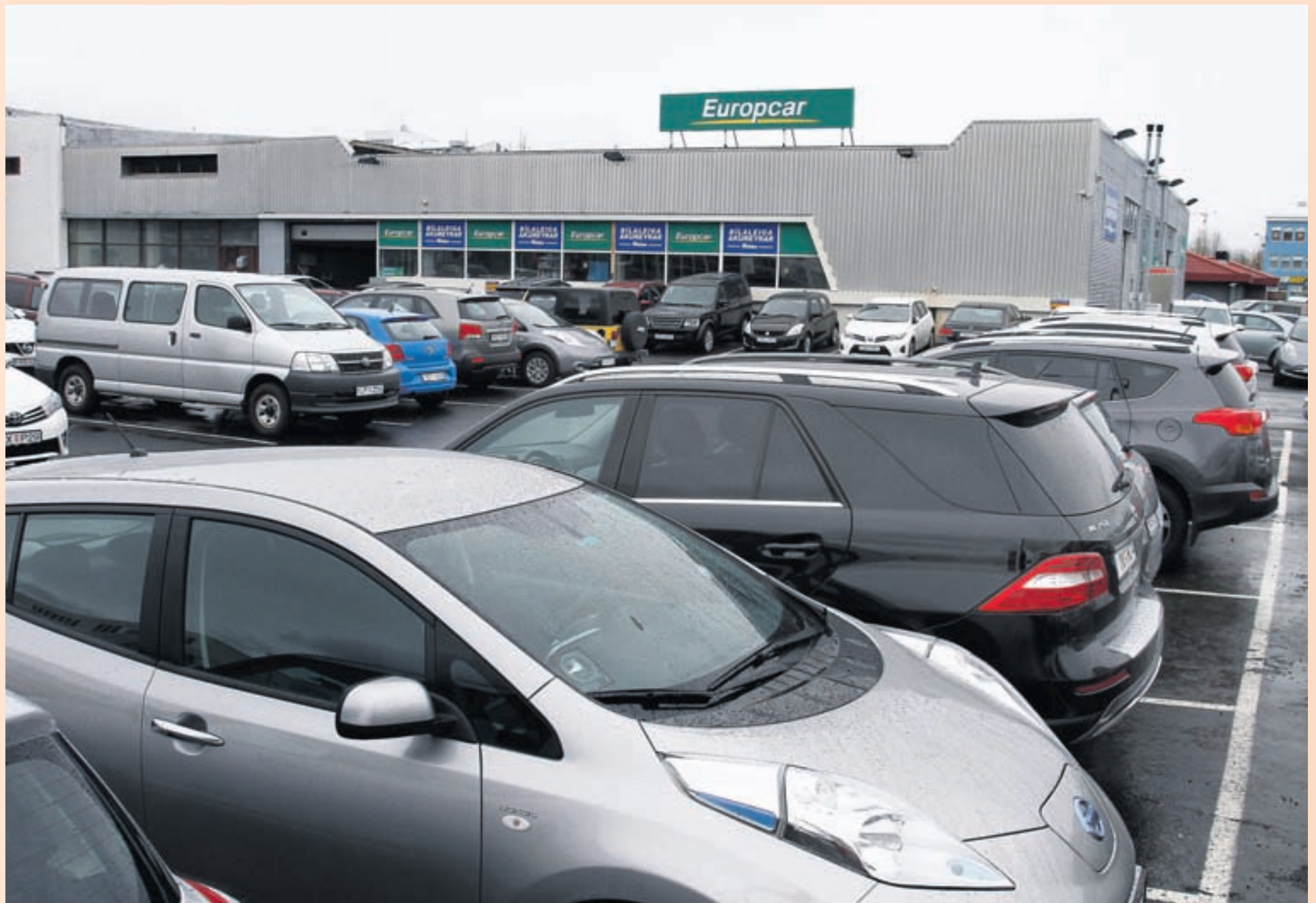
STÆRSTA BÍLALEIGAN Samkvæmt skoðanakönnun sem unnin var á vegum Ferðamálastofu nota 36 prósent ferðamanna sem koma til Íslands bílaleigubíla.