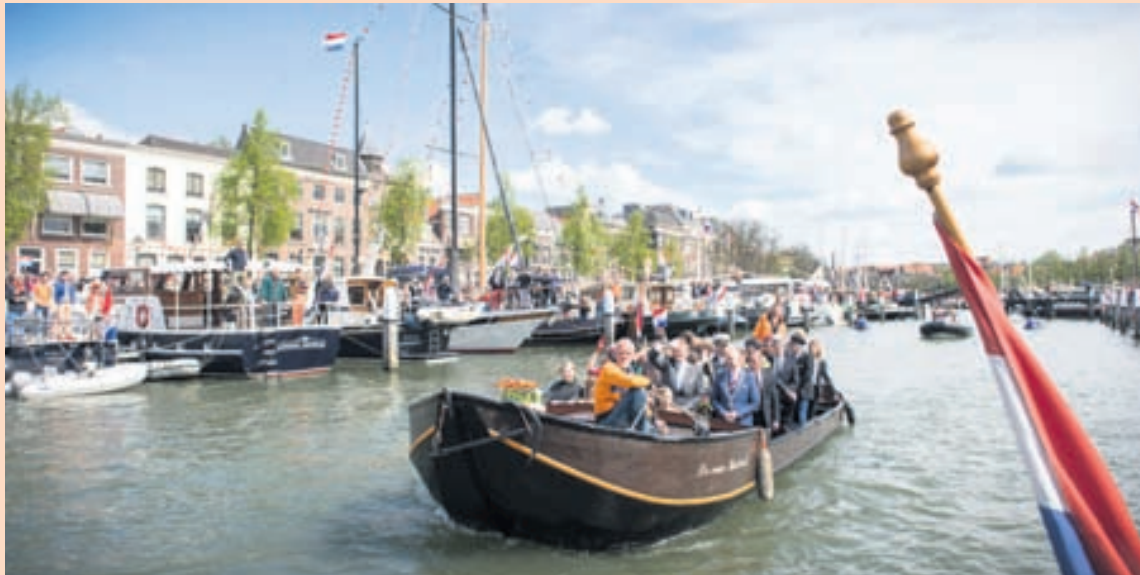
FÖGNUM KÓNINGNUM Það voru margir sem fengu sér far með bátum í borginni Dordrecht í Hollandi á Konunglega deginum á mánudaginn. Þann dag fögnuðu Hollendingar afmæli konungsins Vilhjálms Alexanders í Dordrecht. Konungurinn er fæddur 27. apríl 1967 og er því 48 ára gamall. Hann hefur verið konungur frá 30. apríl 2013.