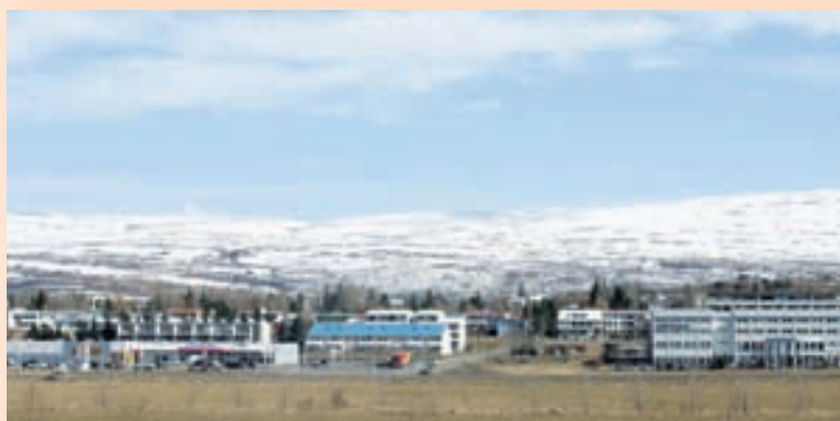
VERKFALL Í VÆNDUM Hótel Hérað á Egilsstöðum er eitt þeirra hótela sem Icelandair rekur.

Icelandair hafa ekki fengið afbókanir þrátt fyrir yfirvofandi verkföll: