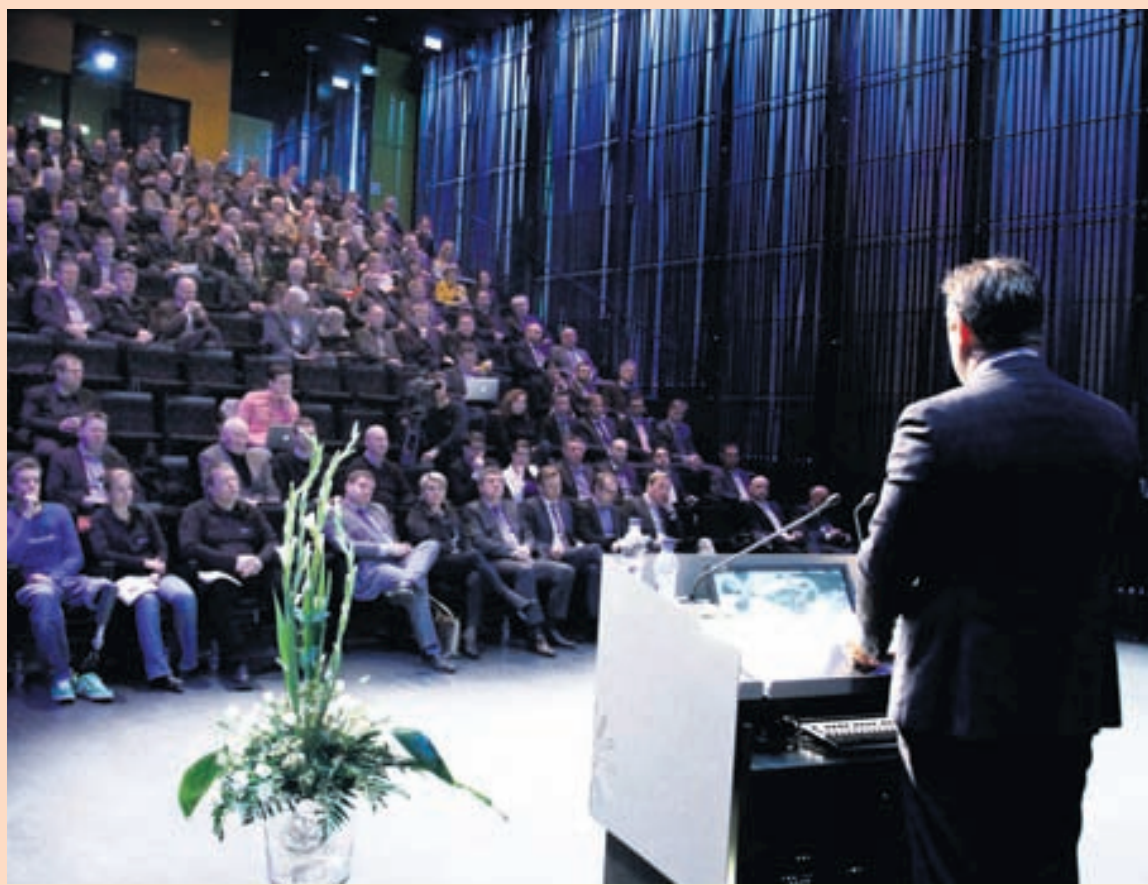
ÁRSFUNDUR Bjarni Benediktsson fjármálaráðherra sagði á ársfundi Samáls að afnám raforkuskattsins væri hluti af þeim efnahagslega stöðugleika sem stjórnvöld vildu skapa.

Stjórnendur hótélanna telja aftur á móti að ef samningaviðræður dragast á langinn sé fullvíst að þau verkföll sem boðuð eru síðar í maí muni skerða verulega starfsemi hótélanna, enda háðinn að hefjast. -jhh