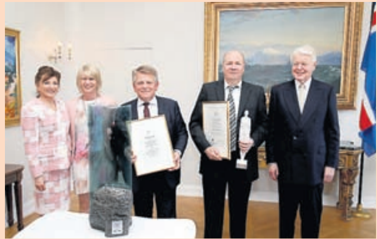
HEIÐRADUR Arnaldur Indriðason tók við verðlaunum á Bessastöðum á föstudaginn. Ícelandair Group fékk sjálf útflutningsverðlaunin.

Arnaldur sagðist taka við verðlaunum fyrir hönd íslenskra bókmennta. Hann sagðist telja að íslenskar bókmenntir væru langflottasta útflutningsgreinin og hefðu verið það lengi. „Þetta er vonandi hvatning fyrir mig og aðra höfunda, að halda áfram á sömu braut,“ sagði hann. Íslenskar bókmenntir hafa sannarlega notið vaxandi vinsælda erlendis upp á síðkastið. Til marks um það var Snjóblindur eftir rithöfundinn Ragnar Jónasson mest seldu bókina á Kindle hjá Amazon í Bretlandi um síðustu helgi. Hún trónaði á toppi metsöluhlustans í tvo sólarhringa. Aðspurður hvort hans eigin velgengi hafi haft áhrif á brautargengi annarra höfunda segir Arnaldur: „Það má vel vera að