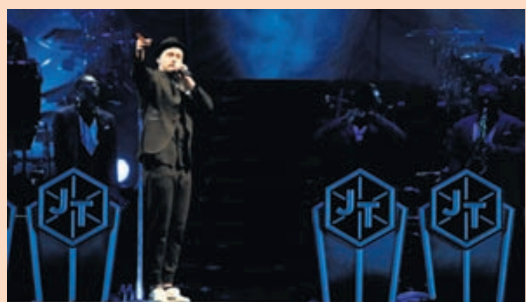
KÓRINN Nær tuttugu þúsund manns voru viðstaddir tónleika Justins Timberlake í Kórnum á síðasta ári.

Eignir Senu nema 1,1 milljarði króna og eigið fé 549 milljónum