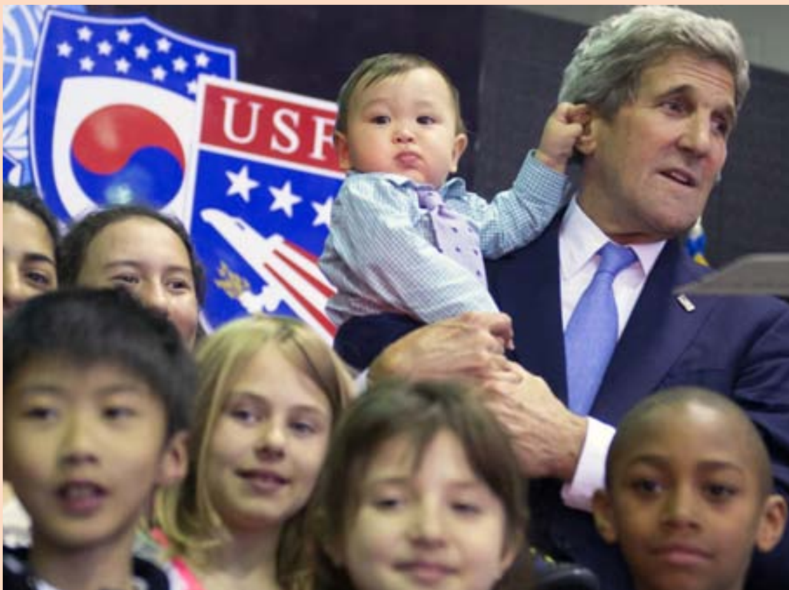
Í HEIMSÓKN John Kerry, utanríkisráðherra Bandaríkjanna, er í heimsókn í Suður-Kóreu. Hann segir að sífellt hræðilegri fréttir berist af aftökum norðurkóreskra embættismanna. Hann segir að Kim Jong-Un, leiðtoga Norður-Kóreu, skorti alla virðingu fyrir mannréttindum og að hann gæti á endanum þurft að svara til saka fyrir Alþjóðaglaðpómstólnum.