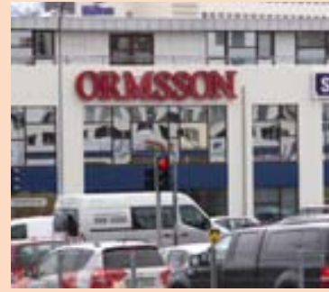
ORMSSON Ormsson rekur fimm verslanir á Íslandi, þar af eina í Lágumla.