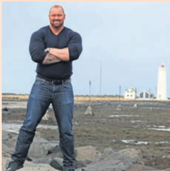
Fjallið Hafþór Júlíus Björnsson hefur tekið þátt í keppninni um sterkasta mann heims með mjög góðum árangri.