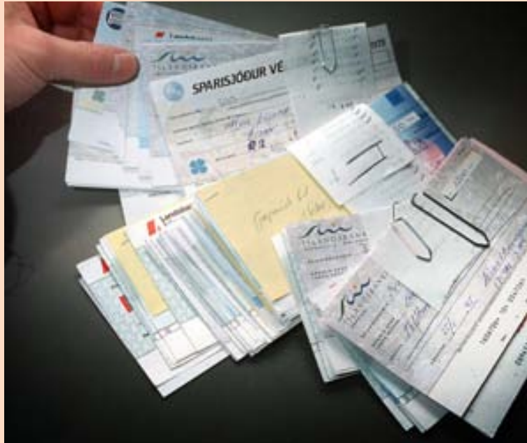
ÁVÍSANIR Þeim hefur fækkað snarlega sem nota ávísanir frá degi til dags.

Landsbankinn segir að erlendir tékkar verði teknir til innheimtu líkt og verið hefur, en þeir teljst nánast á fingrum annarrar handar núorðið og yfirleitt sé um mjög sérstök tilvik að ræða. „Ávísanir eru einfaldlega leifar af gömlum tíma sem er á undanhaldi eða nán-