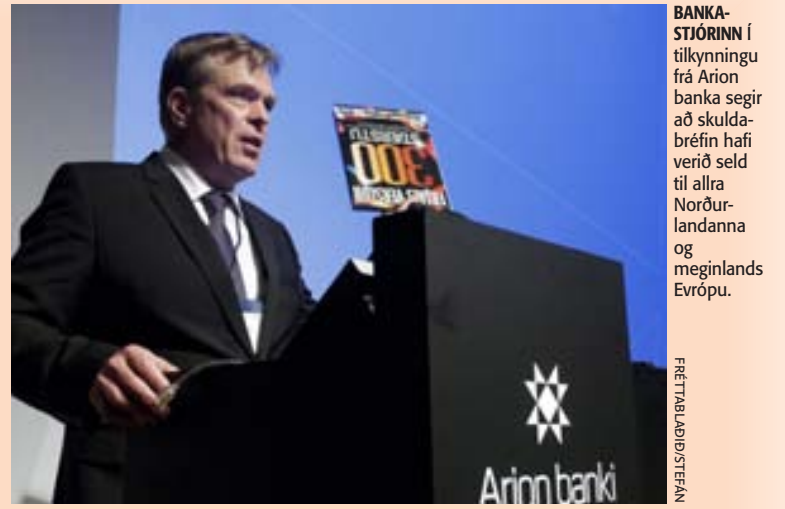
BANKASTJÓRINN í tilkynningu frá Arion banka segir að skuldabréfin hafi verið seld til allra Norðurlandanna og meginlands Evrópu.

Ávísanir eru einfaldlega leifar af gömlum tíma.