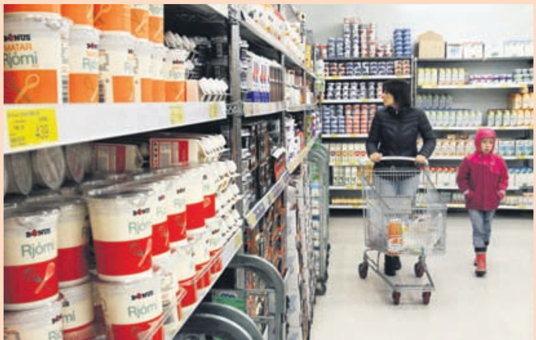
Í BÓNUS Hagar reka 29 Bónusverslanir. Þar af eru 19 á höfuðborgarsvæðinu.