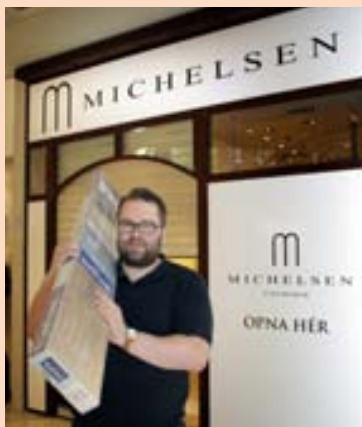
VERSUNIN STANDSETT Verið var að festa ljós og setja upp skilti í Kringlunni fyrir helgi.

Verslunin Michelsen úrsmiðir var stofnuð á Sauðárkróki 1909. Á árunum 1943-1946 voru reknar