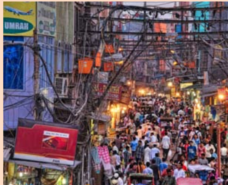
Í DELÍ Um 1,2 milljarðar manna búa í Indlandi. Þar er mikil fátækt en um 400 milljónir manna eru í millistætt eða efri stéttum.

Þórir segir að indversk stjórnvöld leggi nú mikla áherslu á að laða að fjárfestingu og vilji byggja upp iðnað í landinu. Nútímavæða borgir og gera þær hátæknivæddar. Endurbýggja orkukerfið hjá sér og auka nýtingu á endurnýjanlegum orku-gjöfum.