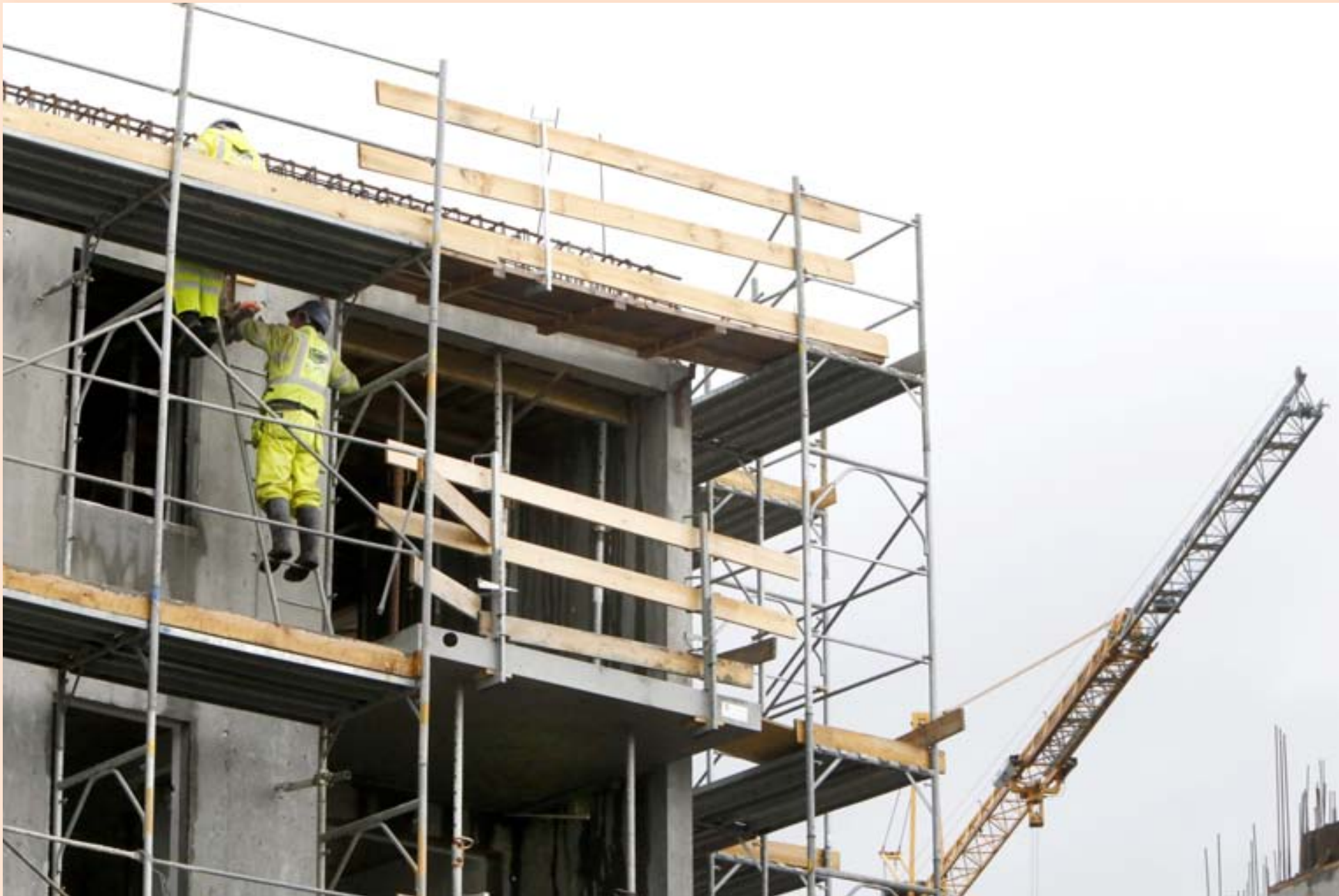
NÝBYGGINGAR Það gætti fremur neikvæðs viðhorfs á meðal þátttakenda STEFNUMóts til samningaumhverfisins og útboðsmála sem eru ríkjandi í íslenskum byggingariðnaði. Gagnrýnt var að í opinberum útboðum væri öðru fremur horft á fjárhagslega þætti þó ljóst væri að besta tilboðið væri ekki alltaf það lægsta.