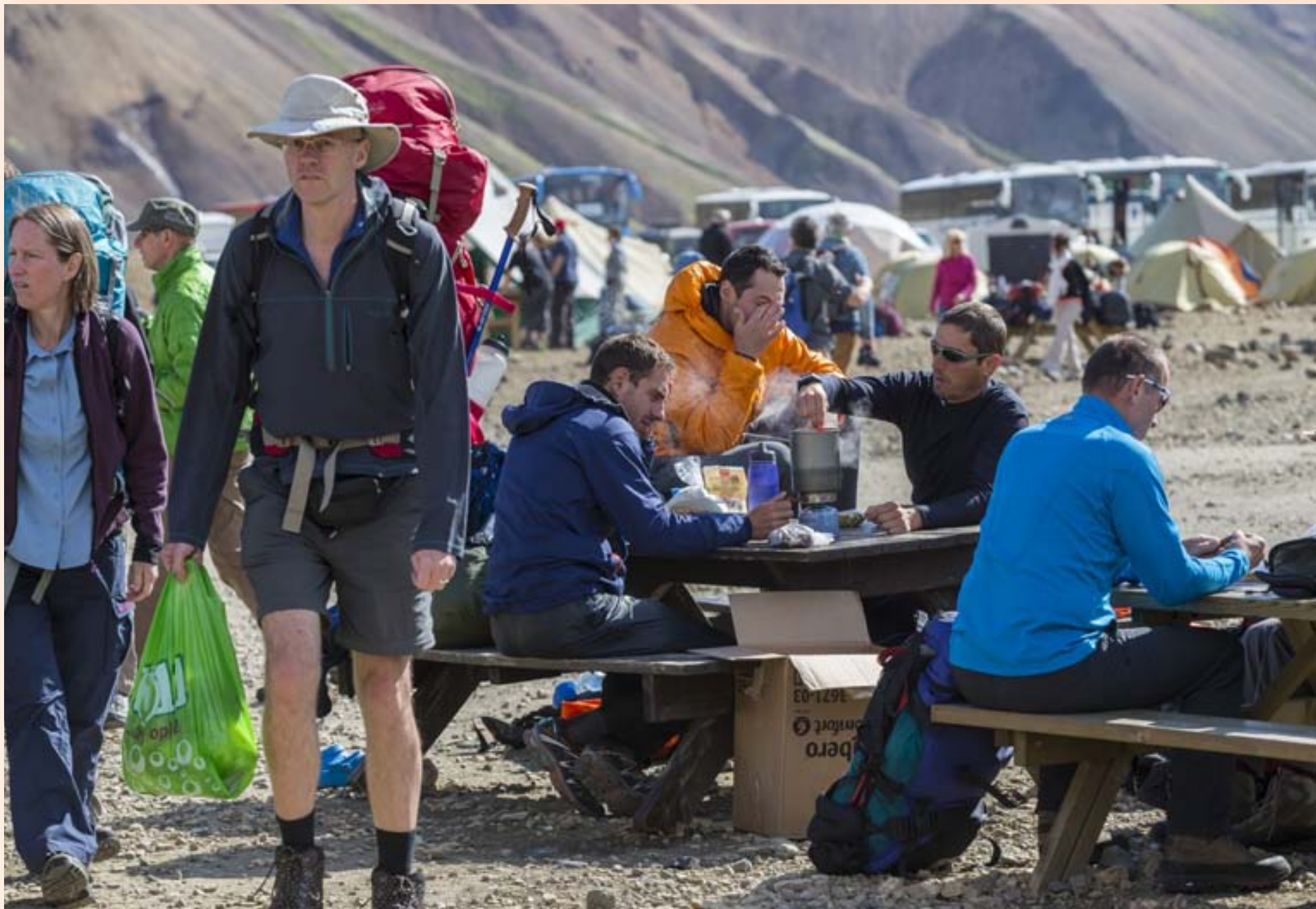
LANDIÐ SKOÐAÐ Uppgangur ferðþjónustu hefur verið í veldisskrefum eða því sem næst undanfarin ár. Umsófn hafa verið sem vítamínsprautu í efnahagslífi eftir hrún, en hluti ágóðans virðist þó hverfa í vasa þeirra sem stunda svarta atvinnustarfsemi.