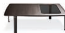
Perry sófaborð / Minotti