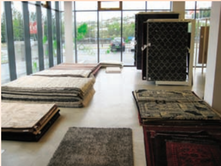
NÝR STADUR Teppa- og mottuverslunin Persía er rekin sem sérdeild inni í Parka í Kópavogi.

Teppaverslun flytur í Kópavog eftir eigendaskipti í vor: