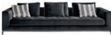
Anderson Quilt / Minotti