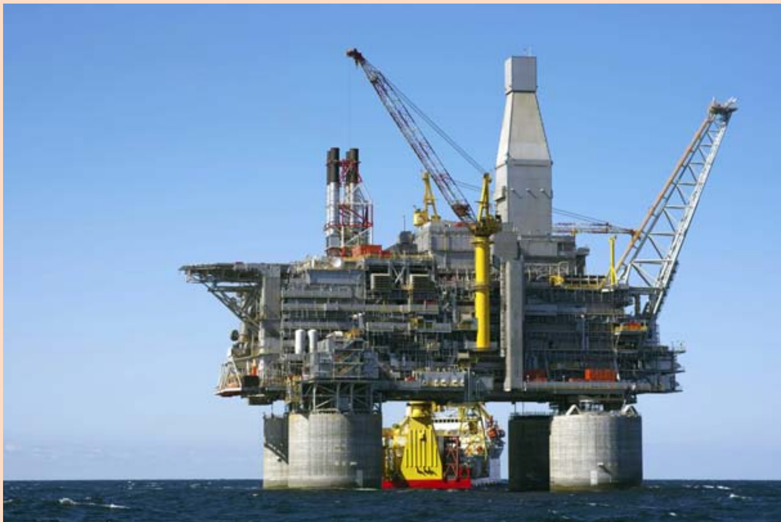
OLÍUBORPALLUR Framboð á olíu hefur aukist að undanförmu en hægst á aukningu eftirspurnar sem skýrir lægra verð, að sögn Ketils.

American Apparel hefur átt við rekstrarvanda að stríða um nokkra hrið en fyrirtækið tapaði sem nemur 2,6 milljörðum króna á síðasta ársfjórðungi. Sala á ársfjórðungnum dróst saman um 17 prósent. Fyrirtækið segir óljóst hvort það eigi nægt lausafé fyrir rekstur næstu tólf mánuði. American Apparel hyggst endurfjármagna skuldir félagsins en félagið býst við að skila tapi út þetta ár. - ih