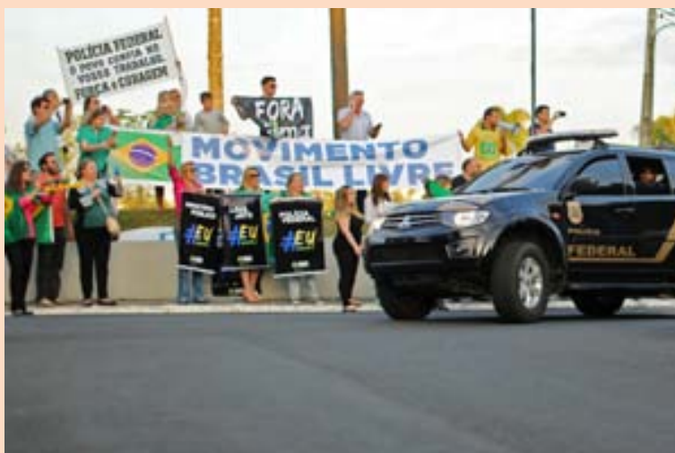
MÓTMÆLI Mikil reiði er meðal almennings í Brasilíu vegna framferðis stjórnenda Petrobras.

Í nóvember sendi bandaríska verðbræfaeftirlitið (SEC) stefnu þar sem farið var fram á upplýsingar vegna rannsóknar á spillingu hjá Petrobras sem