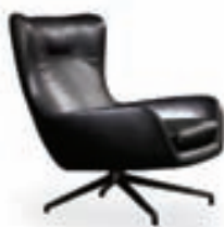
Jensen hægindastóll / Minotti