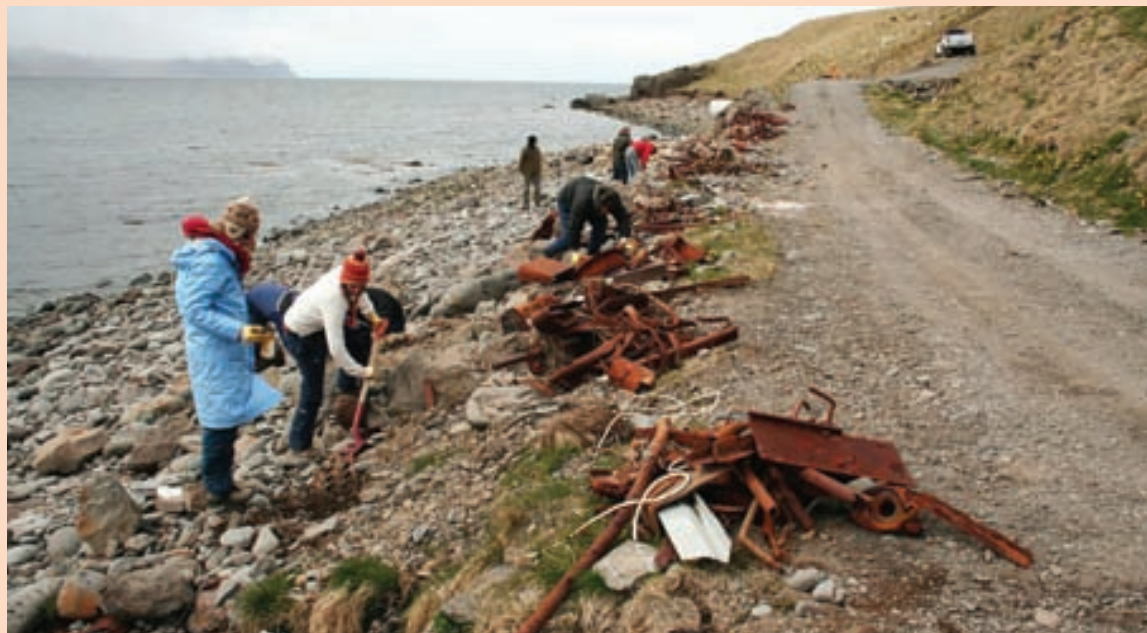
HREINSA FJÖRUNA Sjálfbóðaliðar Seeds hreinsa brak og rusl við fjöruborðið í Patreksfirði.