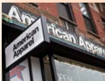
AMERICAN APPAREL Verslanir American Apparel eru um allan heim.

Heildarvirði Buzzfeed eftir fjárfestinguna er metið á 1,5 milljarða Bandaríkjadala. NBCUniversal og Buzzfeed munu á næstunni vinna saman í sjónvarpi, við kvikmyndir og umfjöllun um Ólympíuleikana, samkvæmt frétt The New York Times um málið. - ih