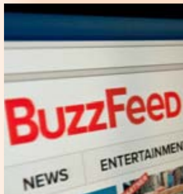
BUZZFEED Heildarvirði Buzzfeed er metið 1,5 milljarða Bandaríkjadala eftir fjárfestinguna.