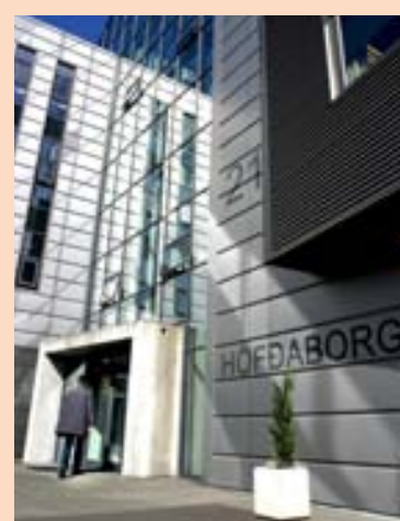
SPARNADUR Íbúðalánasjóður hyggst spara sér fé með nýju lánakerfi.