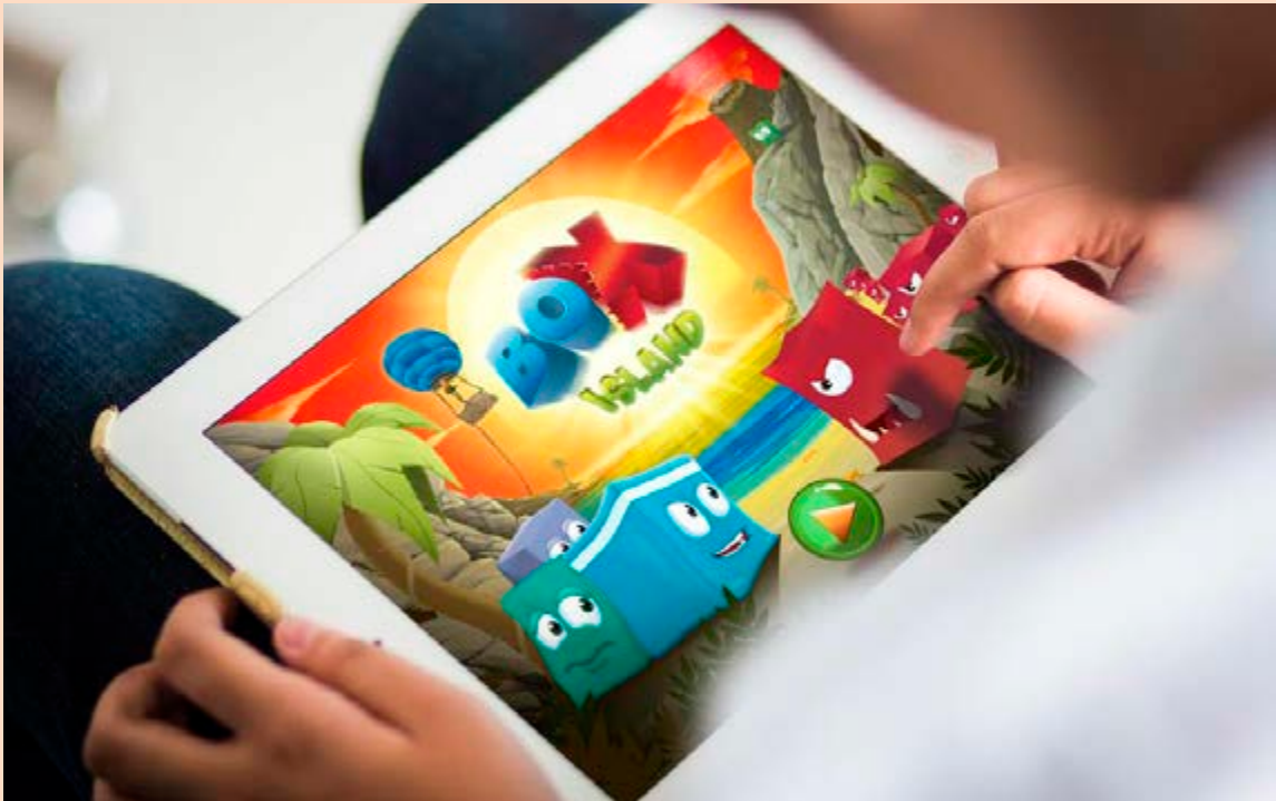
FORRITAD Box Island kemur til að byrja með einungis út á Íslandi.