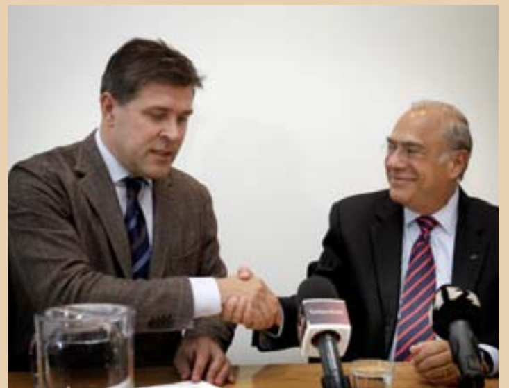
ÁNGEL GURRÍA OG BJARNI BENEDIKTSSON Á BLAÐAMANNAFUNDI.

Efnahags- og framfarastofnunin segir að Ísland sé með eitthvert besta sjávarútvegskerfi í heimi, þökk sé fiskveiðistjórnunarkerfinu sem sé markaðsdrifið. Verkefnið sem Ísland standi frammi fyrir sé að tryggja að auðurinn sem skapast af sjávarútvegi dreifist á sanngjarnan hátt og fram-tíðarvöxtur sé tryggður. Mikið sé rætt um það hér á landi hvernig dreifa eigi veiðiheimildum. Efnahags- og framfarastofnunin segist í 20 ár hafa talað fyrir kvótakerfinu sem Íslendingar tóku upp árið 1984, enda hafi það verið tekið upp til þess að koma í veg fyrir ofveiði og tryggja sjálfbærni. Hins vegar sé kerfið ekki gallalaust. Annars vegar sé stórt umhugsunarefni hvernig dreifa eigi veiðiheimildum, en það hafi verið gert á grundvelli veiðireynslu. Hins vegar sé hætta á samþjöppun í greininni. Íslendingar hafi glímt við þessi vandamál allt frá því að kerfið var tekið upp. Efnahags- og framfarastofnunin segir að það sé of seint fyrir Íslendinga að bjóða upp kvótann. Betra sé að byggja inn í kvótakerfið kerfi sem tryggir að arðurinn af auðlindinni dreifist jafnar. Í skýrslunni segir að Ísland sé þátttakandi í fiskveiðinefnd Efnahags- og framfarastofnunarinnar. Býðst stofnunin til þess að veita Íslendingum ráðgjöf, meðal annars til að þróa auðlindaskatt frekar og aðgerðir til að hindra frekari samþjöppun í greininni.