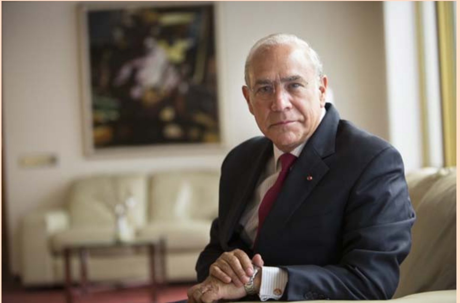
GURRÍA SEGIR AÐ STAÐA ÍSLENDINGA SÉ GÓÐ EN HEFUR ÁHYGGJUR AF PVÍ AÐ LAUNASKRÍÐ GETI ORÐIÐ OF MIKIÐ HÉR Á LANDI.

Gurría segir að viðskiptabann Rússa á Íslandi muni vissulega hafa áhrif á sjávarútveginn. Spurður hvort