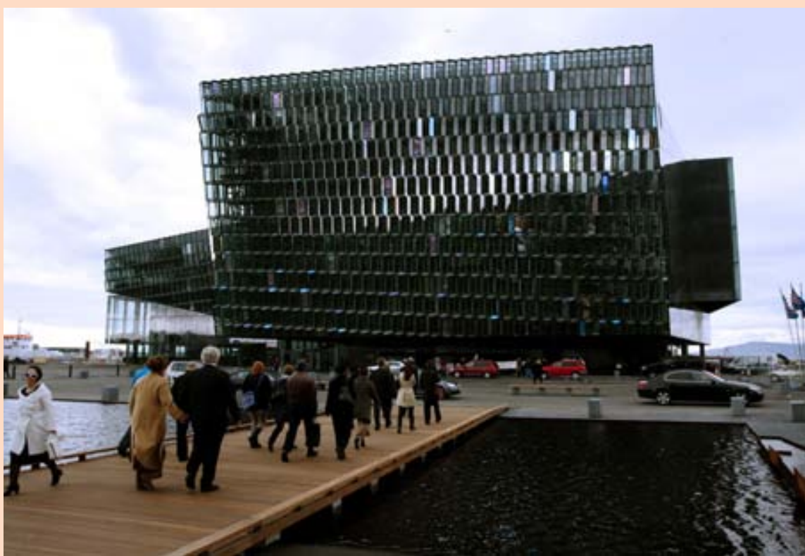
HARPAN Fasteignagjöld hafa haft mikil áhrif á rekstur Hörpu.

Fasteignagjöldin sem Harpa greiðir renna til Reykjavíkurborgar, sem á 46 prósentu hlut í Hörpu á móti 54 prósentu hlut ríkisins. Ríkið og Reykjavíkurborg greiða um milljarð króna árlega af 19,5 milljarða króna skuldabréfi sem gefið var út til að fjármagna byggingu Hörpu. Þar að auki hafa ríkið og Reykjavíkurborg skuldbundið sig til að greiða beint til reksturs Hörpu um 170 milljónir króna árlega út árið 2016. ingvar@frettabladid.is