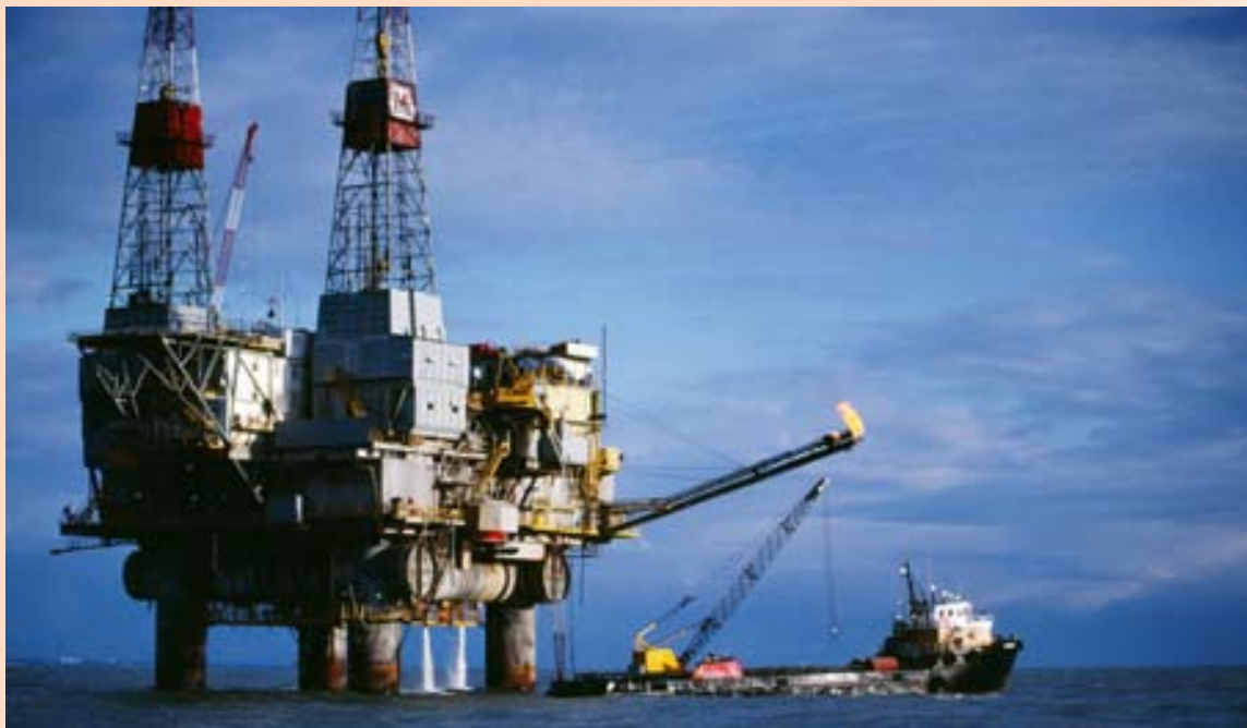
BORPALLUR Almenn kostar sú vinnsla sem nauðsynleg er til að uppfylla olíuþörf heimsins 50-70 dali á hverja tonnu.