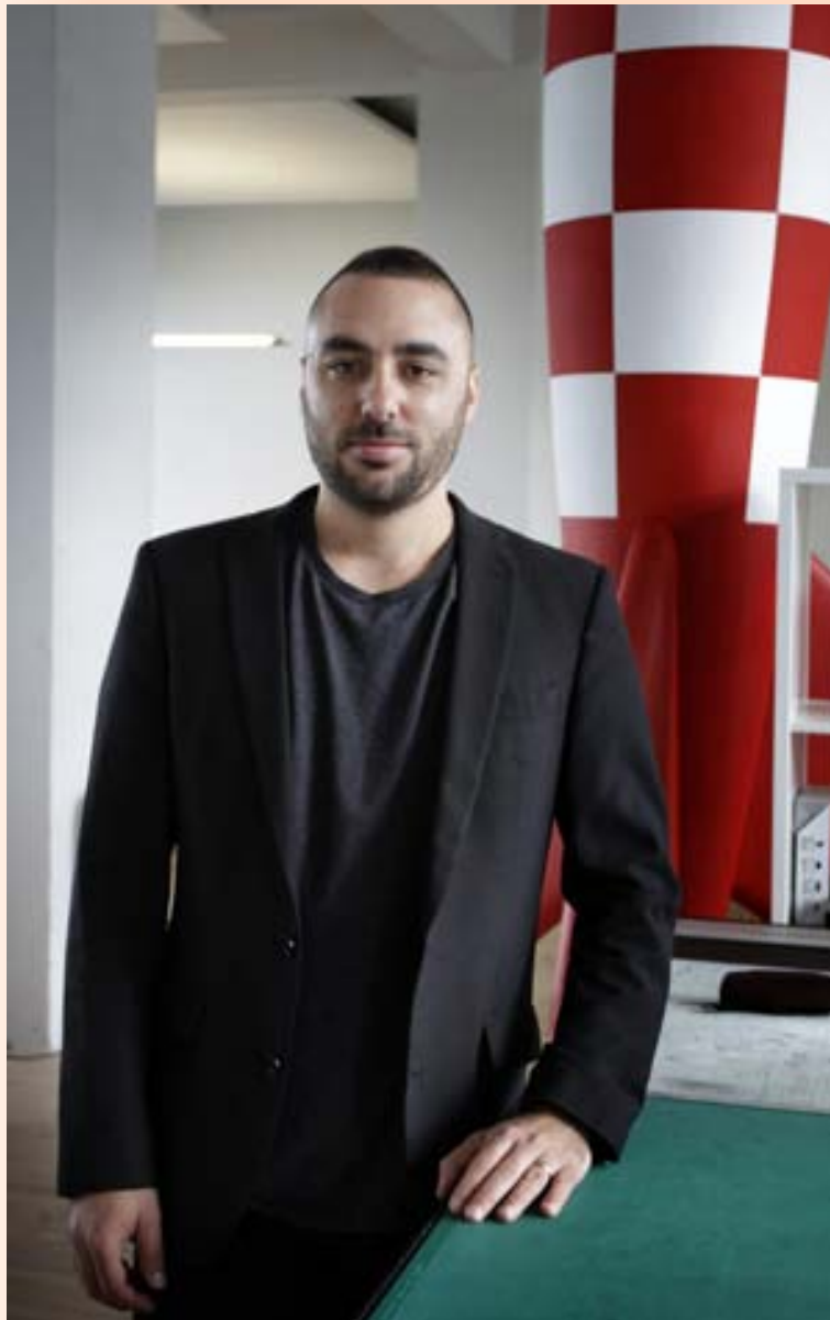
Í BREYTTUM HEIMI Eid segir að fjölmiðlar gætu orðið fyrirmynd að verklagi sem markaðsfólk þurfi að taka upp.