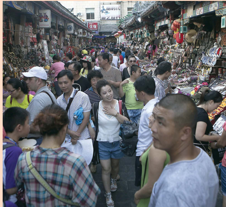
KOSTNAÐARSAMT GETUR VERIÐ AÐ KLIKKA Á AÐ KYNNNA SÉR KÍNVERSKA KAUPSÝSLUHÆTTI.