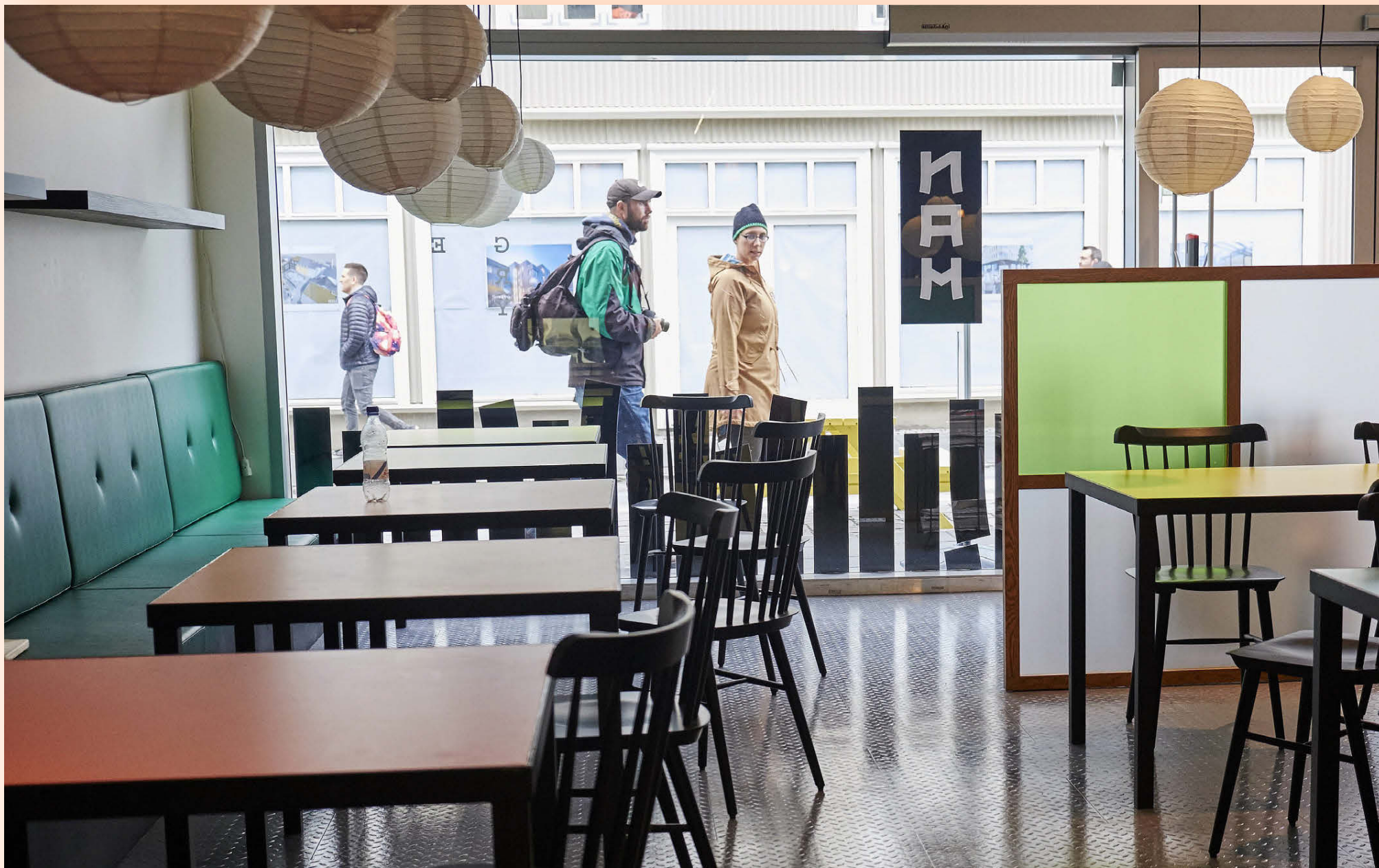
Fulltrúi Reykjavíkurborgar kom að máli við eigendur Nam rétt fyrir áætlaða opnun staðarins og tilkynnti þeim að borð og stólar mættu ekki vera sjáanleg frá götunni.