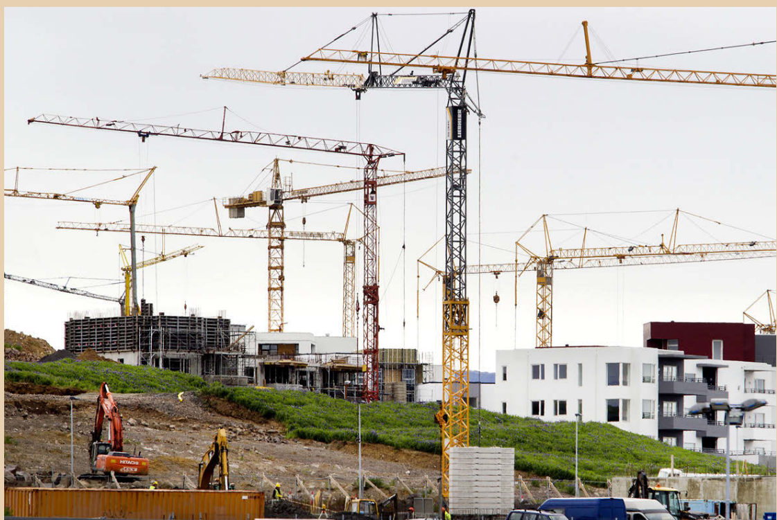
Byggingaverktakar telja að hægt sé að lækka kostnað með breytingu á byggingarreglugerð.