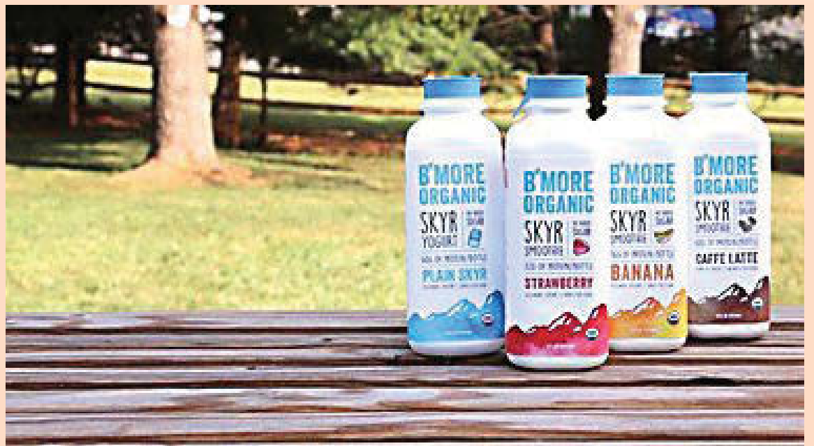
FJÖLBREYTTUR Skyr-smoothie fæst nú með mörgum mismunandi bragðtegundum, meðal annars caffe latte.