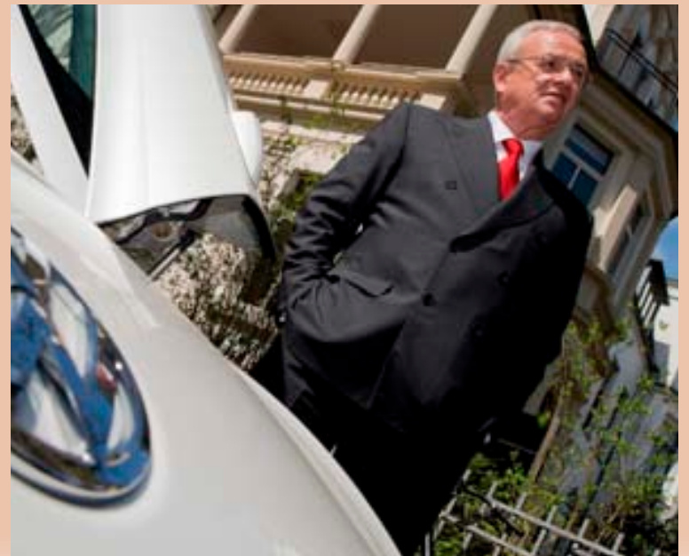
MARTIN WINTERKORN, FORSTJÓRI FYRIRTÆKISINS, VERÐUR KYRR Í STARFI UM SINN.

Prýstingur er á Martin Winterkorn, forstjóra VW, að láta af embætti vegna málsins. Hann ætlar að vera kyrr um sinn. – sg, jhh