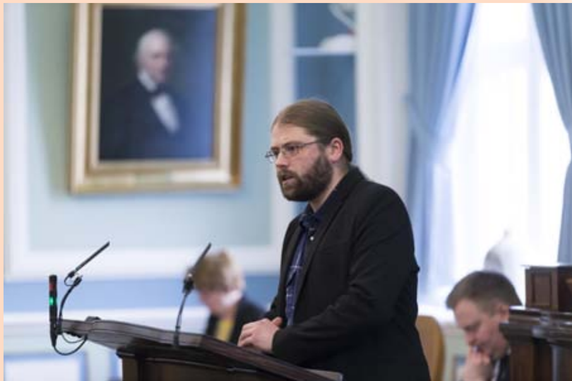
Greinarhöfundur biður Pírata um lausnir í stað þess að gagnrýna markaðinn.

Þetta eru viðbrögð markað- arins við breyttu landslagi og kröfum viðskiptavina um ný við- skiptamódel og þar með hafa íslensk afþreyingarfyrirtæki lækkað þróskuldinn fyrir neyt- andann til að nálgast löglegt efni með þeim hætti sem neytand- inn kys. Það er hins vegar erfitt