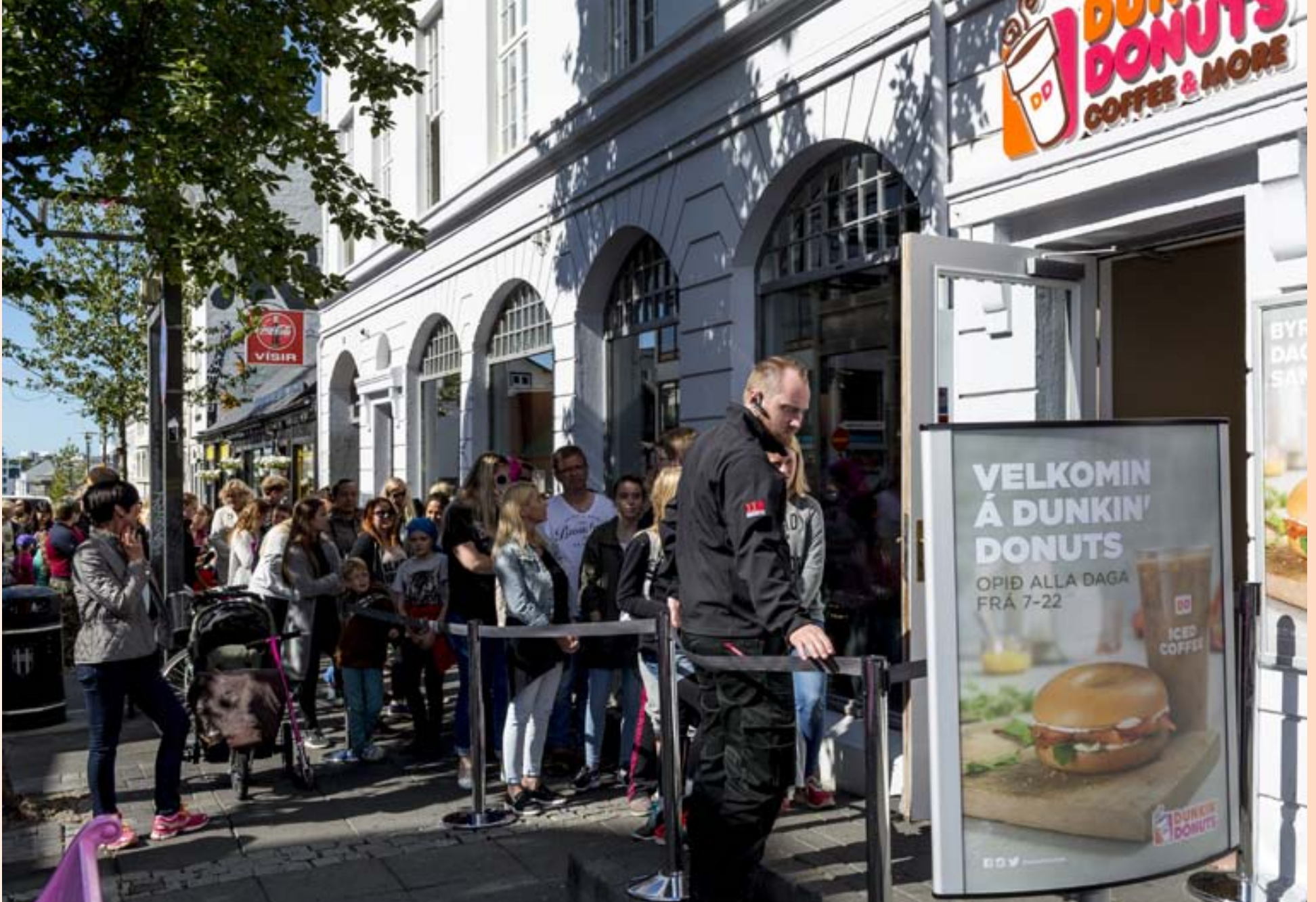
PENSLAN HELDUR ÁFRAM Útlit er fyrir að vöxtur einkaneyslu haldi áfram.