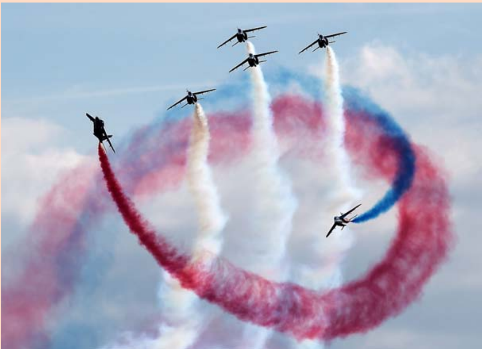
Þotur úr flugflota Patrouille de France léku listir í Hagenau í austurhluta Frakklands á sunnudaginn.