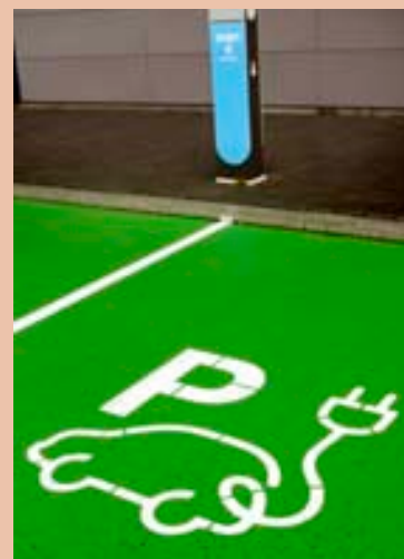
Kaupás er með raffhleðslustöð í Lindunum þar sem Elkó og Krónan eru.

Gengið var til samstarfs við Skeljung í september 2014 um að bjóða þægindaverslun 10-11 við flestar eldsneytisstöðvar Skel-