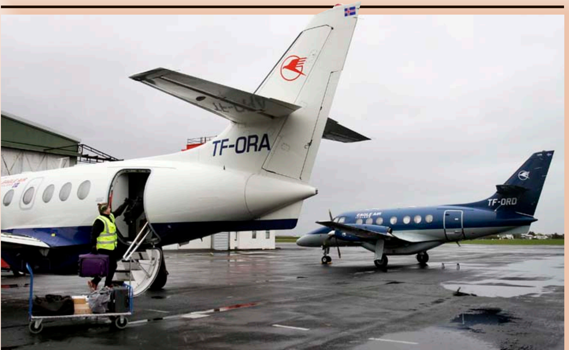
Flugfélagið Ernir á þrjár vélar af gerðinni Jet Stream 32, sem eru nitján sæta. Þeirri fjórðu verður bætt við. Að auki á flugfélagið minni vélar sem eru meðal annars notaðar í útsýnisflug.