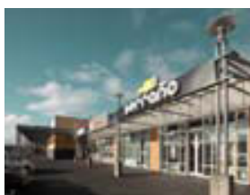
Spöngin í Grafarvogi 50 – 200 m 2 Rými á fjölförnu svæði.

Reitir eru stærsta fasteignafélagið á sviði útleigu atvinnuhúsnæðis á Íslandi. Við eigum húsnæði tilbúið til afhendingar eða lagað að þínum þörfum.