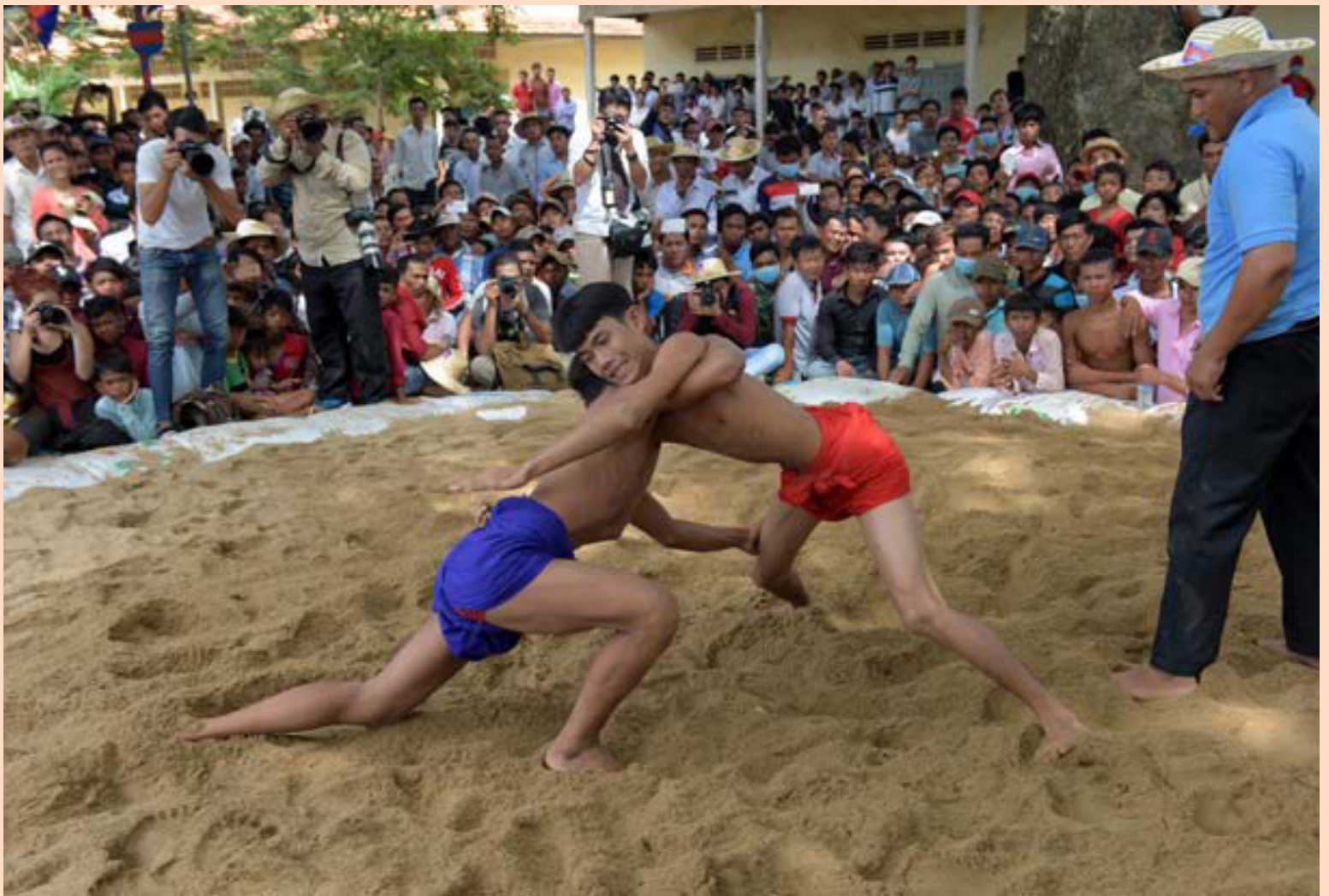
Kambódíumenn glímdu á Pchum Ben-hátíðinni, þar sem látinna er minnst, í þorpinu Vihear Suor í Kandal-héraði á mánudaginn. Þúsundir landsmanna flykkust til þorpsins til þess að taka þátt í þessari fimmtán daga hátíð sem er senn á enda.