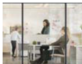
Margir bestu verslunarkjarnar landsins eru í okkar safni. Kannaðu möguleikana.