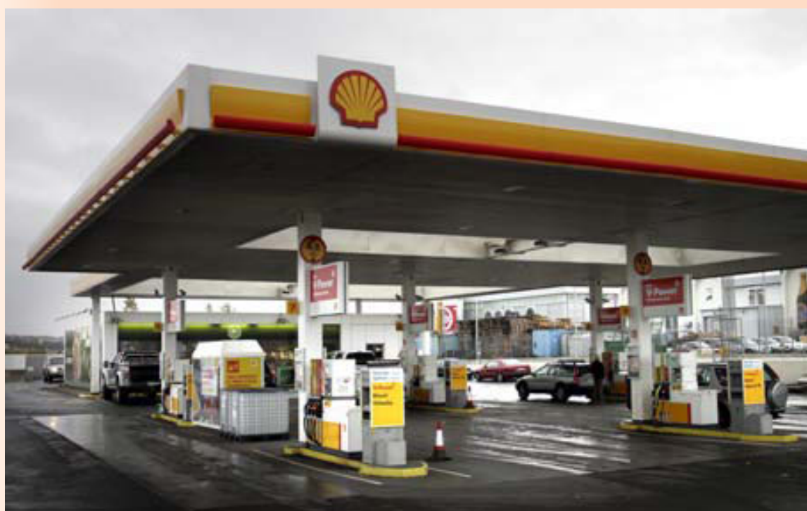
Skeljungur er núna að stórum hluta í eigu lífeyrissjóða og Arion banka.