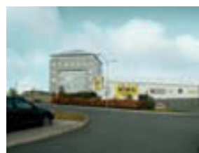
Þverholt í Mosfellsbæ 60 – 200 m 2 Rými í vinsælum kjarna.