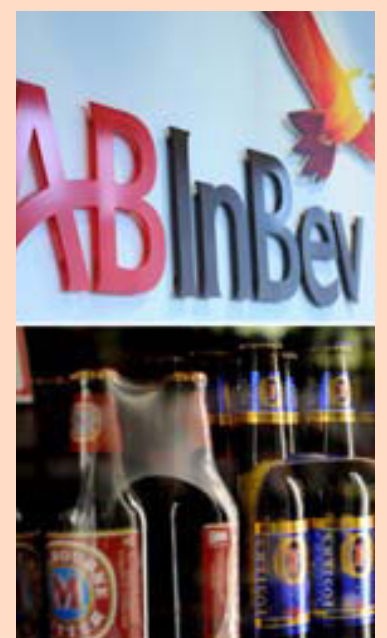
AB InBev framleiðir meðal annars Budweiser.

AB InBev hefur þangað til 28. október til að senda lokatilboð til SABMiller. Stjórn SABMiller hefur nú sagt að hún muni einróma styðja núverandi tilboð. – sg