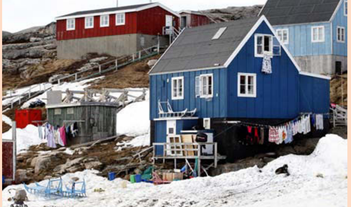
Efnahagskreppa hefur verið á Grænlandi síðustu ár og landsframleiðsla dregist saman um ríflega tvö prósent. Hér hefur þvottur verið hengdur til þerris í Kulusuk.