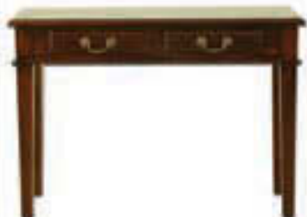
Hliðarborð - verð 57.000 Tilboð 42.000