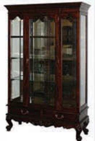
Glerskápur - verð 212.000 Tilboð 169.000