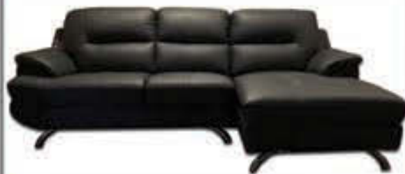
Park Lane tungusófi - leður - verð 398.000 Tilboð 295.000