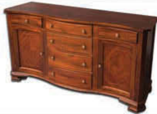
Serpentine skenkur - verð 219.000 Tilboð 169.000