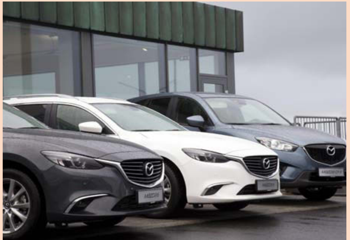
Bílasala hefur aukist til muna á þessu ári.

Netfang auglýsingadeildar auglysingar@markadurinn.is Veffang visir.is