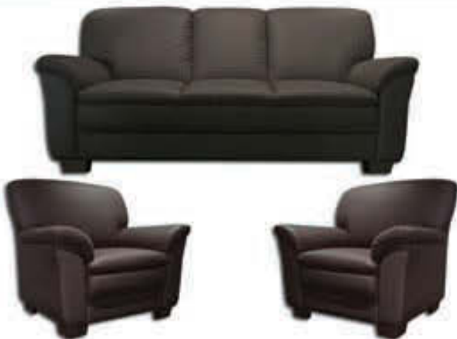
Classico sófasett - leður - verð 437.000 Tilboð 349.000