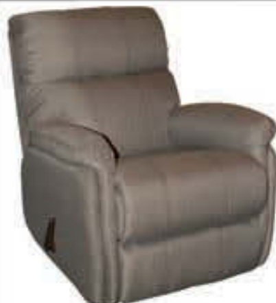
Hægindastóll áklæði - verð 89.000 Tilboð 69.000