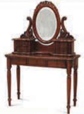
Snyrtiborð - verð 129.000 Tilboð 105.000