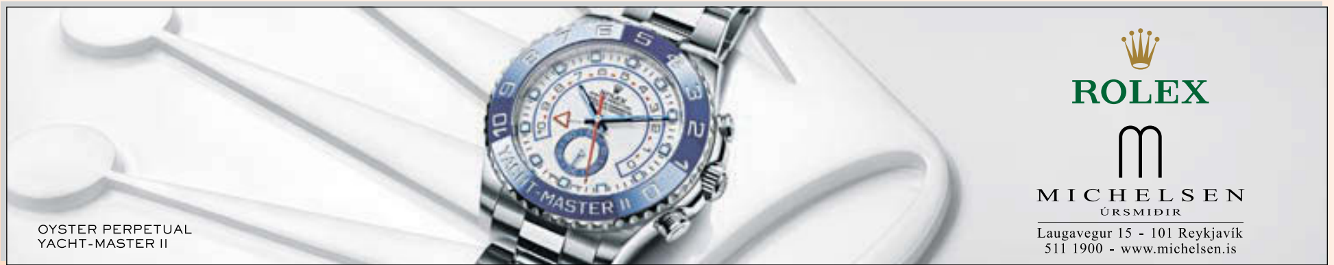
OYSTER PERPETUAL YACHT-MASTER II