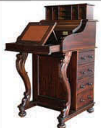
Skrifpúlt - verð 129.000 Tilboð 97.000