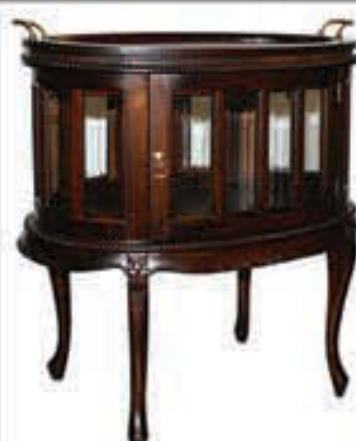
Teborð - verð 66.000 Tilboð 49.000