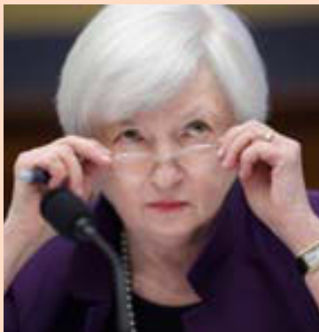
Janet Yellen er seðlabankastjóri Bandaríkjanna.

Hátt gengi dollarans er gott fyrir innflutning til landsins, þar sem vörur verða ódýrari fyrir almenna neytendur, og fyrir Bandaríkjamenn á ferðalagi. Hins vegar hefur það neikvæð áhrif á afkomu stærri bandarískra fyrirtækja sem starfa á alþjóðamarkaði. Auk þess getur þetta dregið úr fjölda ferðamanna sem koma til Bandaríkjanna. Hlutaþréf í ferðaskrifstofunni Priceline lækkuðu til að mynda um 10 prósent á mánuðaginn eftir að tilkynnt var að afkoma yrði undir áætlun á árinu.