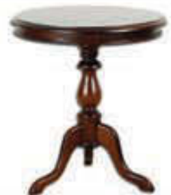
Lampaborð - verð 37.000 Tilboð 27.000