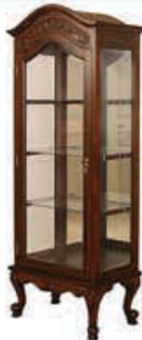
Glerskápur - verð 165.000 Tilboð 123.000