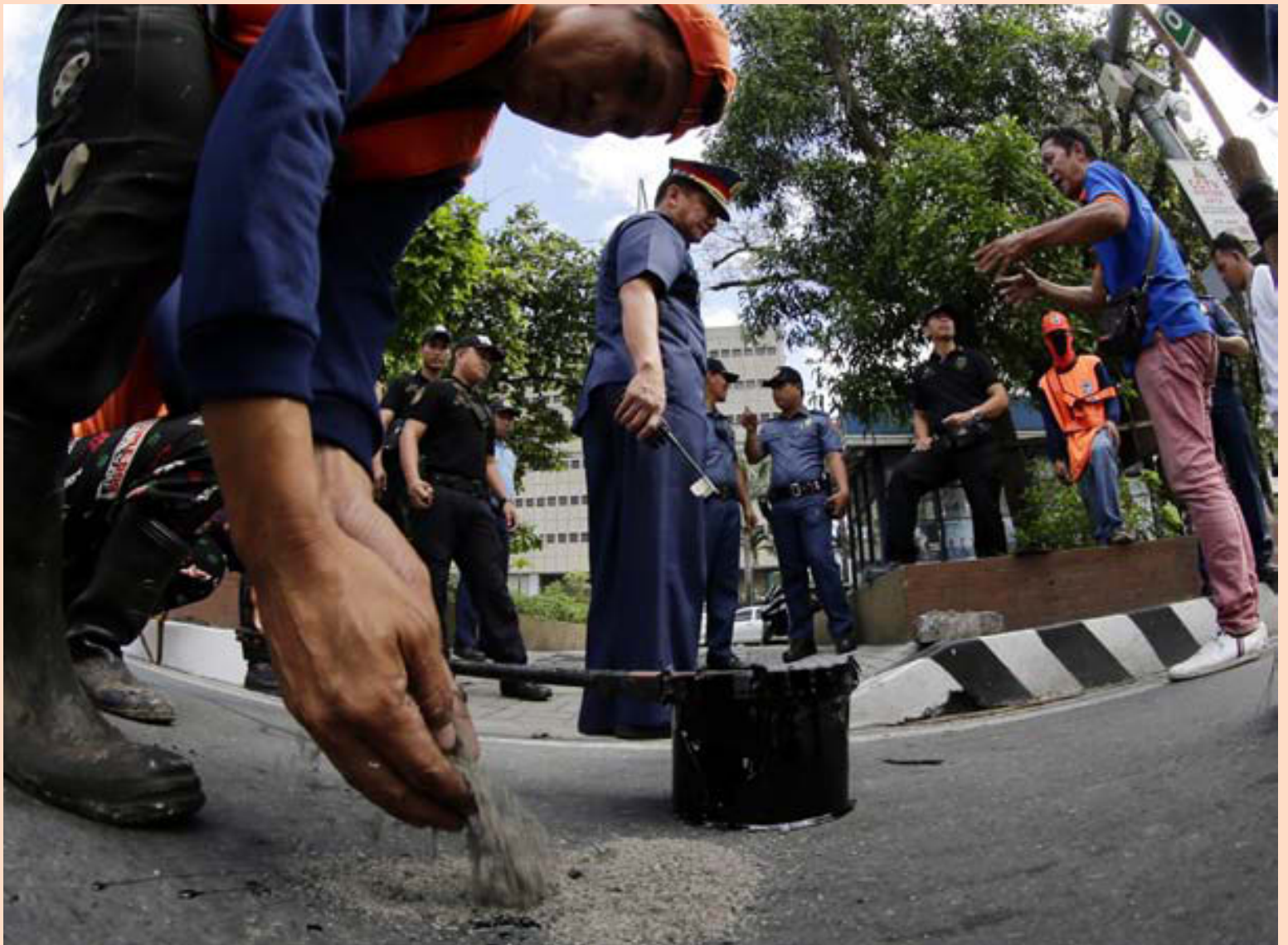
Lögglumenn á Filippseyjum kanna persónueinkenni verkamanna á götu sem liggur að svæðinu þar sem fulltrúar Efnahagsráðs Asíu- og Kyrrahafsríkjanna hittast í vikunni. Fundurinn hefst á morgun og nær hámarki dagana 18.-19. nóvember.