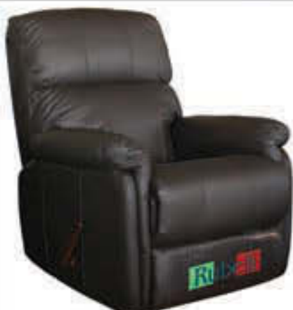
Hægindastóll leður - verð 139.000 Tilboð 109.000