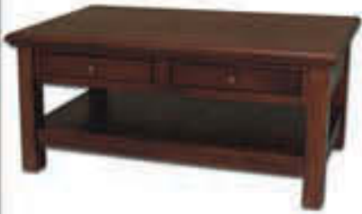
Sófaborð - verð 84.000 Tilboð 67.000