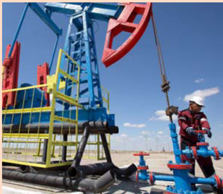
Oliuvinnsla í ríkjum utan OPEC hefur dregist saman að undanfögnu. Hér má sjá starfsmann vinna við oliuborholu í Kasakstan.

Þá muni aukid framboð endurnýjanlegra orkugjafa enn frekar draga úr eftirspurninni eftir olíu á næstu árum. – ih