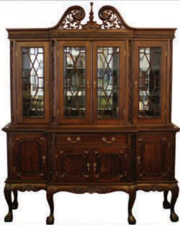
Chippendale skápur - verð 340.000 Tilboð 259.000