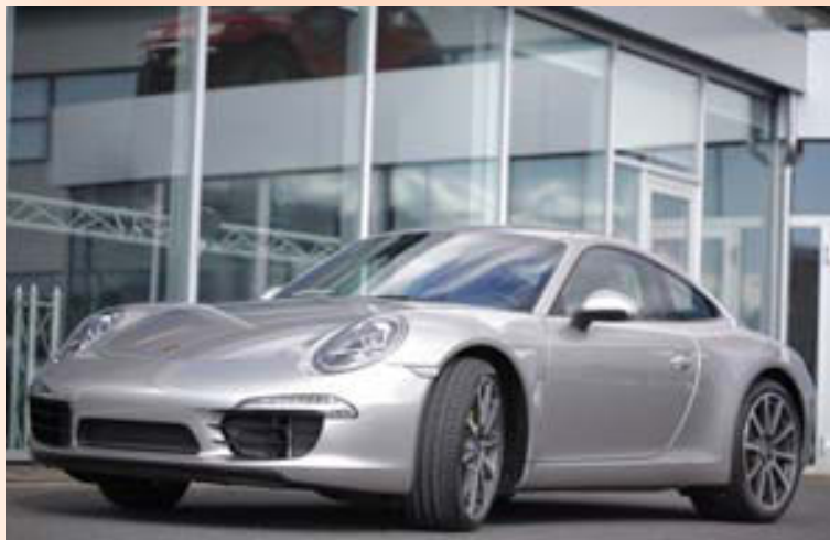
Porsche á yfir 30 prósent af hlutabréfum Volkswagen.

Talið er líklegt að Janet Yellen, seðlabankastjóri Bandaríkjanna, muni hækka stýrivexti á næsta vaxtaákvörðunarfundi í desember. Sérfræðingar telja þó að hún muni þurfa að íhuga stöðuna vandlega í ljósi styrkingar dollarans. – sg