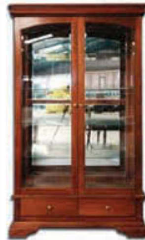
Glerskápur - verð 224.000 Tilboð 169.000