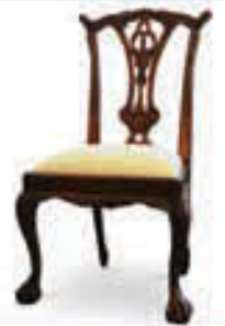
Borðstofustóll - verð 49.000 Tilboð 36.000