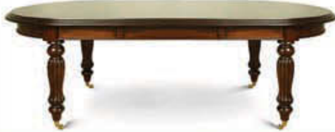
Borðstofuborð - verð 247.000 Tilboð 187.000