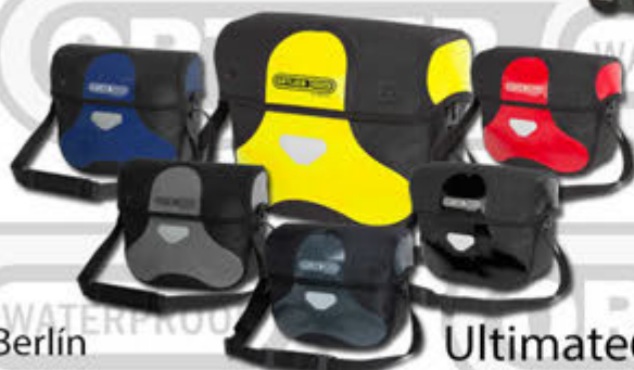
Ultimate6 Classic Stýristaska - 7 lítra Kr. 15.900,-

Allar vörur ORTLIEB eru 100% ryk- og vatnsheldar með 5 ára ábyrgð