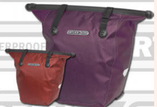
Bike-Shopper Hjólataska - 20 lítra Kr. 16.600,-