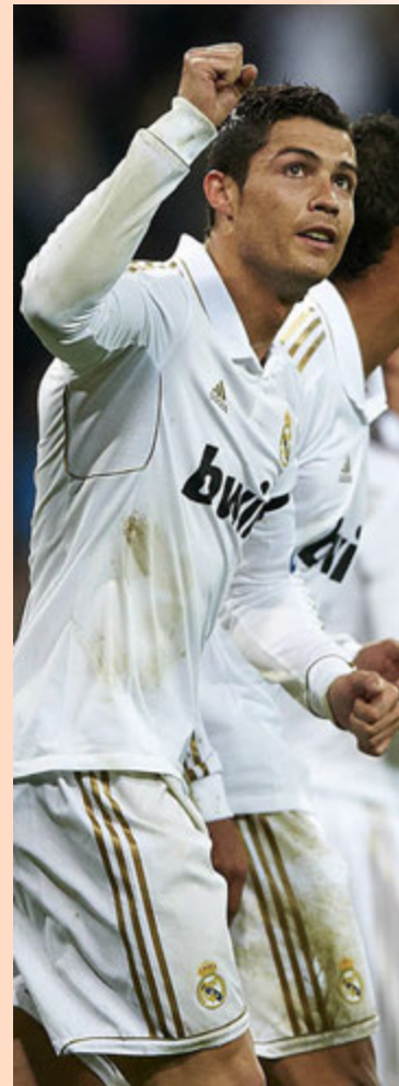
Ronaldo hefur tvi-vegis verið valinn besti leikmaður heims sem leikmaður Real Madrid.

Calderón segir hann hafa náð samningum við Ronaldo tímabilið 2007/2008. „Ég samdi við hann en hann bað mig um að fá að vera ár í viðbót því að hann var mjög þakklátur aðdaendunum, Ferguson og borginni,“ segir Calderón. Gengið hafi verið frá samningunum í desember 2008 og Ronaldo var svo kynntur til leiks í Madrid sumarið 2009.