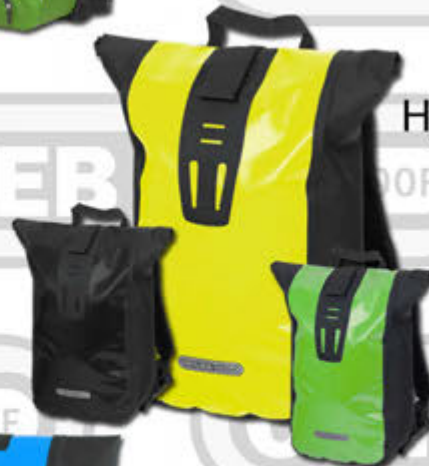
Velocity Bakpoki - 20 lítra Kr. 18.900,-