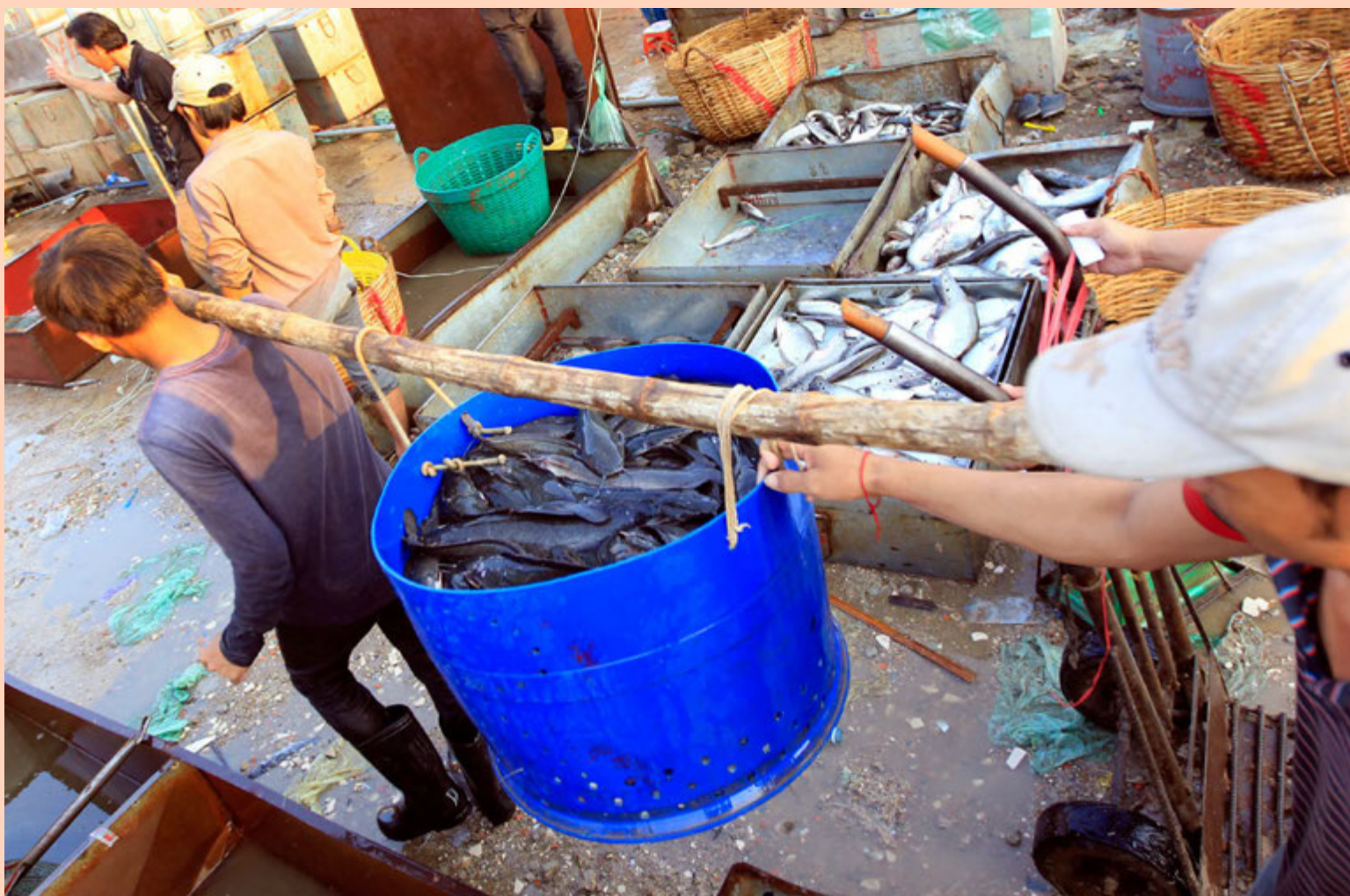
Yfirvöld í Kambódíu hafa áhyggjur af því að loftslagsbreytingar hafi áhrif á lífríki sjávar og vilja draga úr veiðum. Þessir Kambódíumenn virtust þó áhyggjulausir þegar þeir báru fisk á markað í höfuðborginni Phnom Penh.