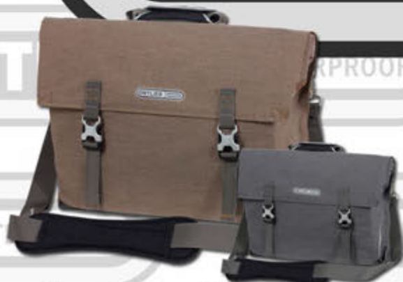
Commuter-Bag Urban Line Hjólataska - 14 lítra Kr. 28.900,-