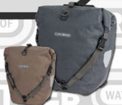
Back-Roller Urban Line Hjólataska - 20 lítra Kr. 14.900,-