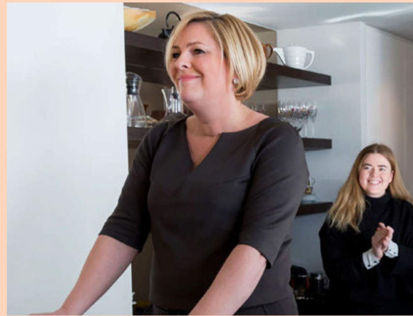
Halla Tómasdóttir ásamt stuðningsmönnum þegar hún lýsti því yfir að hún hygðist bjóða sí