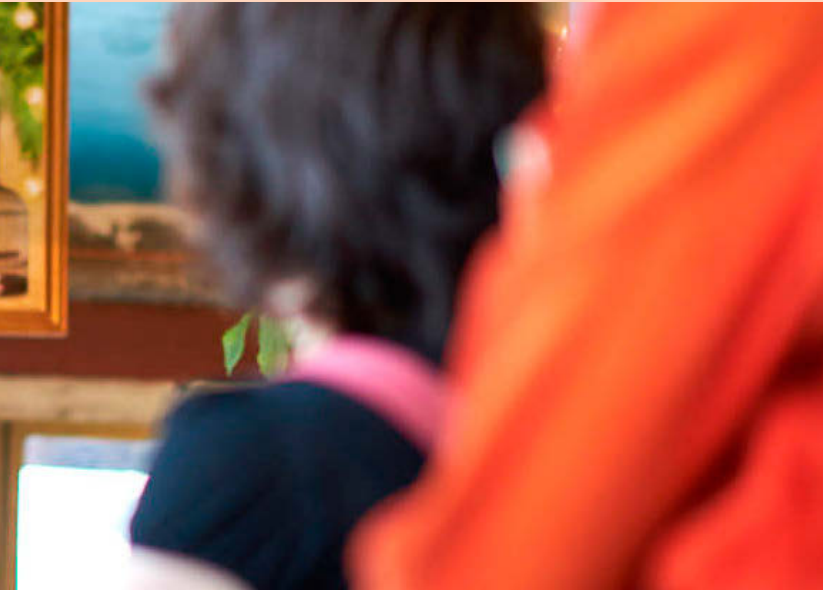
Þriðjónfundaverðlaunin Grand Prix de l'Imaginaire í flokki visindasagna fyrir bókina LoveStar.

sem kom að framboðunum. Búist er við að kosninga- þó skipta mestu máli að mati almannatengils.