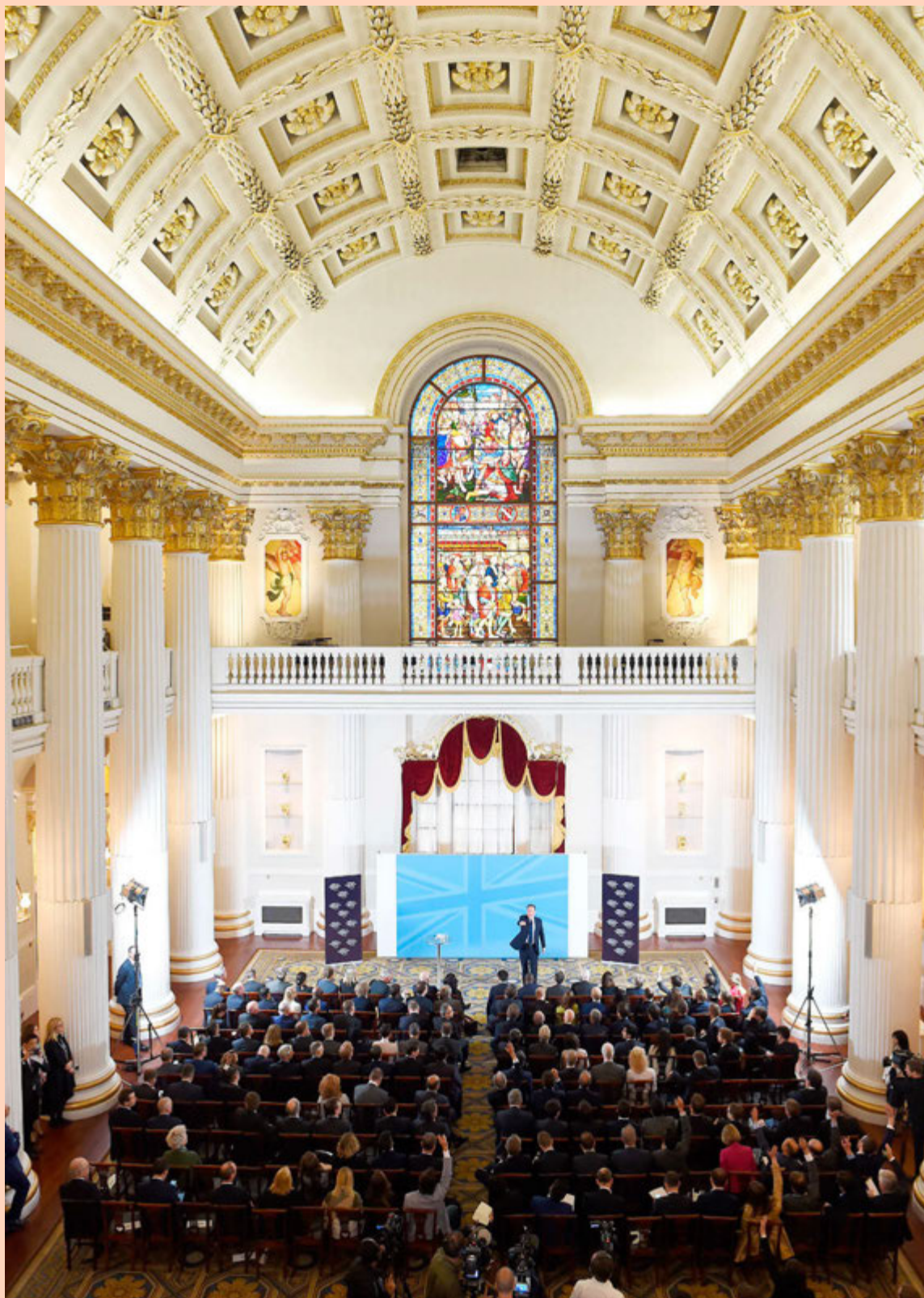
David Cameron, forsætisráðherra Breta, ávarpaði Alþjóðaefnahagsráðið (World Economic Forum) í Lundúnum í gær. Í ræðu sinni ræddi Cameron meðal annars fyrirhugaða þjóðaratkvæðagreiðslu um útgöngu Breta úr Evrópusambandinu. Sagði hann að hryðjuverkamenn Íslamska ríkisins myndu fagna útgöngu.