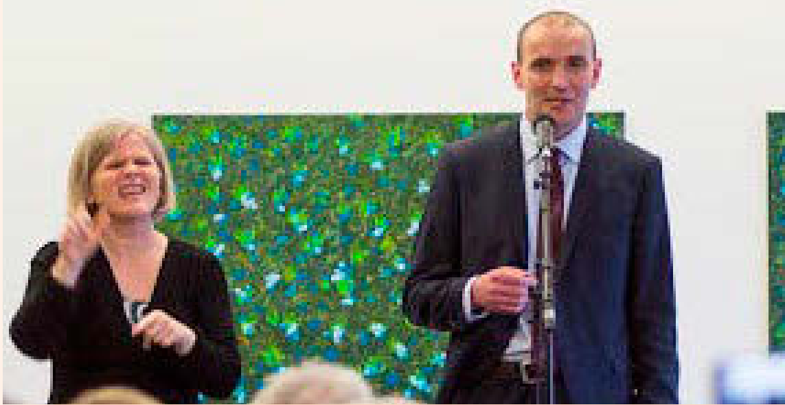
Húsfyllir var þegar kosningaskrifstofa Guðna Th. Jóhannessonar var opnuð um helgina.

Mörg hundruð manns aðstoða frambjóðendur sem notið hafa mests fylgis. Mörg handtök þarf að vinna og allt kosti þetta sitt að sögn þeirra baráttan kosti tugi milljóna en lög um framboðin flækja fjármögnun. Kosningabaráttan 1996 var mun dýrari. Frammistaða í sjónvarpi mun