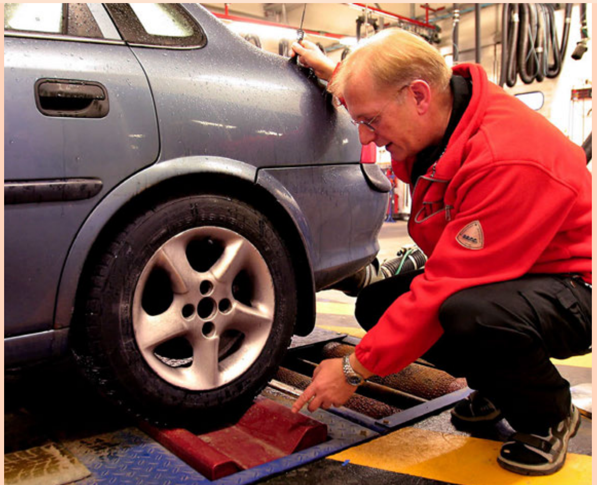
Einn meginþátturinn í starfsemi Frumherja er skoðun ökutækja.

Netfang auglýsingadeildar auglysingar@markadurinn.is Veffang visir.is