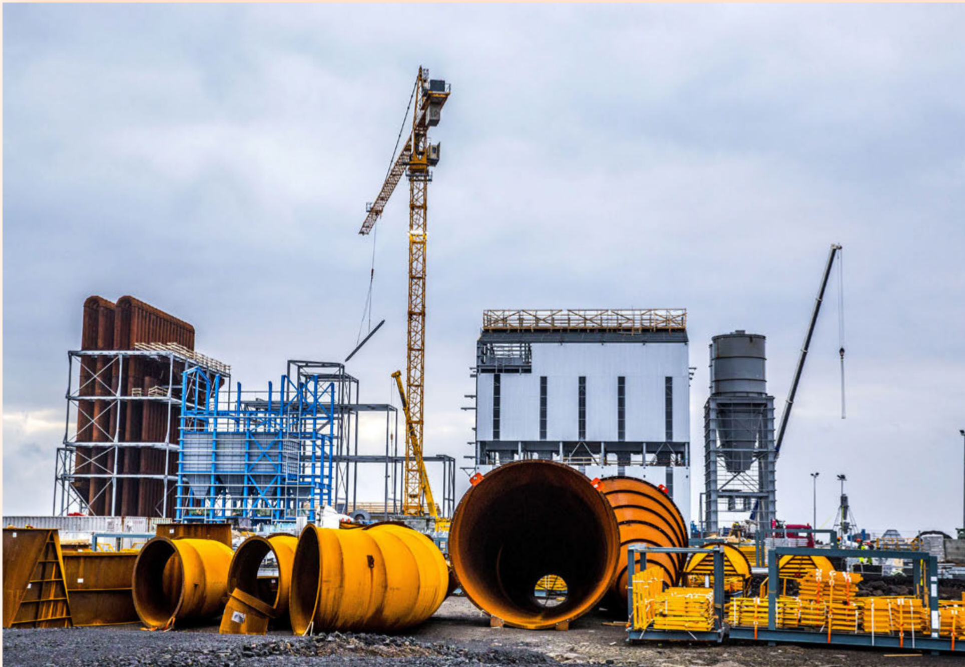
Búist er við að kísilver United Silicon í Helgúvík muni taka til starfa á þessu ári en framkvæmdir eru í gangi. Reykjanesbær hefur lagt milljarða í rekstur Reykjaneshafnar sem er í greiðslustöðvun.