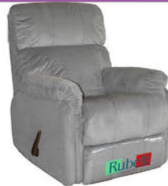
Rubelli hægindastóll - verð 89.000