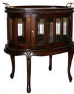
Teborð - verð 66.000