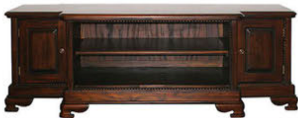
Sjónvarpsskápur - verð 172.000