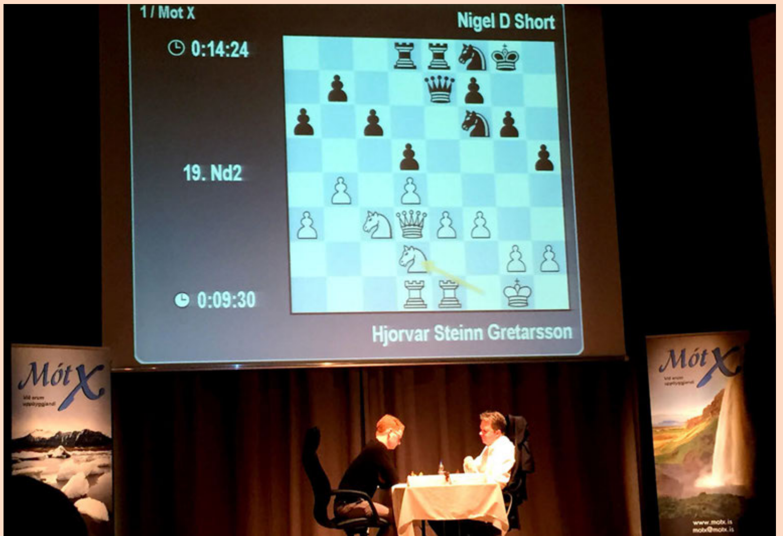
Hjörvar Steinn Grétarsson, yngsti stórmeistari Íslands í skák, og Nigel Short mættust í Salnum í Kópavogi um síðustu helgi og tefldu sex atskákir. Short vann mótið með 4,5 vinningum gegn 1,5. Það var skákfélagið Hrókurinn sem stóð fyrir mótinu en aðalstyrktaraðilinn var verktakafyrirtækið MótX.