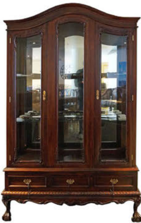
Chippendale glerskápur - verð 230.000