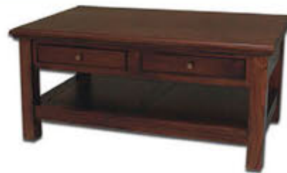
Sófaborð með 4 skúffur - verð 93.000