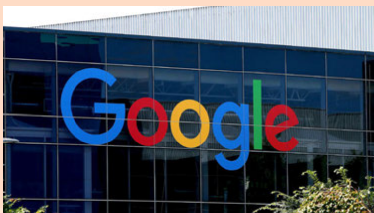
Franska ríkið hefur sakað Google um að eiga eftirstandandi 1,6 milljarða evra, 223 milljarða íslenskra króna, í ógreidda skatta.

Evrópusambandið kynnti í apríl áætlun sem mun knýja fyrirtæki til að greina betur frá skattaaðgerðum sínum. Fyrirtæki þurfa opinberlega að greina frá því hve mikið þau greiða í skatt í hverju Evrópusambandslandi, sem og hvað þau geyma í skattaparadísnum. – sg