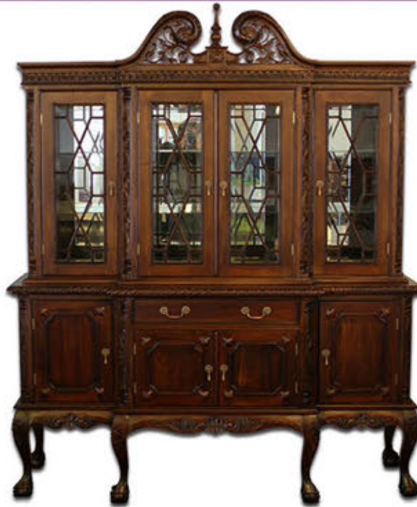
Chippendale stofuskápur - verð 379.000