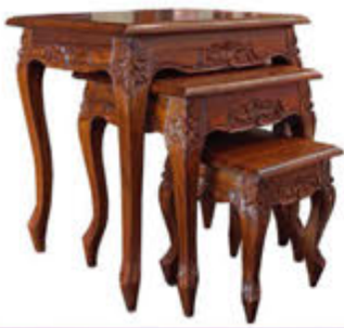
Innskotsborð - verð 57.000