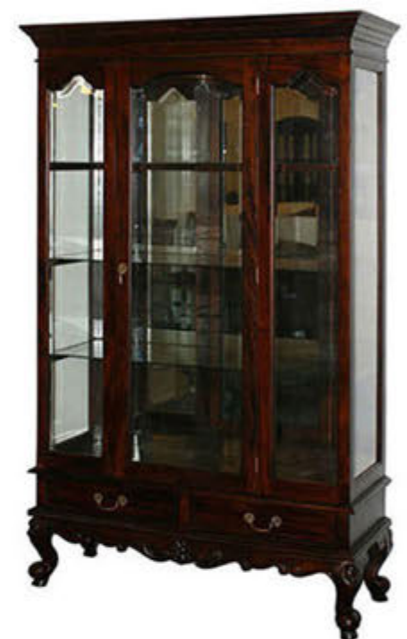
Chippendale glerskápur - verð 212.000