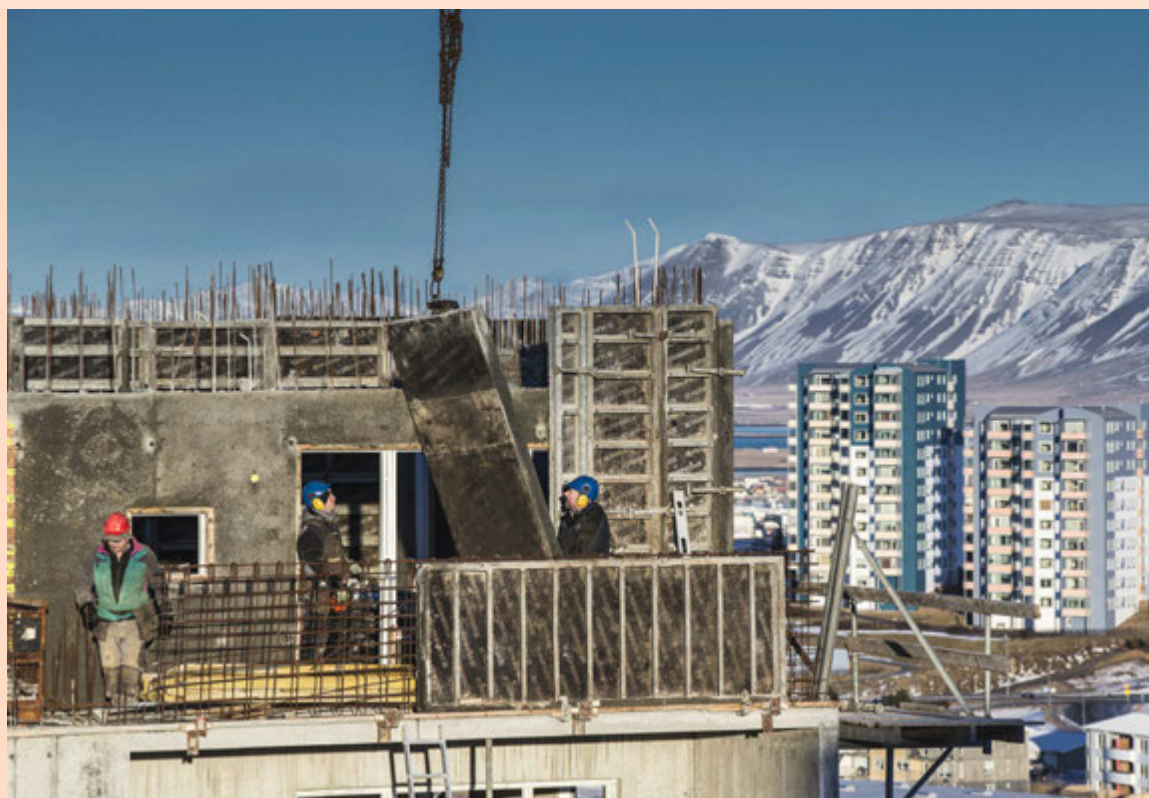
Lúðvík segir að þótt fólksflutningar skýri stóran hluta af þeirri verðhækkun sem varð á íbúðarhúsnæði á árunum 2004 fram til ársins 2008 þurfi hið sama ekki að eiga við núna.