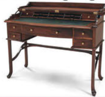
Campaign skrifpúlt - verð 176.000