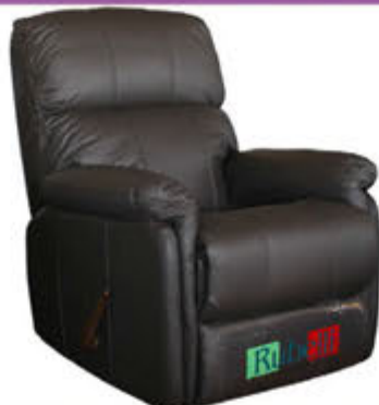
Rubelli hægindastóll - verð 139.000