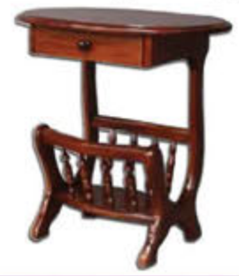
Blaðgrindarborð - verð 43.000