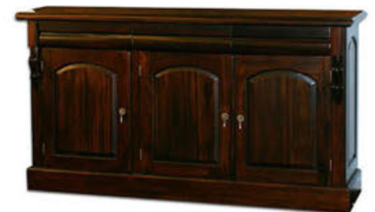
Viktorian skenkur - verð 231.000