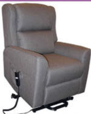
Carrera lyftistóll - verð 159.000