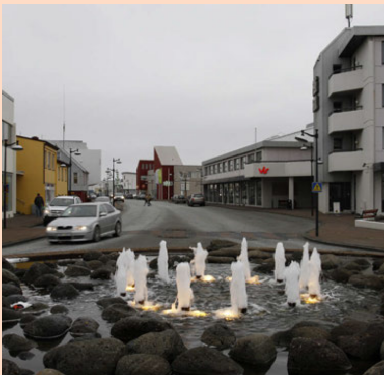
Skuldir Reykjanesbæjar hafa margfaldast síðustu ár og á bærinn að óbreyttu ekki fyrir framtíðarskuldbindingum.

Búist var við því að álver Norðurláns myndi rísa í Helgúvik enda hófust framkvæmdir við byggingu álversins sumarið 2008. Frá árinu 2008 hefur Reykjaneshöfn lagt í fjárfestingar upp á 1,8 milljarða króna. Framkvæmdir við álverið í Helgúvik hafa þó verið í biðstöðu síðustu ár, meðal annars vegna deilna um raforkuverð við HS Orku og óvissu um fjármögnun verkefnisins. Þá var skrifað undir viljayfirlýsingu við Íslenska kísilfélagið árið