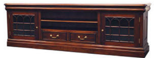
Sjónvarpsskápur - verð 242.000