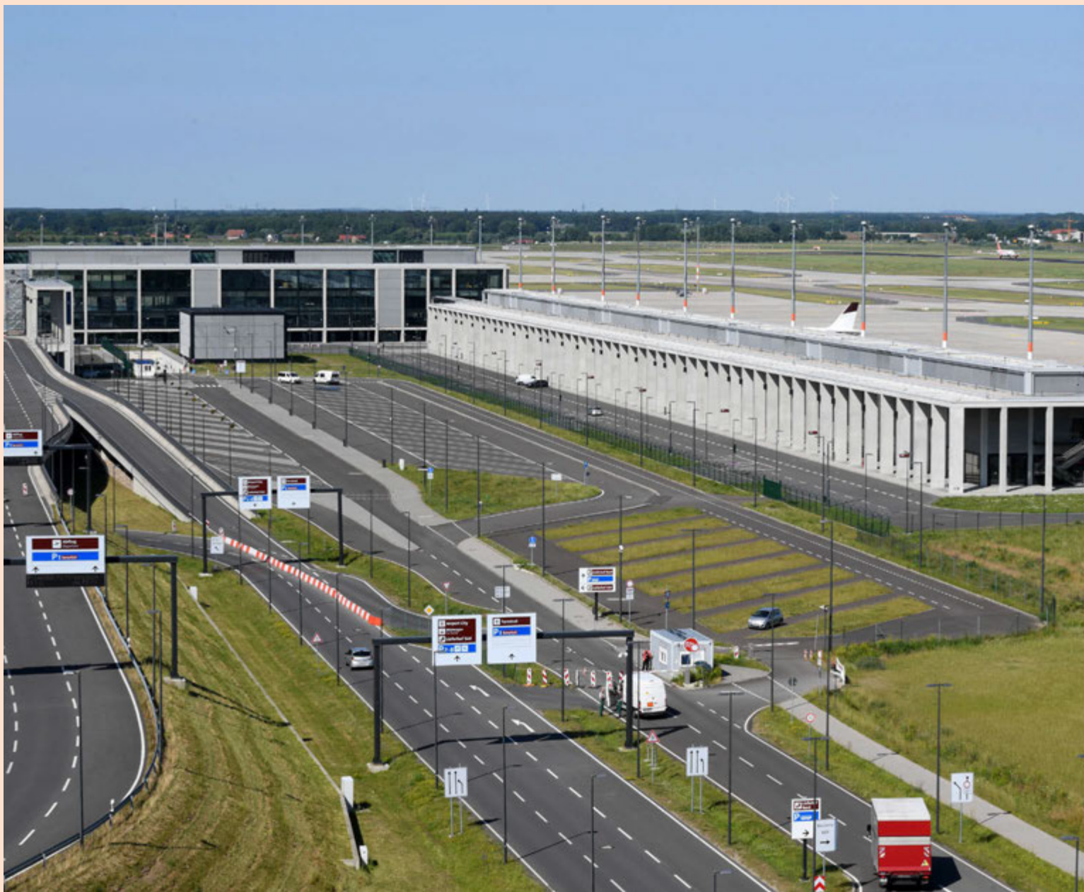
Norðurhluti nýs flugvallar í Berlín í Þýskalandi. Ríkisstjórnin í Brandenburg mun á næstu dögum ræða hvort vígsla flugvallarins fari fram haustið 2017 eða hvort henni verður frestað. Framkvæmdum við flugvöllinn hefur ítrekað verið frestað undanfarið vegna óviðráðanlegra ástæðna.