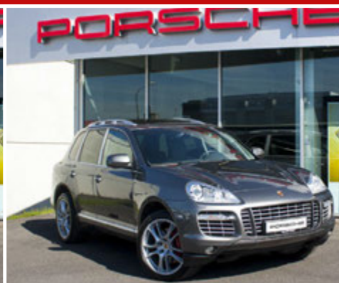
PORSCHE CAYENNE TURBO

Bensín | Sjálfskiptur | Skráningarár: 02/2008 Ekinn: 80.000 km.