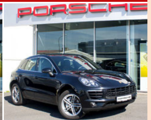
PORSCHE MACAN S

Diesel | Sjálfskiptur | Skráningarár: 07/2014 Ekinn: 25.000 km.