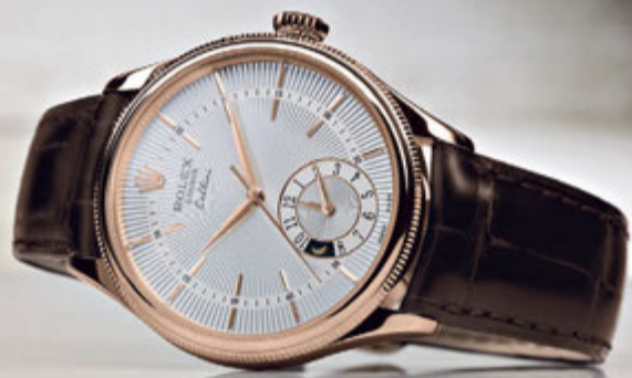
CELLINI DUAL TIME