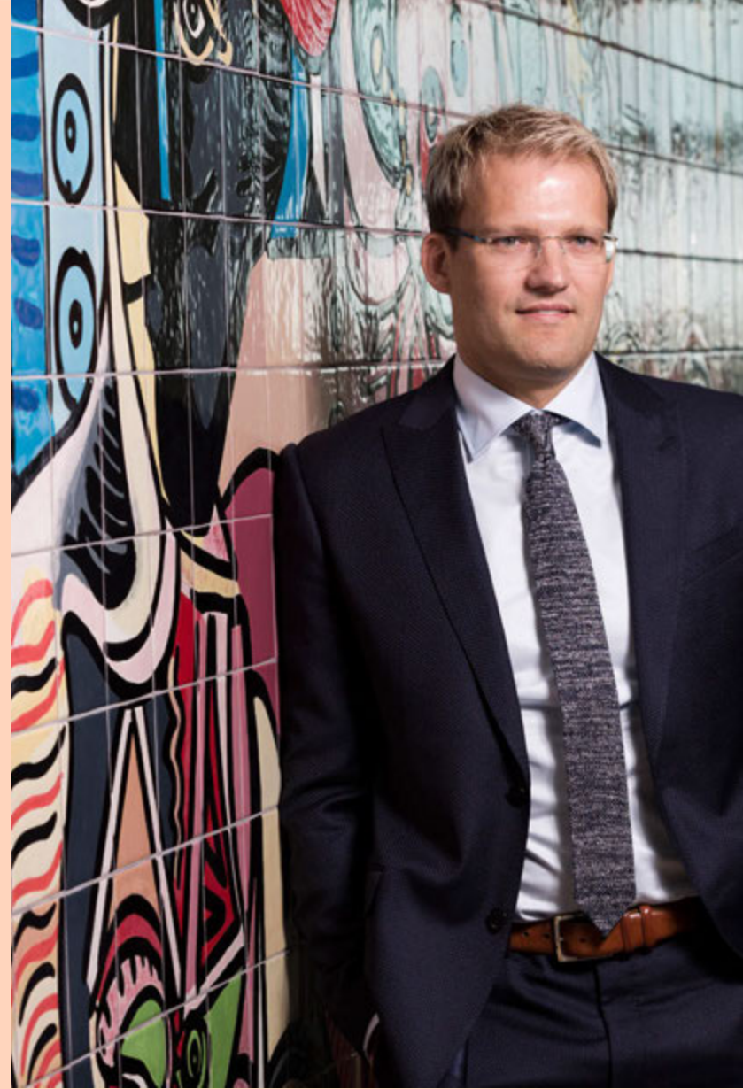
Róbert segir Íslandi bjóðast einstakt tækifæri til að byggja upp iðnað fyrir líftæknilyf.

„Síðan er náttúrulega stór fjárfesting yfirvofandi næstu tuttugu árin í þróun á þessum lyfjum. Við reiknum með að eyða í það heila 75 milljörðum í þau lyf sem eru núna í þróun.“ Þar af verði 35-40 prósent af kostnaðinum á Íslandi.