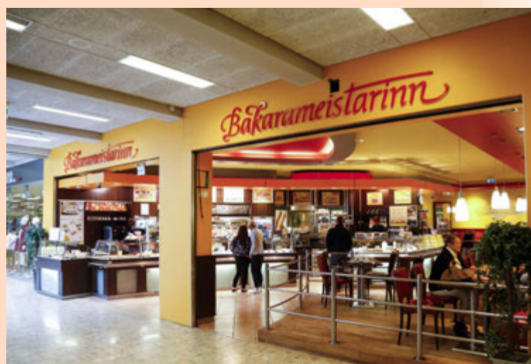
Meginstarfsemi Bakameistarans felst í brauð- og kökugerð, en starfsemi fyrirtækisins er á sex stöðum á landinu.