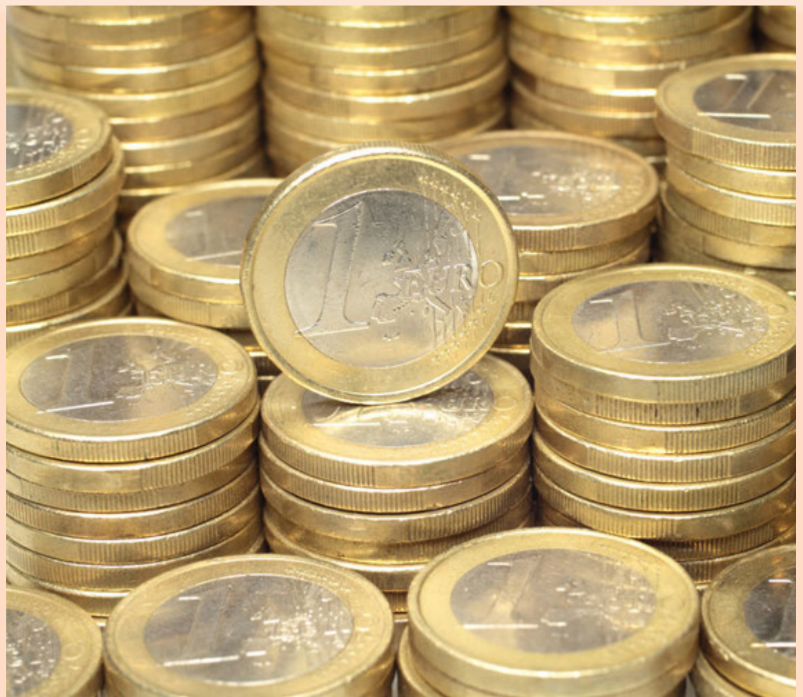
Stór hluti utanríkisviðskipta Íslendinga er við ríki sem nota evru sem gjaldmiðil.

Netfang auglýsingadeildar auglysingar@markadurinn.is Veffang visir.is