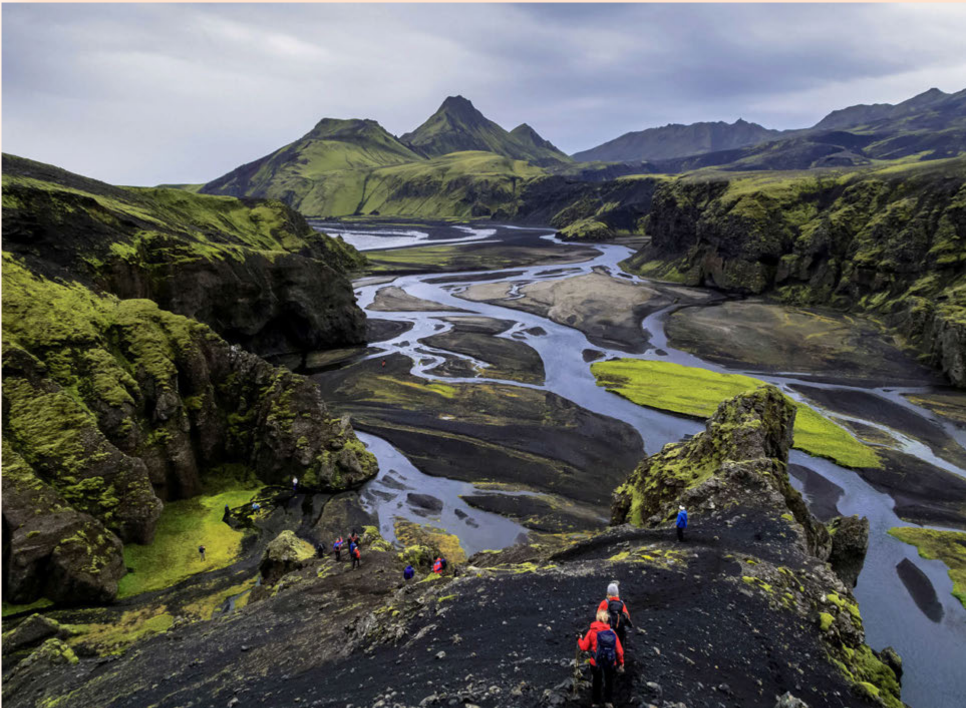
Gönguhópur á leið um Hvanngil við Skaftá. Uxatinda má sjá í baksýn. Margfalt fleiri ferðast nú um hálendið fótgangandi en áður og tekjur ferðaskipuleggjenda aukast samhlíða því.