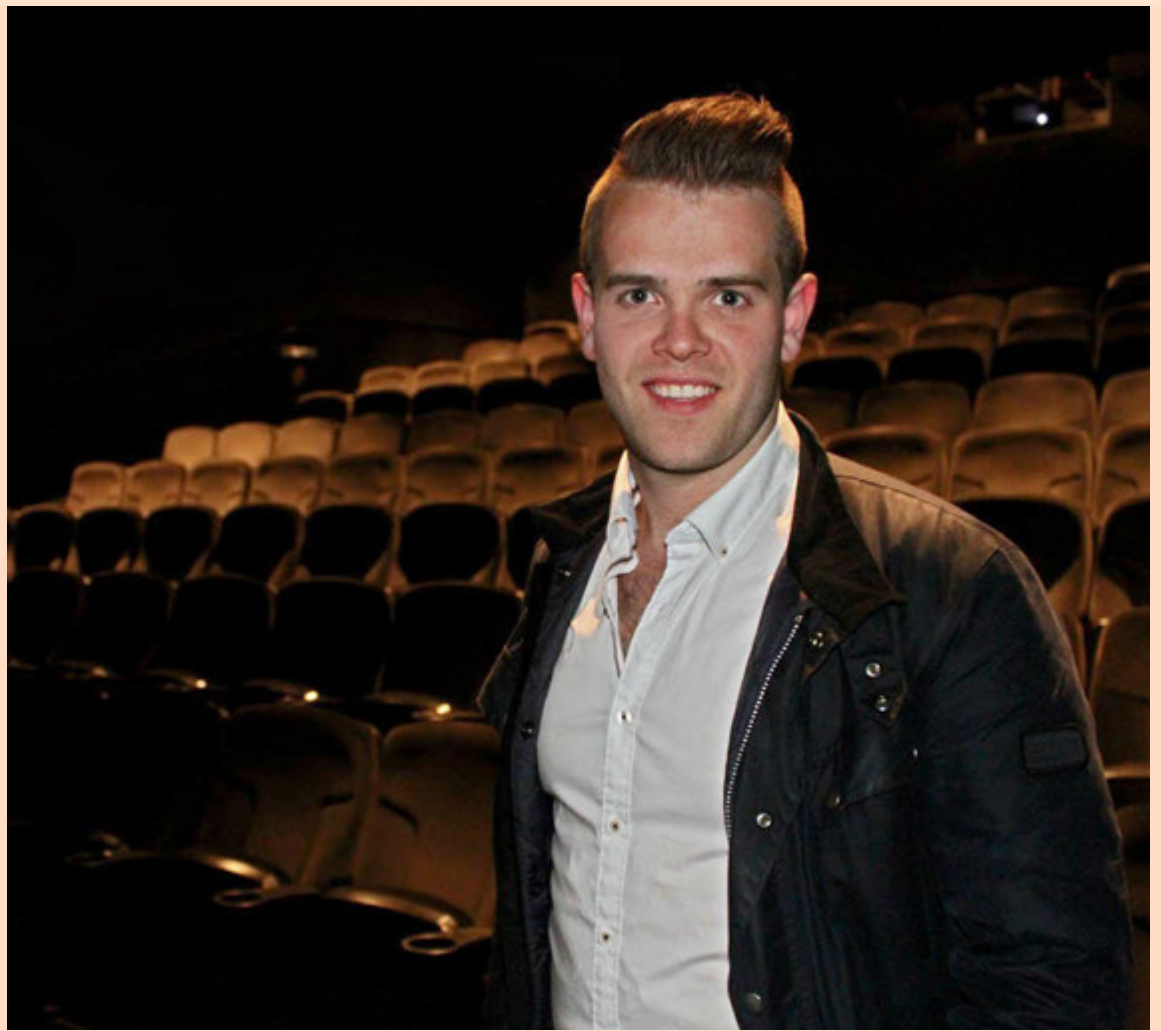
Axel rekur einnig Selfossbíó og mun bæta við nýjum sal þar á næstunni.