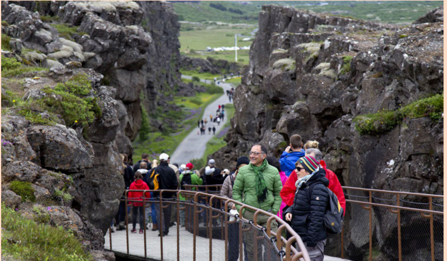
Útflutningur hefur vaxið hægt og orðið einsleitari, en ferðaþjónusta stendur nú undir þriðjungi heildarútflutnings segir í skýrslunni.

Vöxtur útflutnings hafi verið undir markmiði á tímabilinu, á síðustu fjórum árum hefur landsframleiðsla vaxið um samtals tólf prósent á meðan útflutningur hefur vaxið um átta prósent. Vöxturinn hefur nær eingöngu verið drifinn áfram af ferðaþjónustu. Einsleitari útflutningur geri íslenska hagkerfið berskjaldaðra fyrir áföllum en áður. Til að tryggja