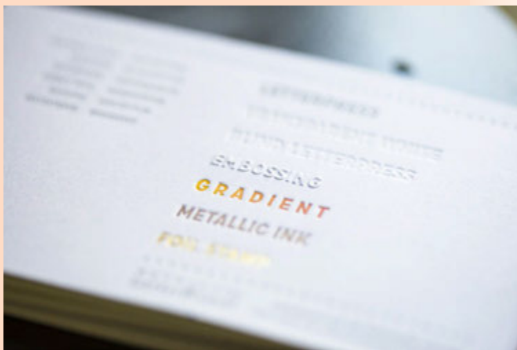
Hæðarprentunin er einstök hérlendis, hönnunarstofan framleiðir meðal annars tækifæriskort.

60% veltuaukning hefur orðið hjá Reykjavík Letterpress í ár miðað við sama tíma í fyrri.