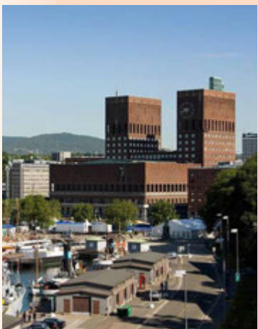
Bílar bannaðir í miðborg Óslóar 2019.

hagkerfisins sem flytur út vörur og þjónustu án þess að treysta á náttúruauðlindir. Til að hagvöxtur geti bæði verið kröftugur og sjálfbær til lengri tíma þarf að mati Viðskiptaráðs að stórefla alþjóðageirann. Íslendingar reiði sig í meiri mæli en áður á nýtingu takmarkaðra náttúruauðlinda, en heildarumsvif fyrirtækja innan alþjóðageirans hafi staðið í stað. Stjórnvöld þyrfti áfram að vinna að umbótum sem styðja við hagvaxtaráætlun Íslands til lengri tíma lítið. saeunn@frettabladid.is