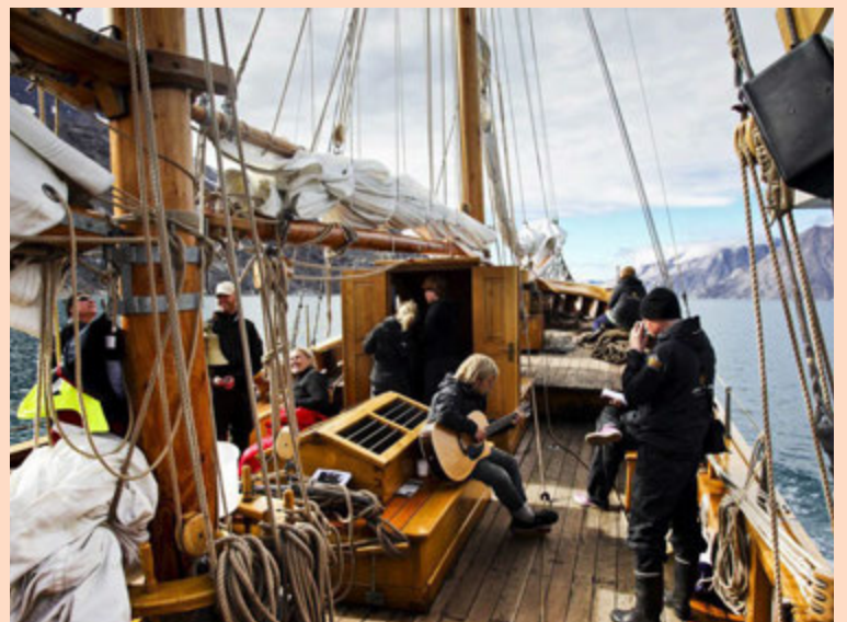
Forsvarsmenn Norðursiglingar freista þess að ná betri nýtingu á skipum sínum með því að hefja starfsemi utan íslenskrar lögsögu.