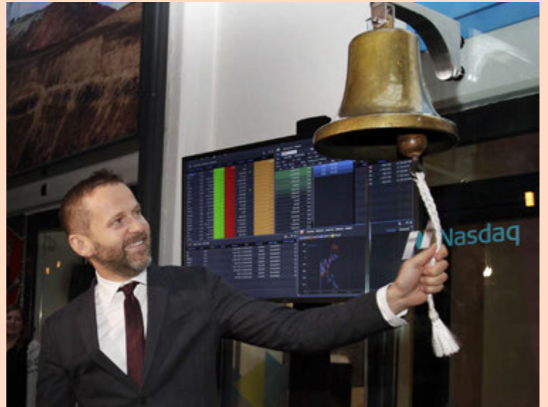
Síminn er síðasta félag sem skráð var á Aðallista Kauphallarinnar en bréf félagsins voru tekin til viðskipta 15. október 2015.