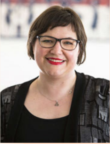
Eliza Reid forsetafrú er verndari sjávarútvegssýningarinnar sem hefst í dag.