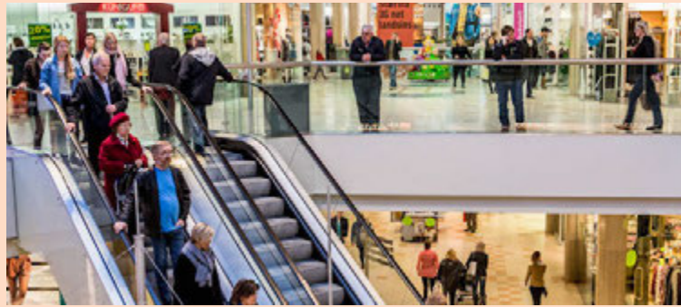
Ísland stendur verst þegar litið er á stærð markaðarins og er þar í 129. sæti af 138 mögulegum.

Ísland stendur verst þegar litið er á stærð markaðarins og er þar í 129. sæti af 138 mögulegum, einnig er þróun fjármálakerfisins í lægri kantinum eða í 53. sæti. Innviðir, skilvirkni vinnu markaðarins og háskólamenntun og þjálfun skora aftur á móti hátt á Íslandi. – sg