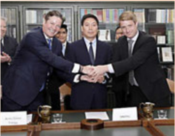
Ætla að vinna saman á sviði rannsóknar og þróunar og á fleiri sviðum.

Eliza Jean Reid forsetafrú er verndari sýningarinnar og við opnun hennar mun hún veita viðurkenningar þeim sem skarað hafa fram úr í greininni í ár að mati nokkurra helstu samtaka í sjávarútvegi. Samtökin sem veita verðlaun á þessari fyrstu sýningu eru: Samtök fyrirtækja í sjávarútvegi, Samtök fiskframleiðenda og útflytjenda, Sjávarklasinn, Sjómannasamband Íslands og Landssamband smábátaeigenda sem mun útnefna trillukarlársins.