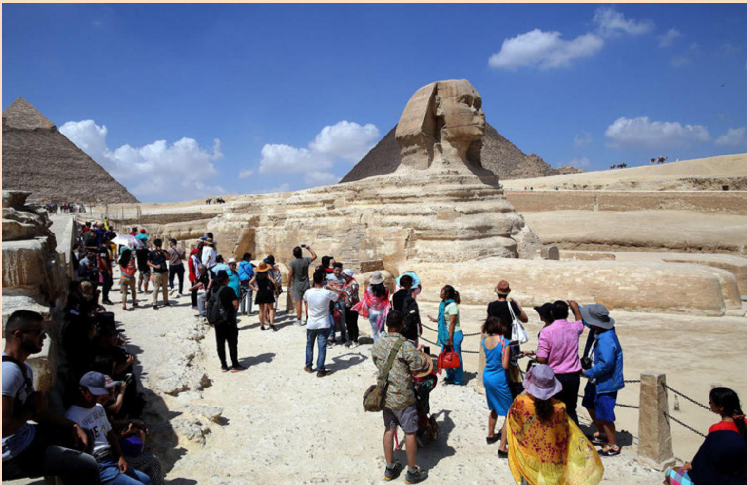
Ferðamenn heimsækja pýramíðana í Gísa á alþjóðlegum ferðamannadegi Sameinuðu þjóðanna. Ferðamenn hafa lengi verið mikilvægur hluti af egypska hagkerfinu og hefur ferðaþjónustan verið ein af meginuppsprettum erlends gjaldeyris í Egyptalandi. Ferðamönnum hefur fækkað verulega í Egyptalandi á síðustu árum en á fyrri árshelmingi dróst fjöldi ferðamanna saman um fimmtíu prósent, samanborið við árið áður.