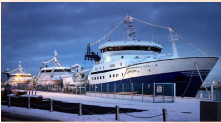
Skip útgerðarfélagssins Brims hf. við landfestar í Reykjavíkurhöfn.