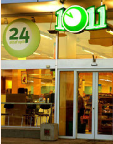
10-11 var fyrst matvöruversluna opin allan sólarhringinn.