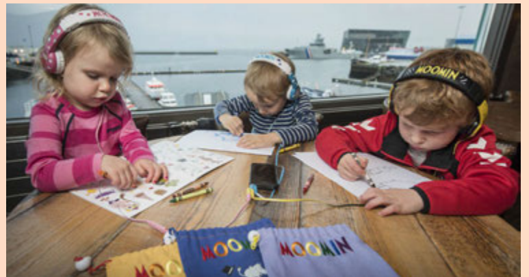
Moomin-lína BuddyPhones fer í sölu í mánuðinum.

„Tölfræði frá Bandaríkjunum sýnir að 13 prósent 16 ára barna í dag eru með heyrnarskaða að einhverju leyti á öðru eða báðum eyrum sem hægt er að tengja beint