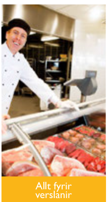
Allt fyrir verslanir