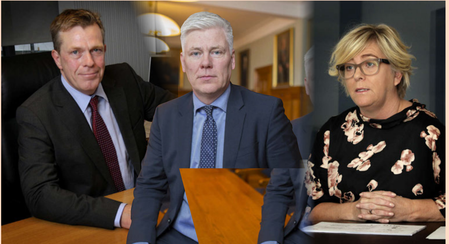
Erfitt er fyrir bankana að ná viðunandi arðsemi af því eigin fé sem bundið er í þeim. Því er líklegt að krafa um eiginfjárlutfall muni lækka verulega þegar gjaldeyrishöft hafa verið afnumin. Breyting á kröfum um eiginfjárlutfall mun leiða til þess að það losnar um mikið fé sem gæti fundið sér arðasamari farveg en nú er.