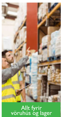
Allt fyrir vöruhús og lager