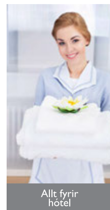
Allt fyrir hótél