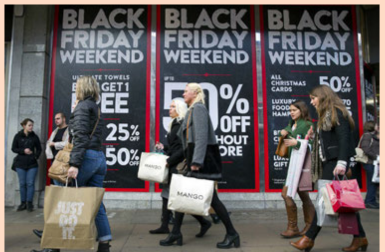
Talið er að 3,5 prósent færri Bandaríkjamenn versli í búðum á deginum í ár en í fyrra.

Þróunin virðist vera að fólk versli jafn mikið fyrir jólin, en sé ekki að