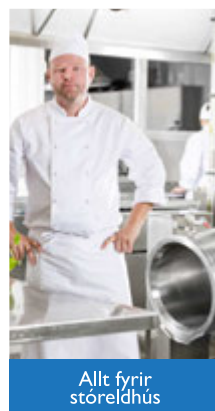
Allt fyrir stóreldhús