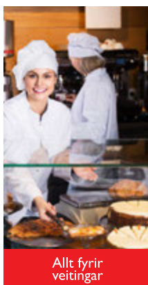
Allt fyrir veitingar