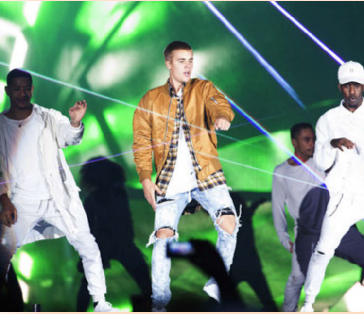
Áætlað er að tekjur af tónlist muni aukast um sex prósent á árinu.