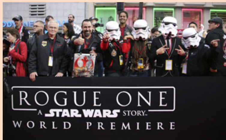
Disney ætlar að framleiða Star Wars-myndir fram á næsta áratug.

Disney getur gert meira úr Star Wars en Lucas gat gert sjálfur, nóg