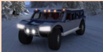
Bíllinn hefur verið þróaður af Ísar.

» Fyrsti fjöldaframleiddi íslenski bíllinn verður kynntur á Nýsköpunarmóti Álklasans í Háskóla Íslands.