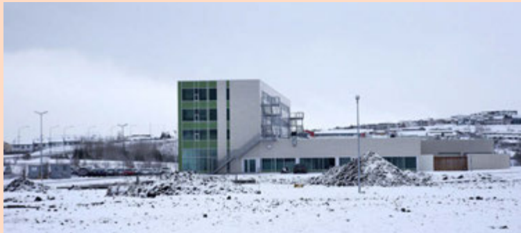
Laugar fengu lóð við Tjarnarvelli en Reebok rekur stöð í götunni.

„Ég reyndi við Suðurbæjarlaug og fékk ekki og hef alltaf haft áhuga á að koma upp alvöru stöð í Hafnarfirði með leikfimisölum og slíku.