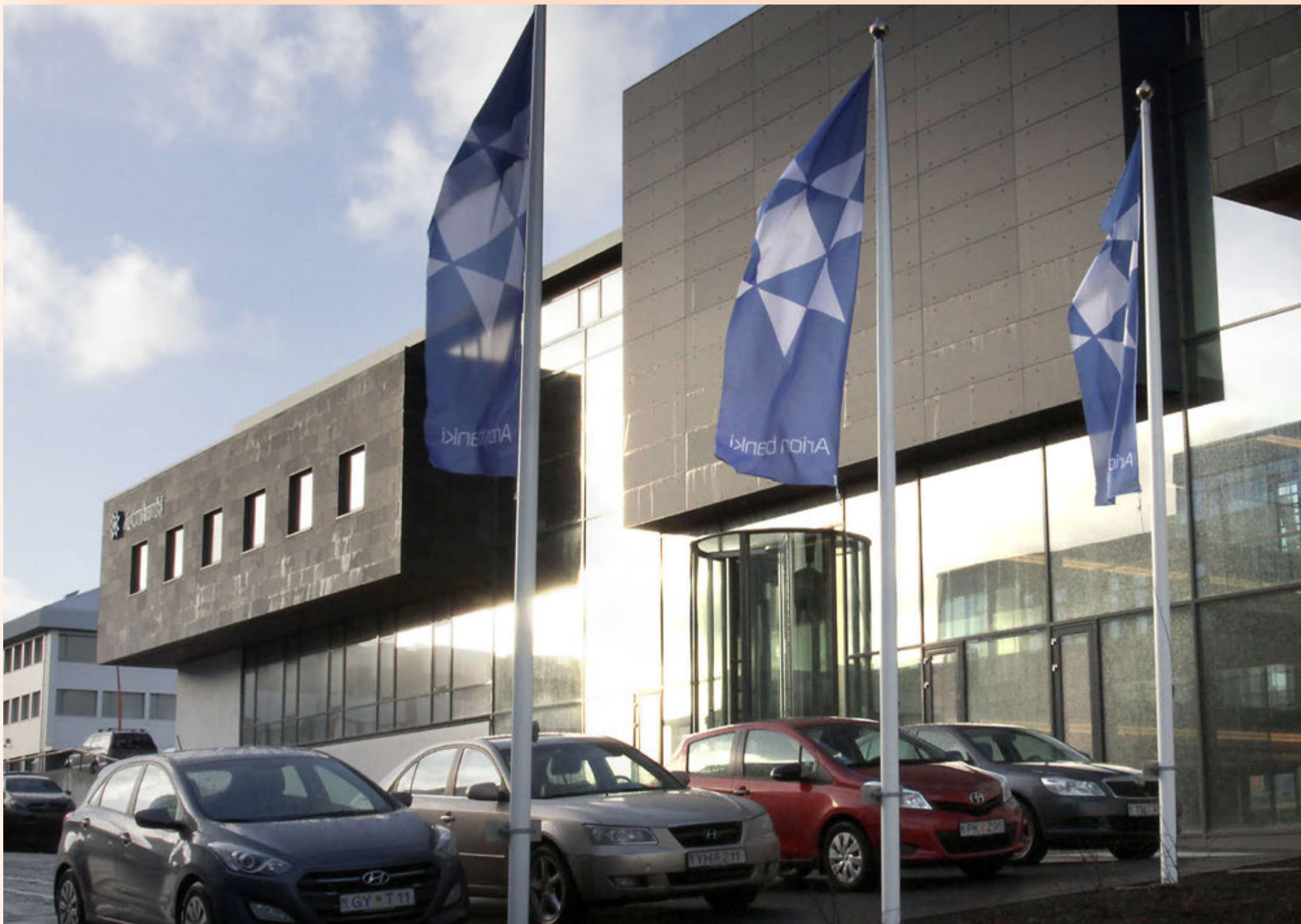
Miðað við fyrirbyggjandi kaupverð er gert ráð fyrir því að bandarísku fjárfestingasjóðirnir og lífeyrissjóðirnir kaupi hlut í Arion banka á genginu rúmlega 0,8 miðað við bólkfært eigið fé.