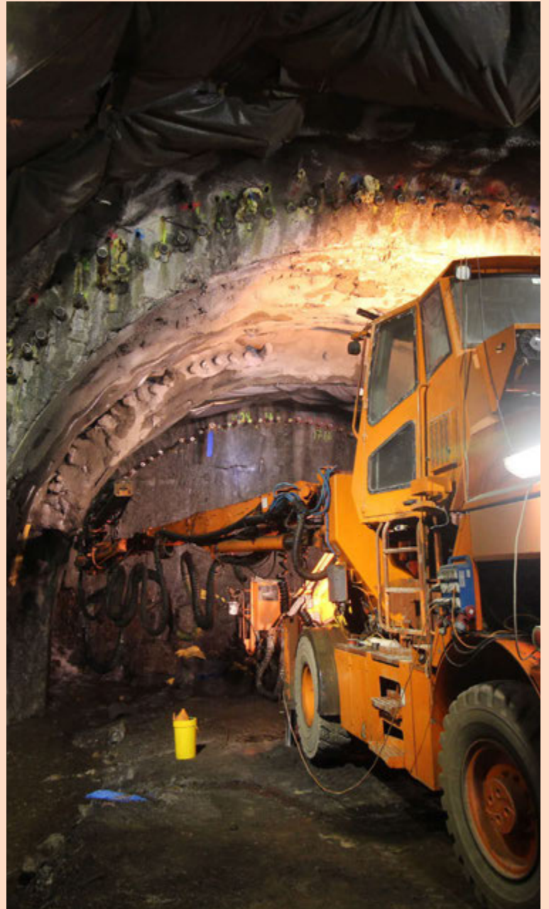
Einungis á eftir að grafa 441 metra í Vaðlaheiðargöngum. Samkvæmt upphaflegri áætlun áttu þau að opna fyrir umferð í desember síðastliðnum.