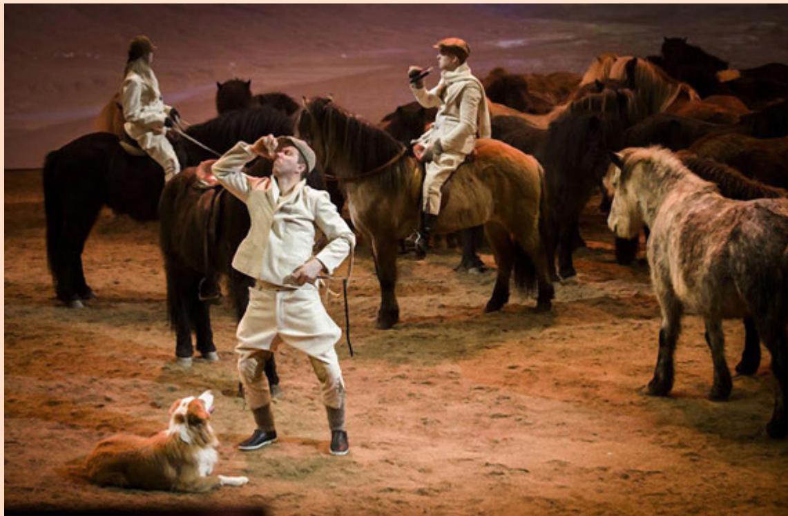
Auk hestasýningarinnar var boðið upp á ferðir í hesthúsin og í Fákaseli var einnig veitingastaður og verslun.

Orkustofnun - Grensásvegi 9 - 108 Reykjavík Sími 569-6000 - www.os.is