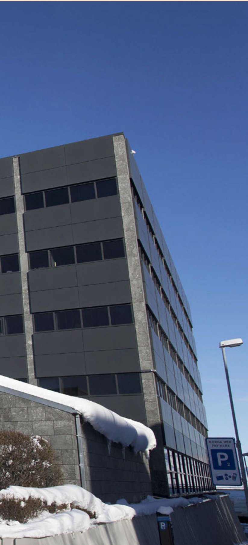
krónunnar, verði ekki réttlættar með vísan til efnahagslegrar nauðsynjar.