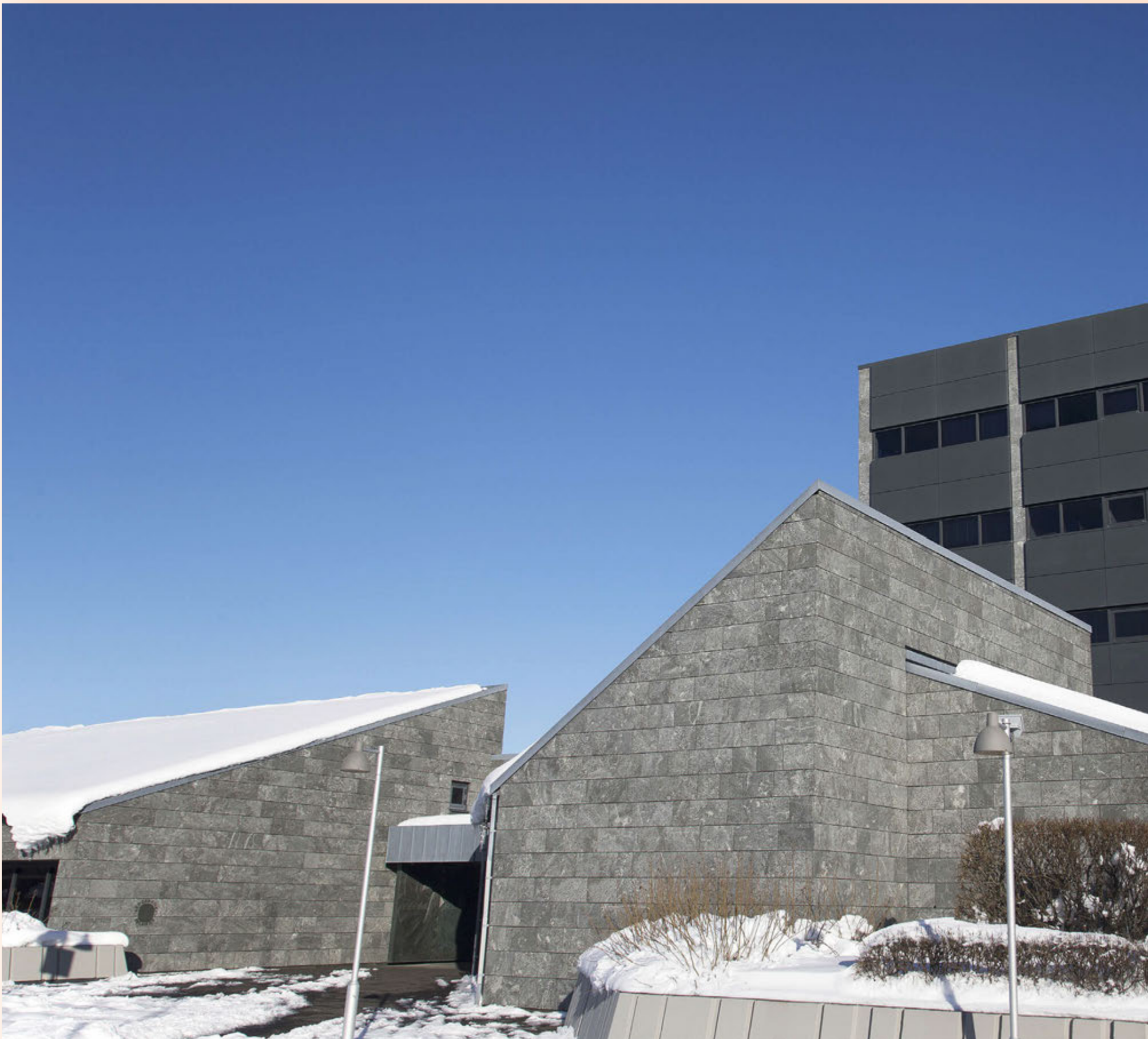
Fjárfestingarsjóðirnir hafa verið þeirrar skoðunar að aðgerðir stjórnvalda í tengslum við útboð Seðlabankans, þar sem eigendum aflandskróna gafst færi á að skipta þeim í erlendan gjaldeyri á afslætti miðað við skráð gengi krónunnar.