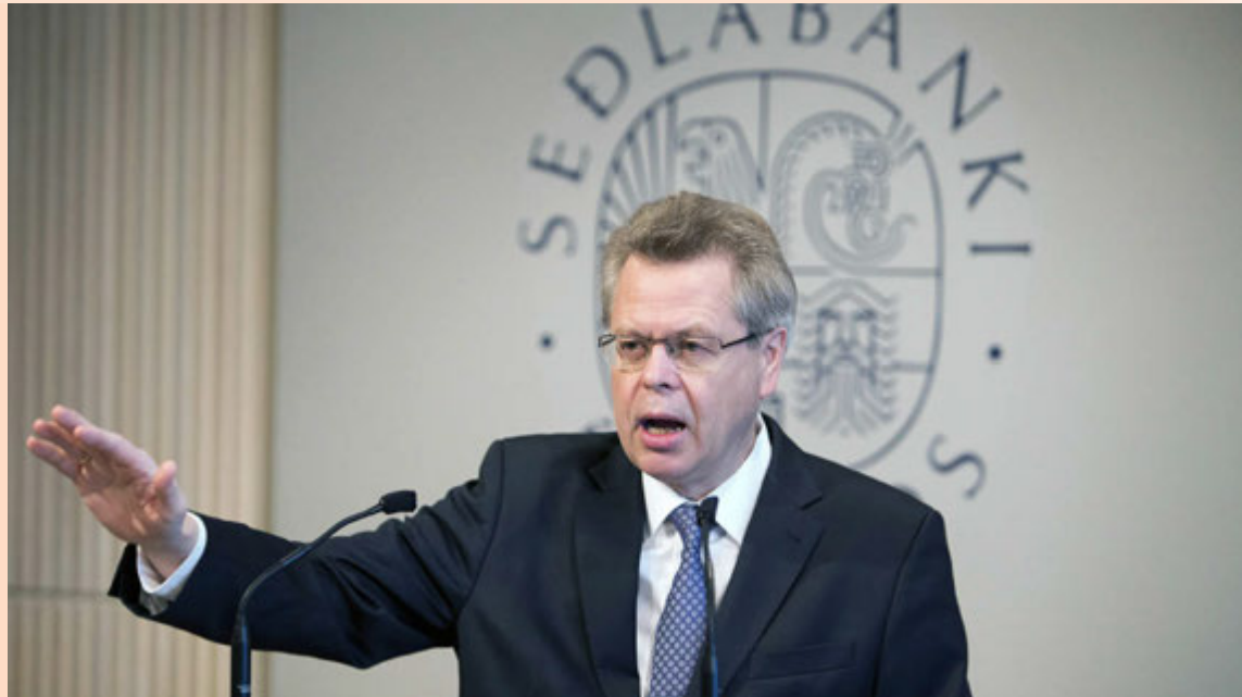
Már Guðmundsson seðlabankastjóri en Seðlabanki Íslands hélt síðast gjaldreyrisútboð fyrir aflandskrónueigendur í júní 2016. Þá samþykkti bankinn tilboð fyrir alls 83 milljarða króna á genginu 190 fyrir hverja evru.

Í kjölfar gjaldreyrisútboðs Seðlabankans áttu sér áfram stað óformlegar viðræður við þá bandarísku sjóði sem tóku ekki þátt í útboðinu þar sem leitast var við að ná samkomulagi til að leysa út eignir þeirra. Lítið þókaðist hins vegar í átt að samkomulagi en sjóðirnir vildu þegar þarna var komið, síðsumars 2016, ekki ljá máls á því að selja aflandskrónueignir sínar á gengi