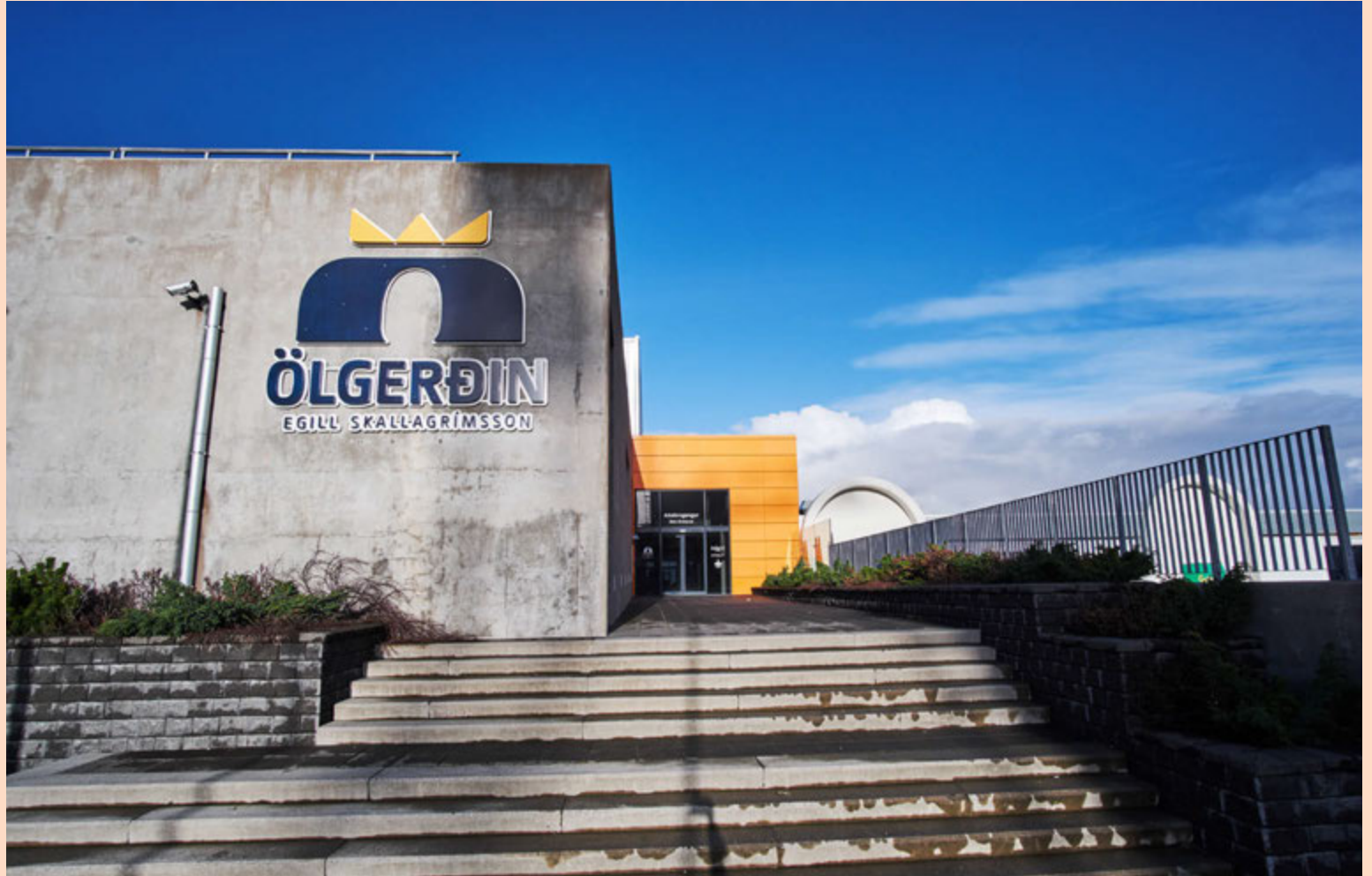
Sala á eignarhlutum í Ölgerðinni var undirrituð um miðjan október. Þann sama dag var synjun á lögbannsbeiðninni tekin fyrir í héraði.