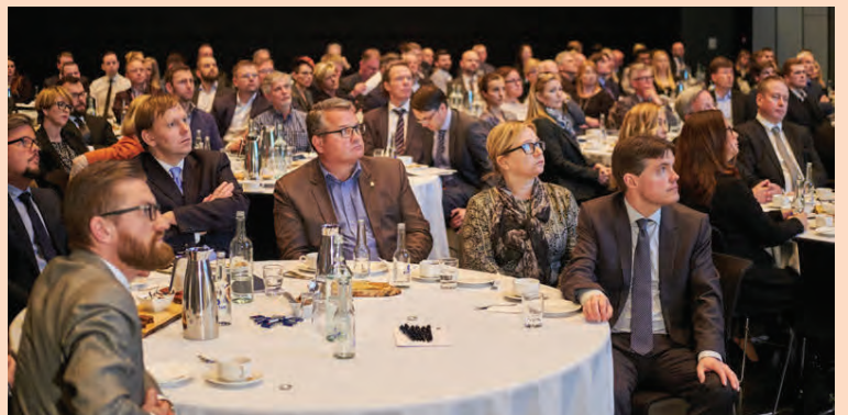
Heimild til kaupa á eigin hlutum í Landsbankanum var veitt á aðalfundi hans í apríl í fyrra.

Samkvæmt ársreikningi Landsbankans fyrir 2016 fækkaði hlut-