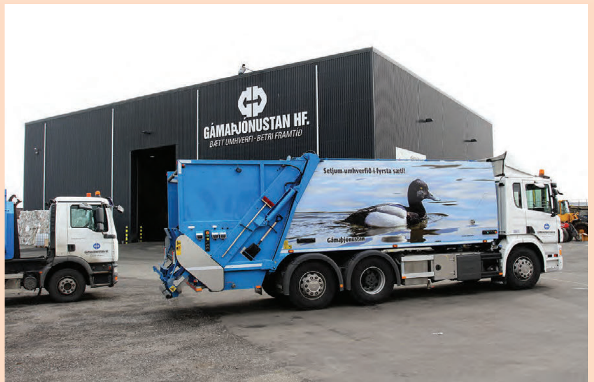
Heildarvelta Gámaþjónustunnar og dótturfélaga hennar á árinu 2015 var 4,45 milljarðar.

Reykjavík, 19. apríl 2017. Prófnefnd verðbréfavíðskipta