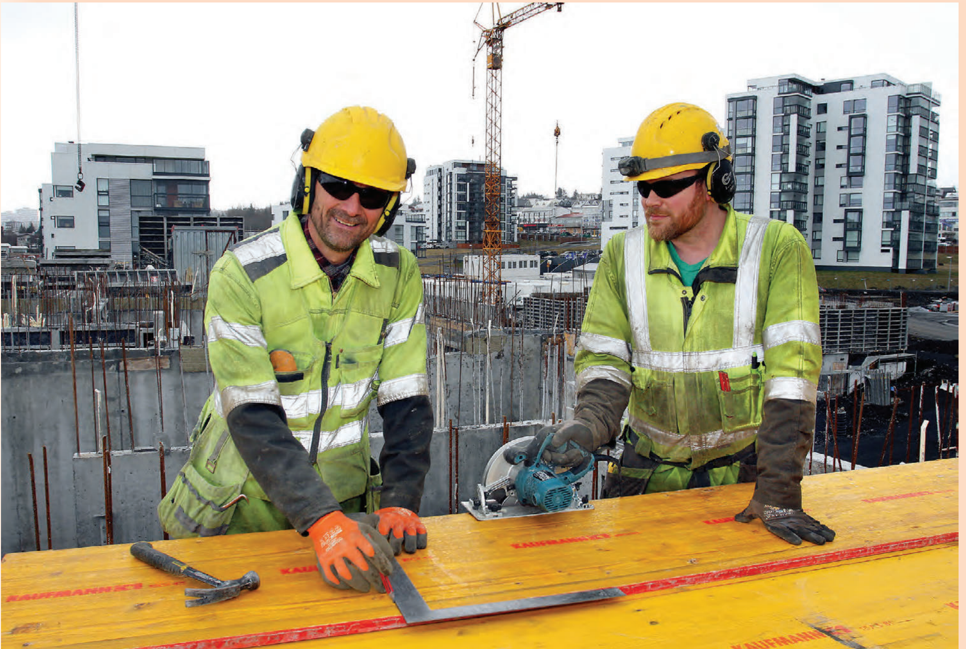
Gengisáhrif krónunnar til lækkunar á erlendum eignum lífeyrissjóðanna námu tugum milljarða á síðasta ári en þá styrktist gengi krónunnar um rúm 18 prósent.