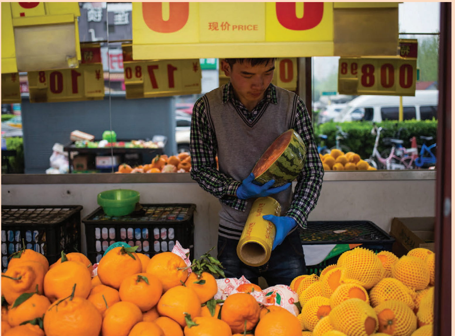
Verg landsframléiðsla í Kína jókst um 6,9 prósent á fyrsta ársfjórðungi þessa árs samkvæmt nýbirtum tölum frá kínversku hagstofnunni. Hér má sjá kínverskan verslunarrekanda þar sem hann raðar ávöxtum í verslun sinni í Peking í gær áður en morguntraffíkin hófst.