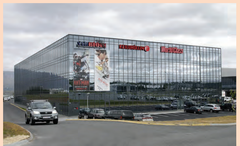
Gleðipinnar keypti Keiluhöllina í febrúar 2015.

Eignir félagsins í árslok 2016 námu 133 milljónum og bókfært eigið fé var jákvætt um 22 milljónir. Félögin Immis ehf., í eigu Sigmars Vilhjálmssonar, og Hinir ehf., í eigu Jóhannesar Asbjörnssonar, eru stærstu eigendur Gleðipinna með hvor sín 26,7 prósentin. Múlakaffi á 15,8 prósent sem og félagið Granat