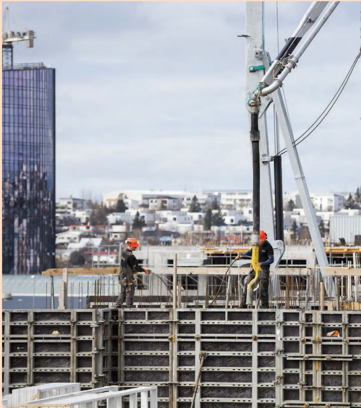
Gert er ráð fyrir að fjárfesting í hótelum á höfuðborgarsvæðinu muni nema um 46 milljörðum króna á næstu fjórum árum.

Ekki þarf að fara mörgum orðum um að uppbygging hótela er fjármagnsfrök og hlýtur að krefjast töluverðrar lánaþyrngreiddslu. Samkvæmt upplýsingum frá Seðlabankanum hefur snörp lækkun orðið á hlutfalli eigin fjár í fjármögnun ➔