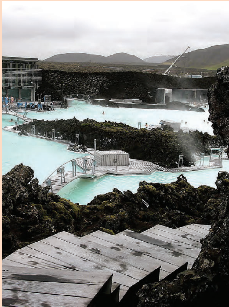
Tekjur Bláa lónsins voru yfir 10 milljarðar í fyrra.

Hlutfélagið Hvatning er stærsti eigandi Bláa lónsins með ríflega 39