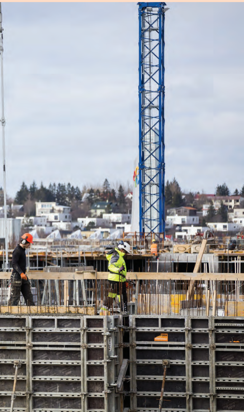
Mun hótélherbergjum fjölga um tvö þúsund á sama tíma.