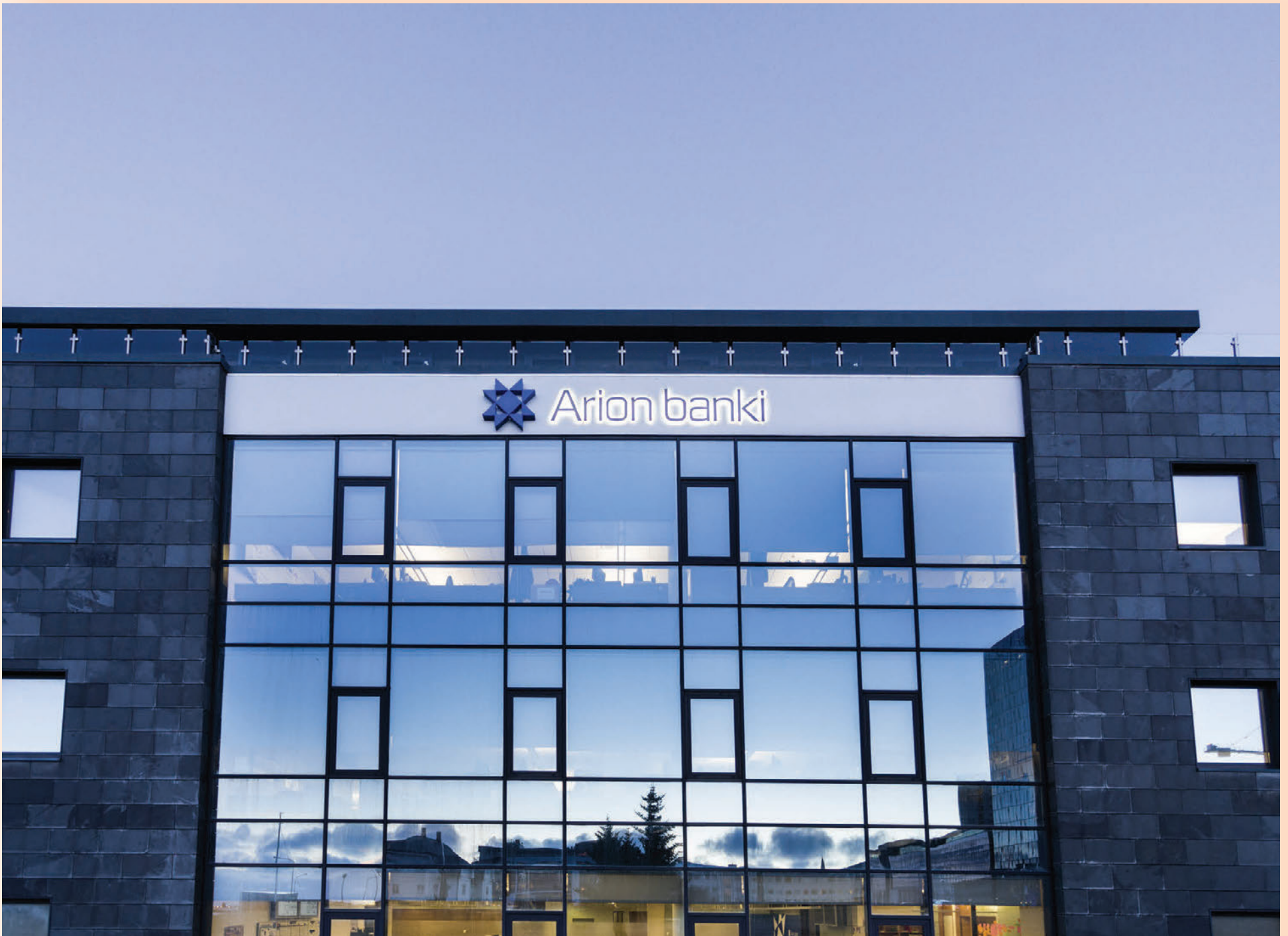
Fjárfestarnir sem keyptu samtals um 30 prósentu hlut í Arion banka fyrir á árinu hafa kauprétt að 22 prósentu hlut til viðbótar í bankanum til 19. september næstkomandi.