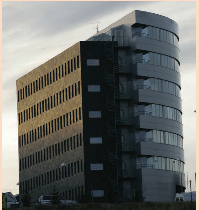
ALM Verðbréfa eru til húsa í Sundagörðum við Skarfabakka.

hluthafar og stjórnarmenn í fyrirtækinu A Faktoring, sem sérhæfir sig í reikningakaupum án endurkröfu, en fyrirtækið á í margs konar samstarfi við ALM Verðbréfa. Þannig veita fyrirtækin til að mynda saman milligöngu um fjármögnun, svo sem endurfjármögnun skulda eða langtímafjármögnun atvinnuhúsnæðis, fyrir fyrirtæki og fjárfesta. Er ALM Verðbréfa enn fremur stór hluthafi í A Faktoring.