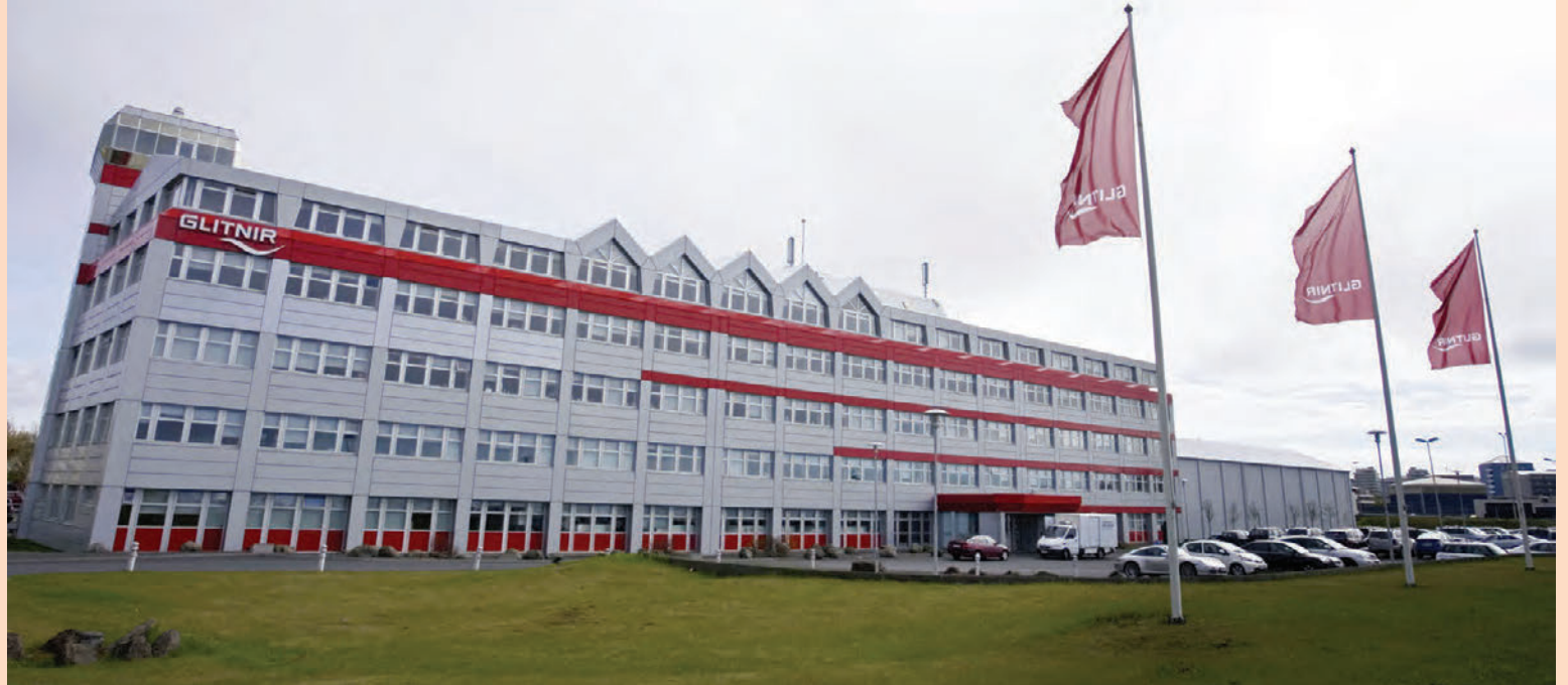
Eignarhaldsfélagið Glitnis HoldCo, sem var stofnað á grunni eigna slitabús Glitnis banka í lok árs 2015, hefur höfðað mál á hendur Brimi vegna tveggja milljarða króna kröfu. Málið verður tekið fyrir í Héraðsdómi Reykjavíkur í næsta mánuði. Dómstólar hafa ekki fallist á frávisunarkröfu Brims.