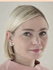
Lilja Alfreðsdóttir alþingismaður

Áskoranir íslenskrar hagstjórnar eru margvíslegar og hverfa ekki þótt vel ári. Það er erfitt að hafa áhrif á ýmsa þætti hagstjórnar hér á landi, til að mynda hversu smátt hagkerfið okkar er eða að útflutningurinn er að mestu byggður á náttúruauðlindum og því sveiflukennari en ella. Hins vegar eru ákveðin verkefni sem stefnumótandi aðilar hafa á sínu valdi sem mikilvægt er að ráðast í til að styrkja umgjörð hagkerfisins og viðnámsþrótt þess. Annars vegar að efla traust á fjármálakerfinu og hins vegar endurskoðun peningastefnunnar. Til að stefnumótunin sé farsæl, þá þarf að tvinna þessa tvo þræði saman.