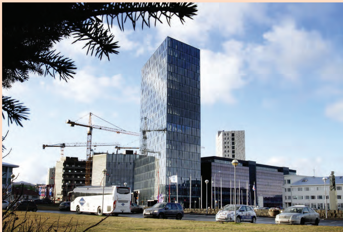
Fasteignafélagið FAST-1 keypti turninn við Höfðatorg af Íslandsbanka árið 2013.

Netfang auglýsingadeildar auglysingar@markadurinn.is Veffang visir.is