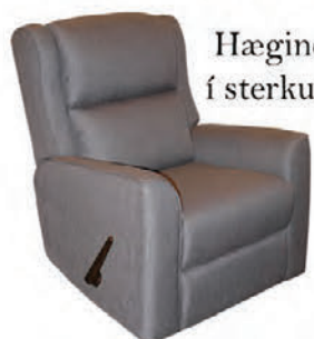
Hægindastóll í sterku áklæði