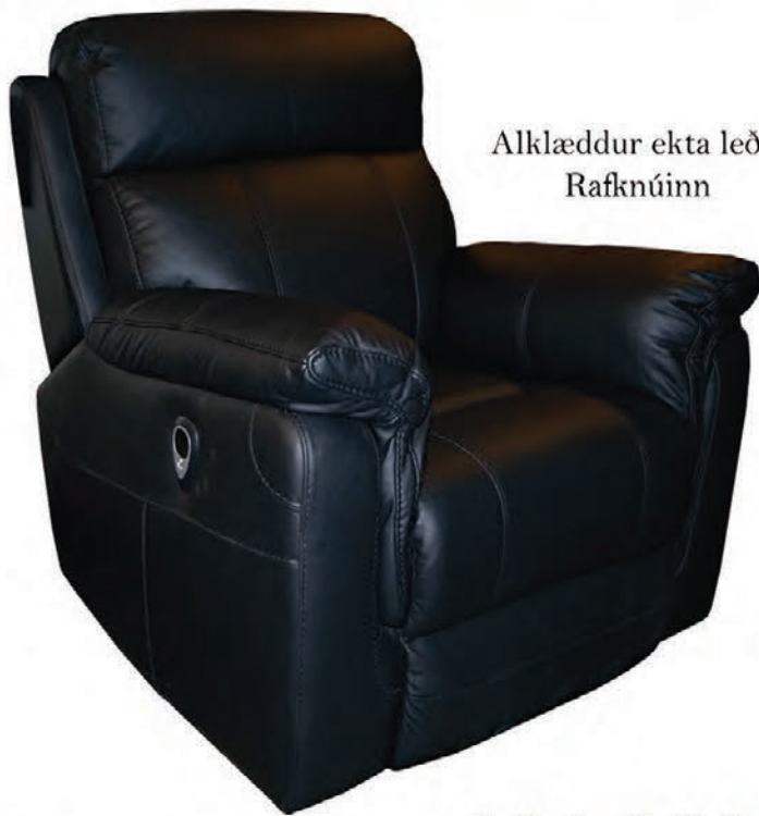
Alklæddur ekta leðri Rafknúinn

Skoðið úrvalið í vefverslun okkar - www.husgagnabankinn.is