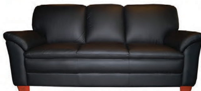
Alklætt ekta leðri