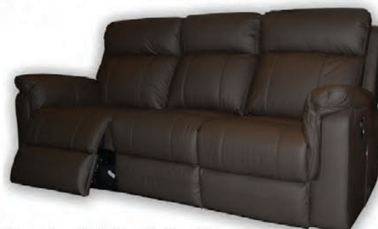
Alklæddur ekta leðri - Rafknúinn