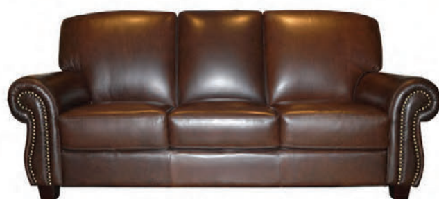
Alklætt hágæða leðri