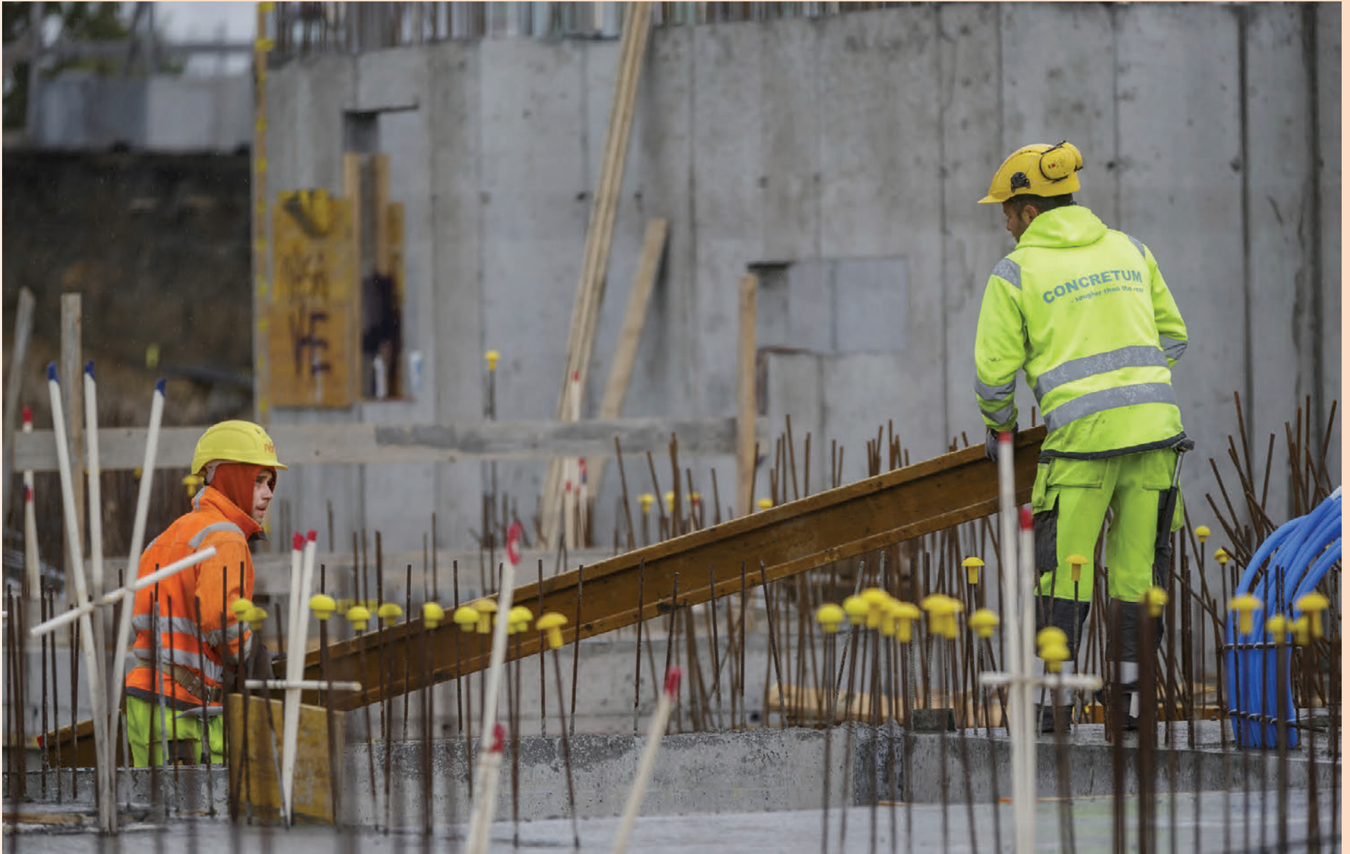
Stóraukinni eftirspurn eftir vinnuafli að undanförunu hefur að töluverðu leyti verið mætt með innflutningi á vinnuafli. Í hausthefti Peningamála Seðlabanka Íslands var til að mynda bent á að fjölgun erlendra ríkisborgara hefði átt ríkari þátt í fjölgun íbúa á fyrri hluta þessa árs en á öllu síðasta ári. Ein birtingarmynd aukins innflutts vinnuafis er vaxandi umsvif starfsmannaleiga.