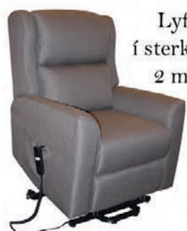
Lyftistóll í sterku áklæði 2 mótórar