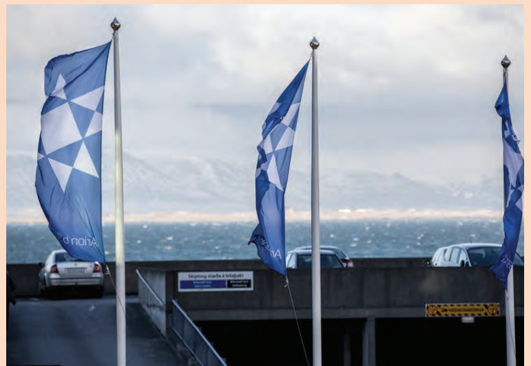
Stefnt er að skráningu Arion banka síðar á árinu.