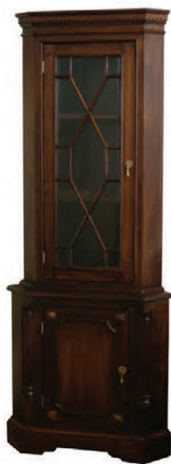
Hornskápur - Tilboð