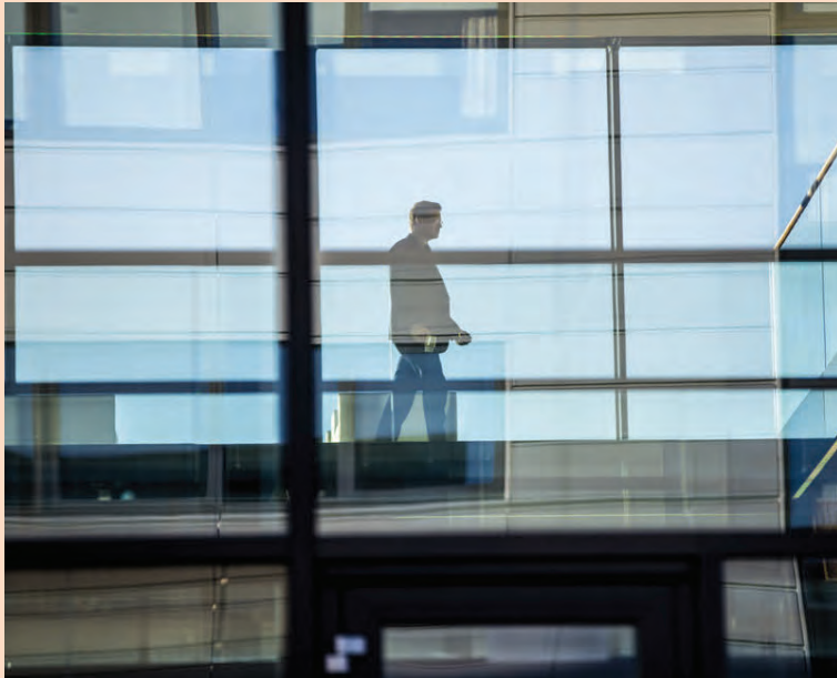
Til langtíma stendur íslenskum fjármálafyrirtækjum meiri ógn af erlendum stórfyrirtækjum en nýjum innlendum keppinautum.

Það væri hins vegar óráðlegt að heimfæra þróunina af fjarskiptamarkaði 100% yfir á fjármálamarkaðinn þar sem mun meiri samkeppni hefur ríkt á fjármálamarkaði en var við opnun fjarskiptamarkaðarins og sölu ríkissímafyrirtækja til einkaaðila. Sérfræðingar spá því þó að breytingin verði mikil. Þannig eigi leikendum í greiðslumiðlun eftir að fjölga og þeir muni byggja viðskiptamódel sín á allt öðrum tekjugrunni en bankar og kortafyrirtæki gera í dag. Í stað þess að treysta á tekjur af færslugjöldum, árgjöldum,