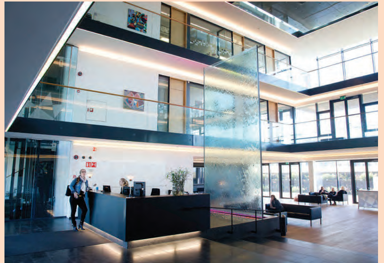
Hlutafjárboð og skráning Arion frestast fram á næsta ár.

Samkvæmt ákvörðun FME teljast Taconic og Kaupþing vera í samstarfi í skilningi laga um fjármála-fyrirtæki. Vogunarsjóðurinn er