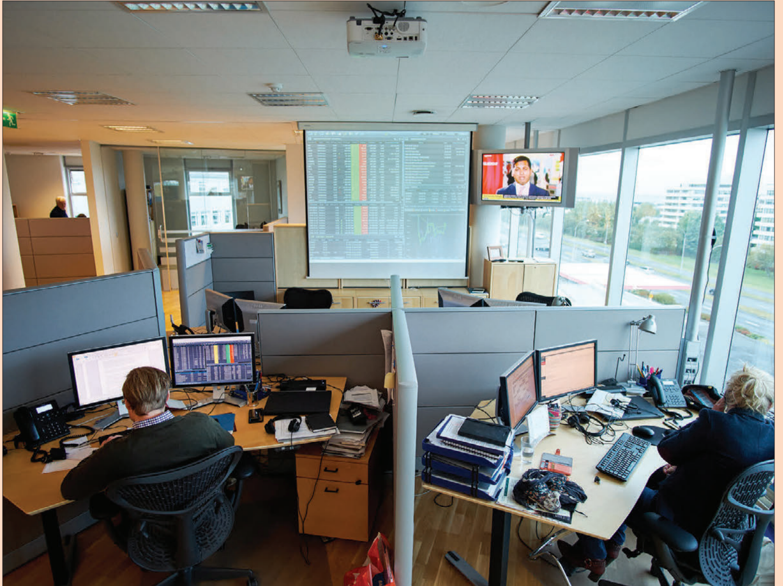
Kosningaskjálfti hefur gert vart við sig á mörkuðum undanfarna daga. Hann lýsir sér meðal annars í því að verðbólguálag á skuldabréfamarkaði hefur þokast upp á við og hlutabréfaverð farið lækkandi. 32 milljarðar króna gufuðu upp á verðbréfamörkuðum daginn eftir fall ríkisstjórnarinnar.

Lækkarnir hafa haldið áfram undanfarna daga, en sem dæmi hefur úrvalsvísitala Kauphallar-