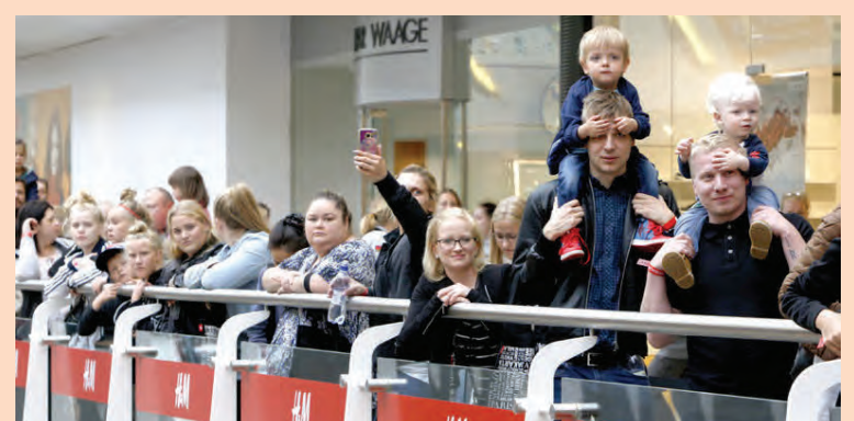
Greiningardeildin segir að dagleg velta H&M fyrstu dagana í Smáralind hafi verið um 28 milljónir króna.

Sérfræðingar Arion banka meta virði hvers hlutar í Regin á 28,7 krónur á hlut. Til samanburðar var virðismatsgengið 27,4 krónur á hlut í síðasta virðismati í mars. Segjast sérfræðingar bankans sjá fram á mikil tækifæri á næstu árum vegna fyrirhugaðra fjárfestinga, meðal annars á Hafnartorgi.