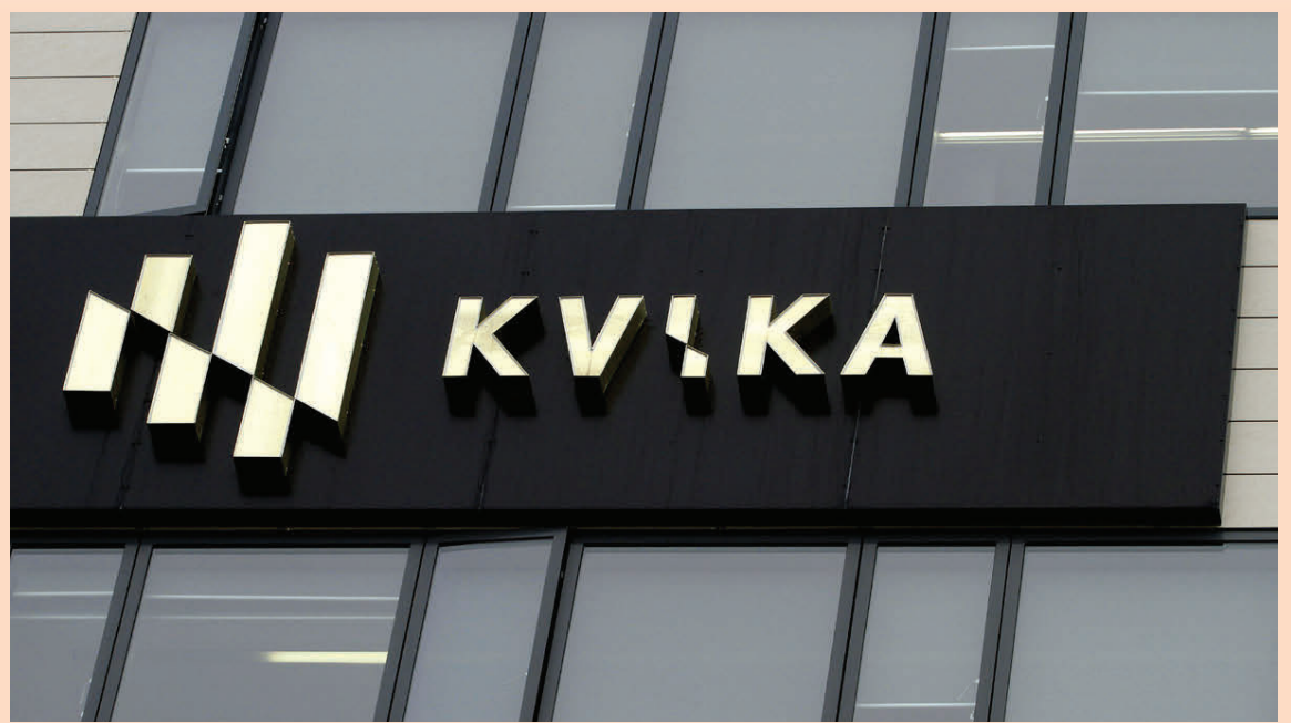
Kvika banki stefnir á First North markaðinn í Kauphöllinni fyrir árslok.