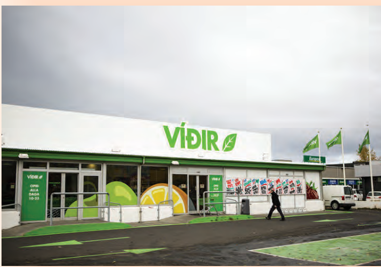
Fyrsta verslun Víðis var opnuð í Skeifunni 2011.