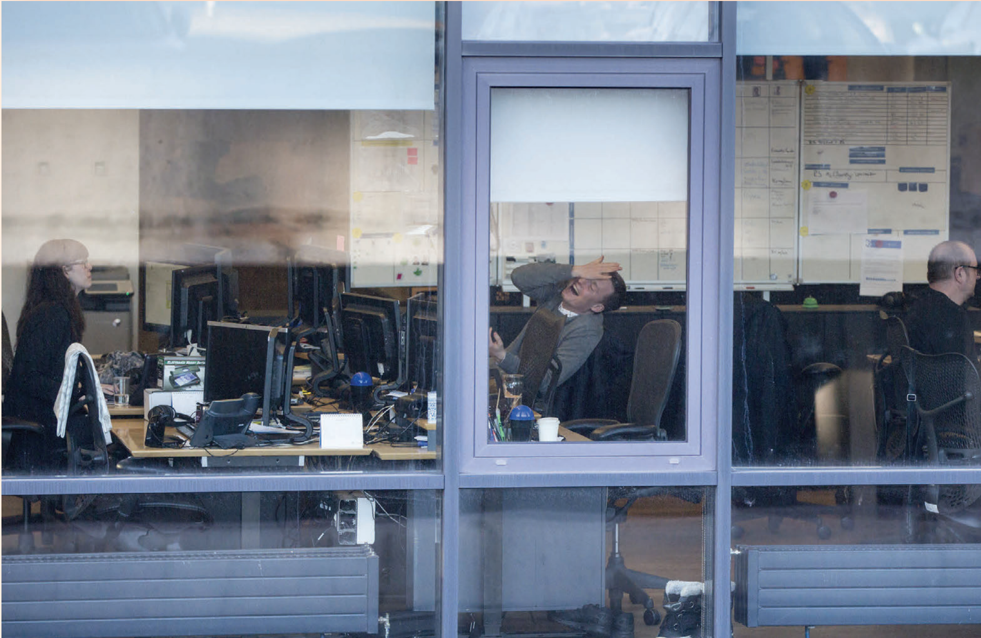
Gagnrýnt hefur verið að reglur um kaupaukakerfi komi verst niður á minni fjármálfyrirtækjum. Þau séu útsettari fyrir sveiflum í rekstri og því henti þeim betur að bjóða starfsmönnum lægri föst starfskjör og