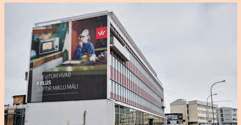
Einkafjárfestar og hlutabréfasjóðir eru umsvifamiklir í hópi stærstu hluthafa VÍS. Hafa lífeyrissjóðir verið að minnka hlut sinn.

Miðað við gengi bréfa í tryggingafélaginu í síðustu viku má ætla að kaupverðið á 0,48 prósentu hlutum hafi numið líðlega 120 milljónum króna. Miðað við núverandi gengi bréfa félagsins er eignarhlutur Sigurðar metinn á um 470 milljónir króna.