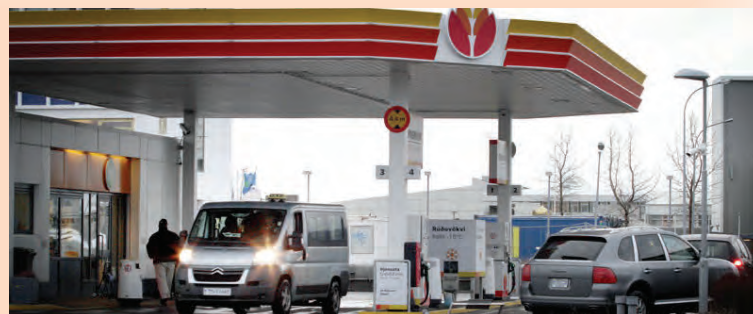
Afkoma Skeljungs var yfir væntingum greinenda á fyrri helmingi ársins.

Sérfræðingar hagfræðideildarinnar gera ráð fyrir meiri tekjuvexti hjá félaginu á næstu þremur árum