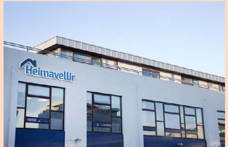
Leigufélagið Heimavellir vinnur hörðum höndum að endurfjármögnun en vaxtaberandi langtímaskuldir þess námu 32 milljörðum í árslok 2017.

Heimavellir hafa vaxið mjög hratt á undanförunum misserum og árum, einkum með yfirtöku annarra leigufélaga og kaupum á eignum af Íbúðalánasjóði. Í árslok 2017 nam virði fjárfestingareigna Heimavalla 53,6 milljörðum. Leigutekjur félagsins voru tæplega 3,1 milljarður á árinu og meira en tvöfölduðust frá fyrra ári. Hagnaður leigufélags-