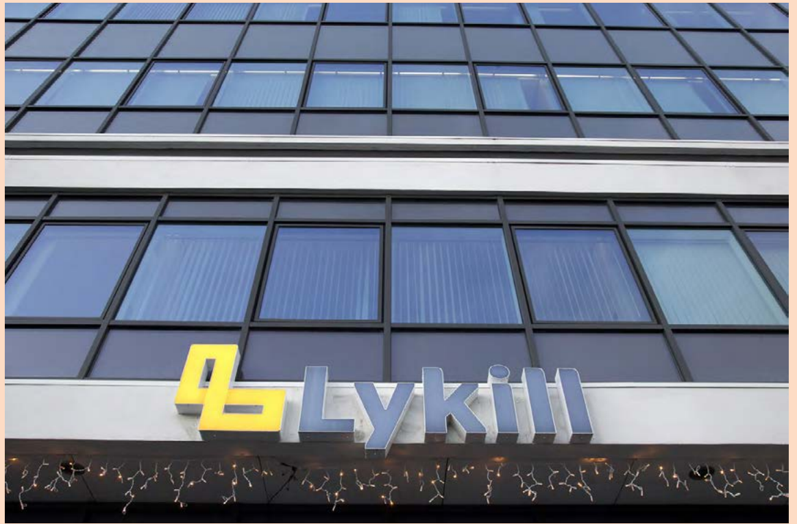
Stærsti eigandi Klakka, sem á Lykil, er vogunarsjóðurinn Davidson Kempner með um 75 prósent.

BLM fjárfestingar, dótturfélag vogunarsjóðsins Burlington Loan Management, átti hæsta tilboðið í 17,7 prósentu hlut ríkisins í Klakka en það hljóðaði upp á 505 milljónir króna. Ásaflöt bauð 502 milljónir í hlutinn en þriðja tilboðið, sem hljóðaði upp á 501 milljón króna, barst frá